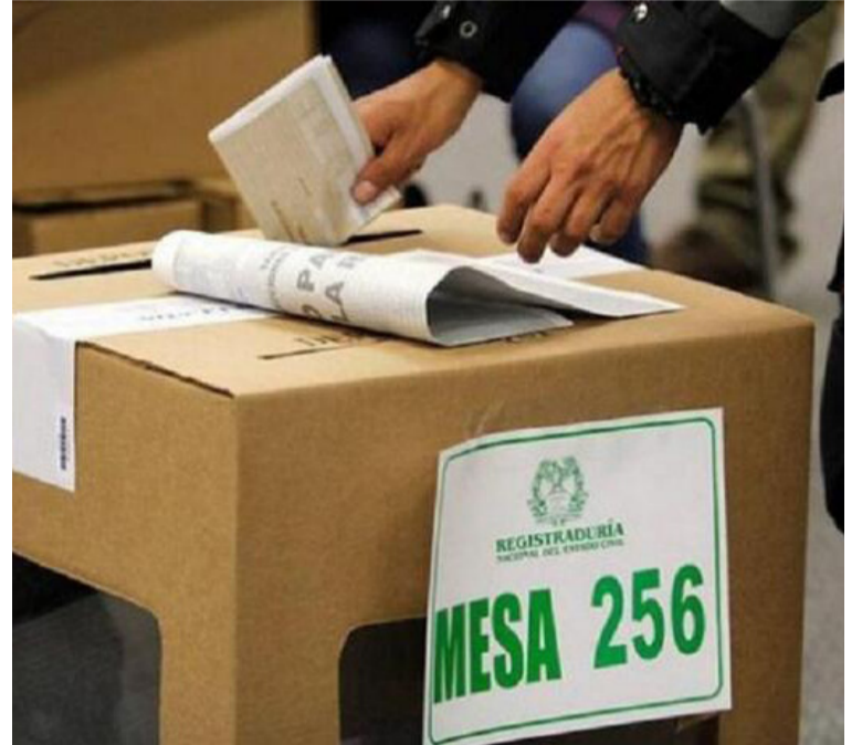
La campaña del Episcopado busca también propiciar un debate electoral respetuoso e incluyente en todo el país.

"No nos dejemos guiar simplemente por lo que aparece en las redes sociales o en los medios de comunicación escritos, radiales, televisivos, etc. Con conocimiento de causa y pensando en el bien común, vote. La participación de más personas en el ejercicio de lo político y de su derecho al voto, la democracia se fortalece", manifestó.