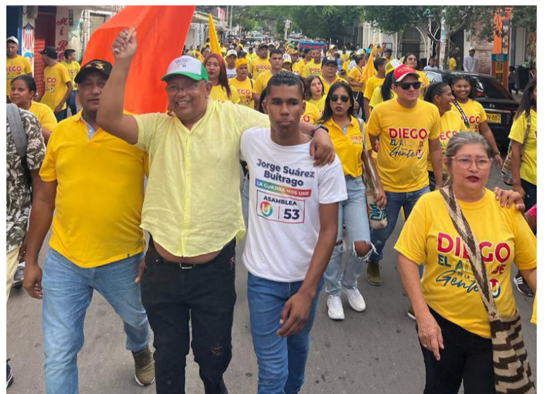
En el lanzamiento del alcalde de la gente, Diego Baquero, se dio la entrega de la bandera anaranjada.