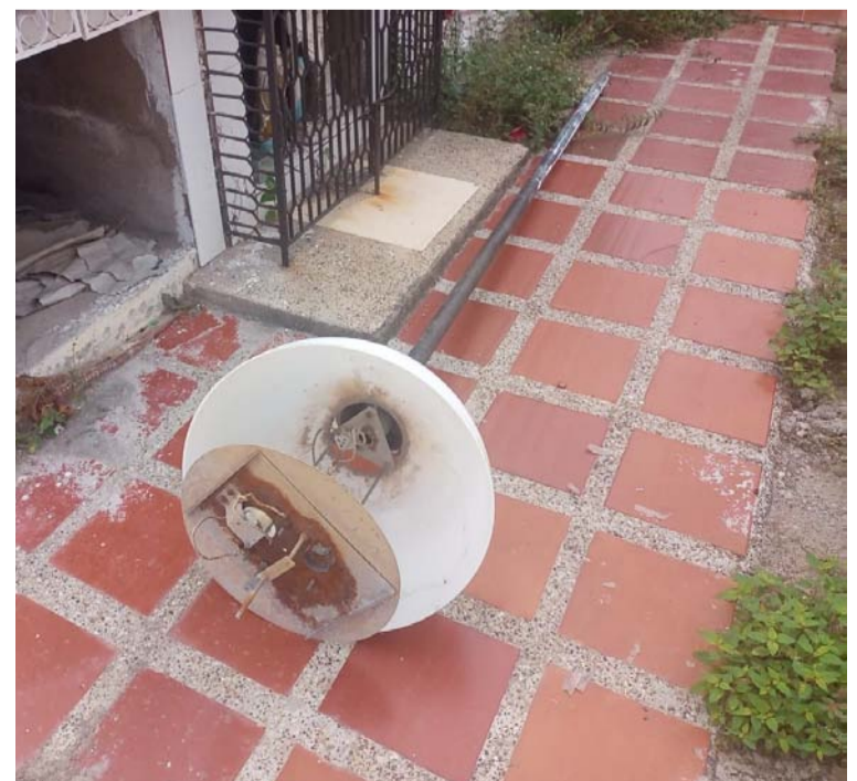
Los antisociales destruyeron y se robaron varios metros de cables de energía eléctrica y dañaron varias lámparas.