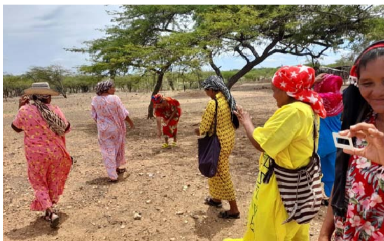
Mujeres de la comunidad identificando fuentes de inspiración para la combinación de sus ecomochilas Kattoui.