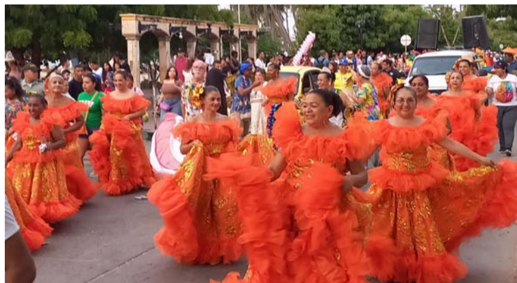
Con el evento finaliza el Festival Internacional de Cuenteros, organizado por la Corporación Tradición y Cultura.

Cae la jornada, se cierra el telón, pero desde ya se adelantan los preparativos de lo que será el cuarto de siglo del Akuentajui en el 2024.