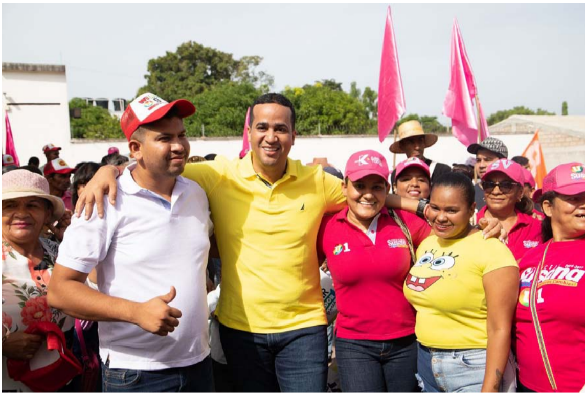
Sus electores dejaron en claro que confían en su palabra y capacidad para dirigir La Guajira.