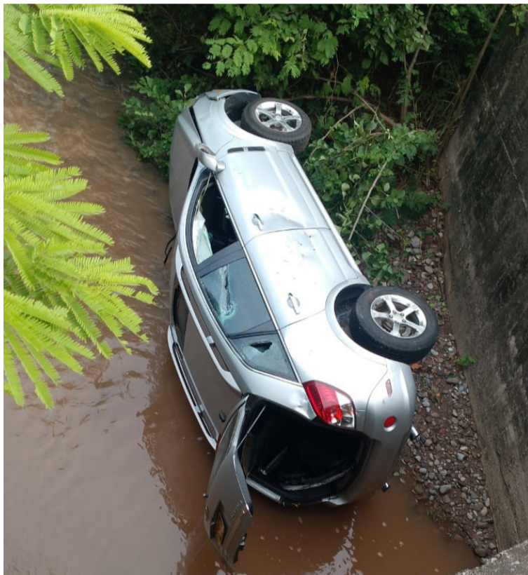
Camioneta accidentada en el lecho del río Molino. No se hallaron personas en su interior.

Las autoridades andan buscando al responsable del hecho en hospitales de los municipios vecinos con el propósito de conocer lo que realmente ocurrió.