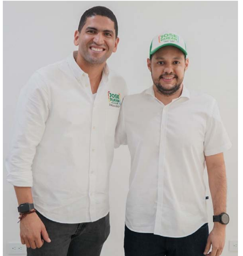
El proyecto político de José Durán, día a día crece y se fortalece de la mano de personas que tienen vocación de servicio.

y se fortalece de la mano de personas que tienen vocación de servicio, compromiso y amor por el Distrito; importantes características que garantizan el progreso de la capital guajira.