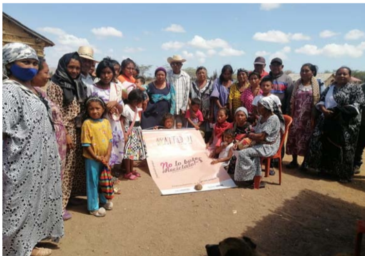
Miembros de la comunidad Waimpiralein invitando a reciclar y donar las bolsas plásticas.