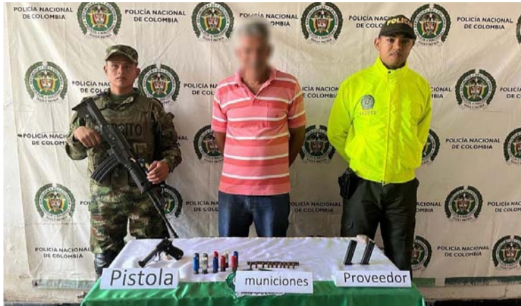
Hombre capturado por la Policía en San Juan del Cesar por porte ilegal de arma de fuego y municiones.

El procedimiento se realizó en el barrio Villa Leonor, donde mediante orden de allanamiento y registro, materializaron la captura de un ciudadano de 58 años, a quien le encontra-