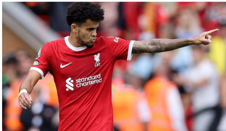
‘Lucho’ se ha ganado el cariño de la afición, que, adaptaron la letra de una canción para reconocerle su labor.

“Su nombre es ‘Lucho’, vino de Oporto, vino a marcar, vino a marcar, vino a anotar, anotar, anotar”, comienza diciendo el tema musical traducido al español.