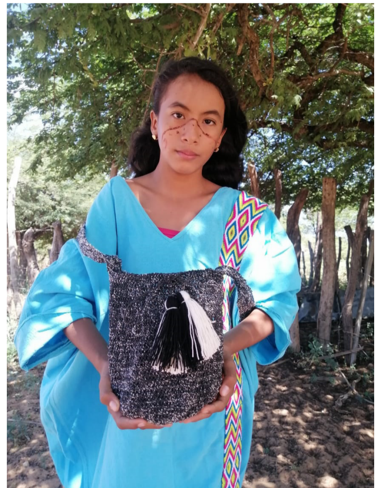
Ecomochilas Kattoui procesadas con bolsas plásticas y hebra de hilo.