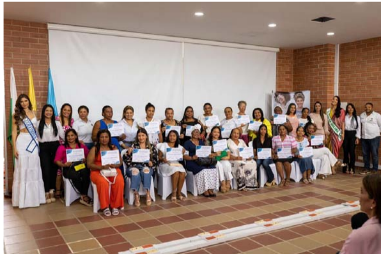
En la ceremonia se resaltó el esfuerzo y la dedicación de estas mujeres por capacitarse y fortalecerse como emprendedoras.

Durante la ceremonia se resaltó el esfuerzo y la dedicación de estas mujeres que han optado por capacitarse y fortalecer sus habilidades emprendedoras. El curso abarcó una variedad de temas relacionados con la gestión empresarial y mer-