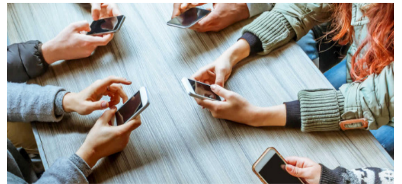
‘Generación TIC’ ofrece cursos online y offline, pensado para personas que no tengan acceso permanente a internet.

Los interesados podrán revisar la oferta de cursos, elegir las temáticas y hacer su preinscripción desde cualquier parte del país, in-