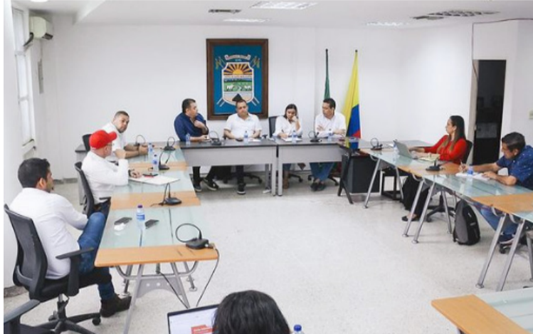
En las instalaciones del Concejo municipal de Hatonuevo se socializaron de los avances en el tema del agua.

es hacer pedagogía en el municipio sobre el uso racional del agua, conexiones fraudulentas, uso indebido del agua; partiendo de que el Gobierno nacional