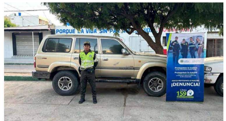
La camioneta fue puesta a disposición de la Dirección de Impuestos y Aduanas Nacionales, Dian.