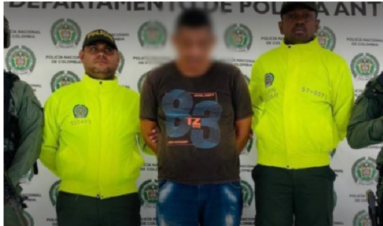
Además de ser señalado de asesinar a policías y militares, era pieza importante en el tema de tráfico de estupefacientes.

El registro de las autoridades precisa que 'El