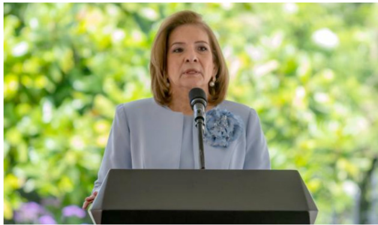
En concepto de la Procuradora es "inadmisible la pretensión del Jefe de Estado de instrumentalizar la crisis en La Guajira".

En concepto del Ministerio Público, es "inadmisible la pretensión del presidente de la República de instrumentalizar la crisis que enfrenta La Guajira para obtener facultades legislativas excepcionales por medio de la declaración de un Estado de Emergencia,