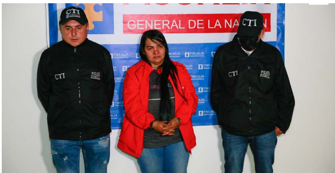
Según las pruebas, la mujer persuadió a la menor para que se quedara con ella.

El proceso avanza de acuerdo con los parámetros de la Ley 600 de 2000 (anterior Sistema Penal). La captura se realizó con fines de indagatoria y, en los próximos días será resuelta la situación jurídica de la investigada.