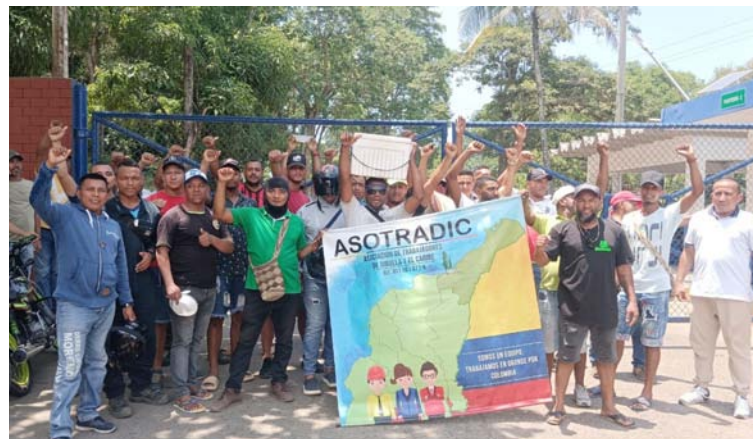
Habitantes de Mingueo mantienen su protesta en la entrada de la empresa Gecelca.

Desde el lunes los más de 50 agremiados a la Asociación de Trabajadores de Dibulla y El Caribe (Asotradic), iniciaron esta protesta que el día martes se sumaron sectores sociales, comerciantes y comunidad en general con el fin de hacer valer los derechos como personas aptas para trabajar dentro de las acciones que ejecuta dicha empresa en La Guajira.