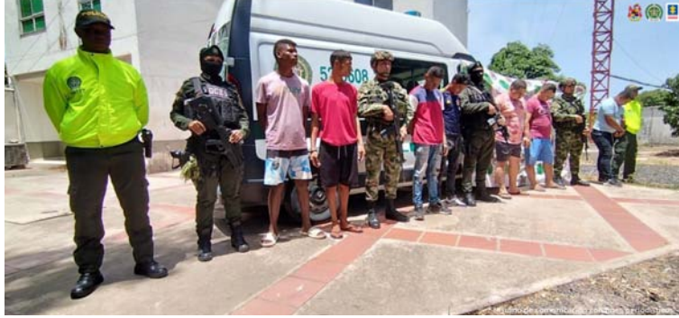
Las capturas de los procesados estuvo a cargo de agentes de Sijin, el pasado 15 de agosto, en Villanueva y Fonseca.