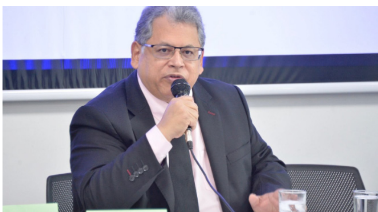
El Superintendente dicta 19 instrucciones que deben ser acatadas por las entidades territoriales.

En cuanto a las Instituciones Prestadoras de Servicios de Salud, se impartieron 14 instrucciones, relacionadas con el disponer con el talento humano en salud.