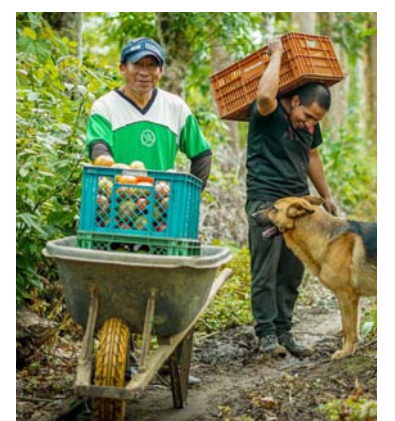
La propuesta del gobierno es reactivar el sector agrícola.

Al respecto, el presidente de la ADR manifestó: “Por primera vez el Gobierno del Cambio dispone de recursos importantes para el desarrollo del campo, y con esto aspiramos a aumentar la producción y generar condiciones dignas para el trabajador agrario.