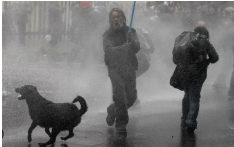
La Ley buscó limitar la posibilidad de uso de animales en contextos de afectaciones al orden público.

Esta ley fue construida de la mano del concejal ani-