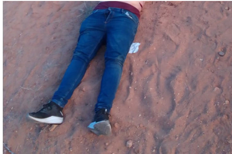
El hallazgo del cuerpo ocurrió la tarde del pasado lunes, pero solo hasta el martes lo recogieron las autoridades.

El hallazgo ocurrió la tarde del pasado lunes, pero hasta las 11 de la mañana de este martes autoridades competentes llegaron hasta la zona, donde se encontraba el cuerpo, localizado en las cercanías de la comu-