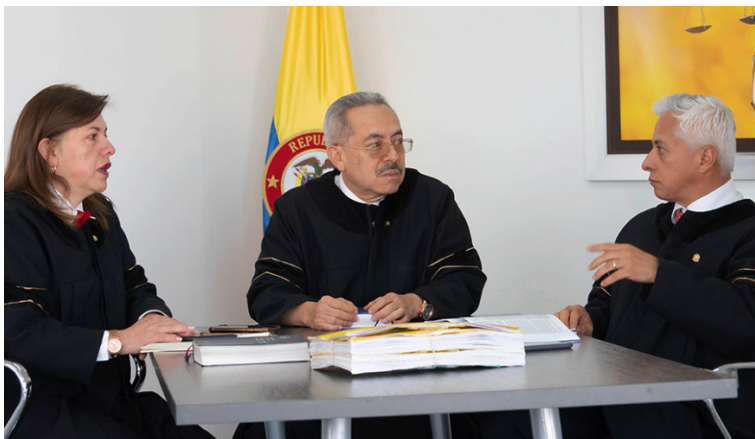
La Corte condenó a Cesar Rodrigo Canoso Guerrero a una pena de 4 años y 6 meses en primera instancia.

La Sala Especial de Primera Instancia de la Corte Suprema de Justicia condenó al exgobernador del Cesar Rodrigo Canoso Guerrero a una pena de 4 años y 6 meses, por el delito contrato sin cumplimiento de requisitos legales. También fue condenado a una inhabilitación para el ejercicio de derechos y funciones públicas por un lapso de 66 meses, 21 días; y al pago de una multa de $46.076.288 pesos.