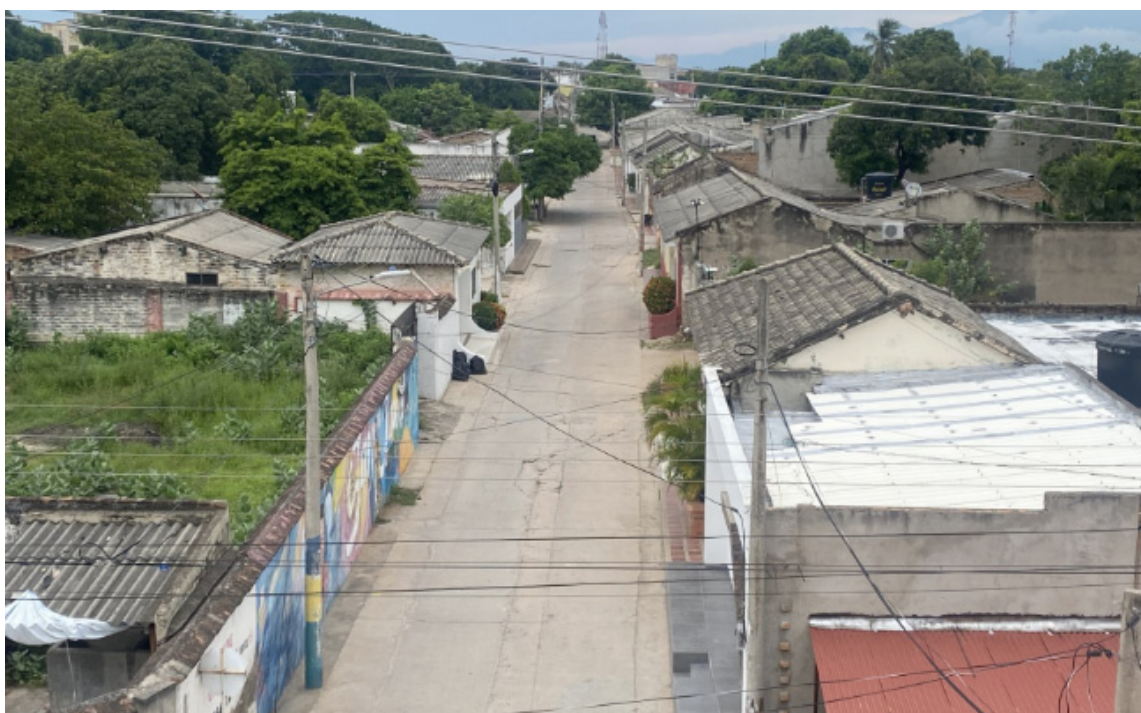
San Juan del Cesar posee 10 corregimientos, 15 centros poblados, y 19 veredas.

digital de los gobiernos en línea con aplicativos y plataformas publicando todas las gestiones en la web, es un gran avance. Organizar un banco de programas y proyectos a través del suifp territorial y el suifp regalías es otro avance significativo, pero heredar un portafolio de proyectos formulados, estructurados y viabilizados es mucho más impor-