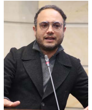
Alfredo Deluque, senador de la República.

Deluque enfatizó que “por esta razón necesitamos crear herramientas para combatir este fenómeno, porque pese a que La Guajira es el departamento más afectado, los casos de desnutrición aguda se están presentando incluso en ciudades como Bogotá, donde familias enteras solo consumen una comida al día. En el entendido en que todos conocemos este proyecto y que se han incluido los aportes, proposiciones y mejoras de los compañeros de comisión, invito a mis colegas a votar positivamente