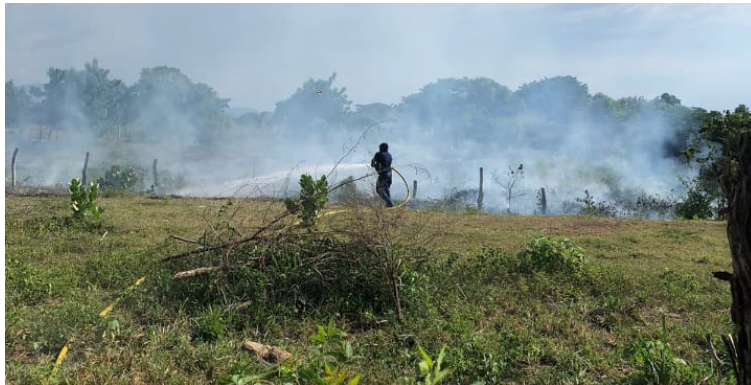
El Cuerpo de Bombero voluntarios de Urumita llegó hasta el sitio y controló el incendio con una máquina cisterna.

Habitantes del barrio San Benito del municipio de La Jagua del Pilar alertaron a los miembros del Cuerpo de Bomberos de Urumita para que hicieran presencia el pasado martes alrededor del sector para que trataran de sofocar un incendio forestal que consumió unos 200 metros cuadrados de pasto, donde el fuego avanzaba de manera rápida hasta llegar a los predios de las fincas cercanas al barrio.