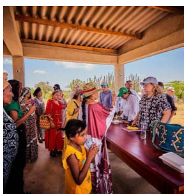
Icbf garantizará los derechos de la niñez wayuú.

Con el paso al segundo debate de esta importante apuesta por combatir el hambre en el territorio nacional, se espera siga su curso con éxito y cuente con el respaldo no solo de congresistas, sino también de los ciudadanos, organizaciones y opinión pública en general.