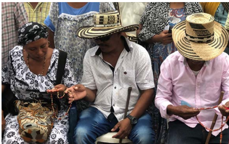
Miembros del clan Epieyu, quienes suscribieron un primer acuerdo con el clan Apshana.