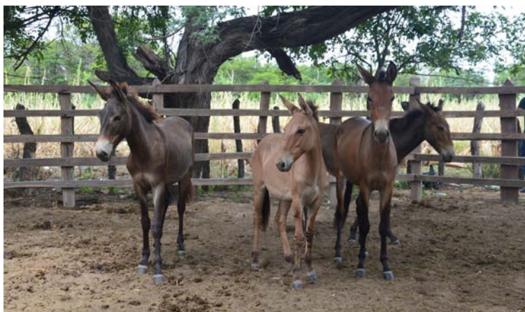
Las mulas fueron entregadas del clan Apshana al clan Epieyu.

de la Policía Nacional. Hace mes y medio nuevamente atentaron contra su vida.