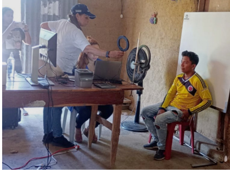
Las siguientes jornadas se realizarán del 28 agosto al 1 de septiembre, en la escuela etnoeducativa de Manalen, en Uribia.