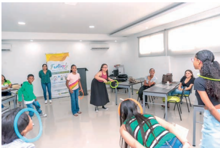
Cootracerrejón promueve la realización de actividades.