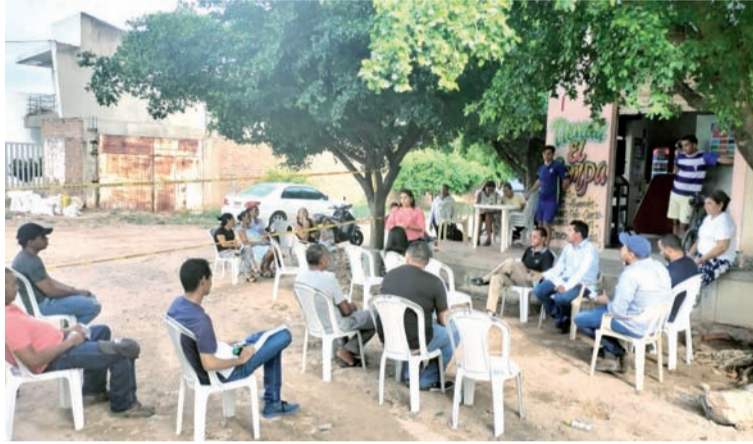
Los sectores a intervenir comprenden un trayecto de 625 metros lineales con una inversión de más de $ 1.000 millones.

Los sectores a intervenir, comprenden un tra-