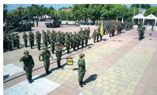
Aspecto del juramento de bandera realizado por el segundo contingente 2023 del Grupo Rondón y Batallón Santa Bárbara.