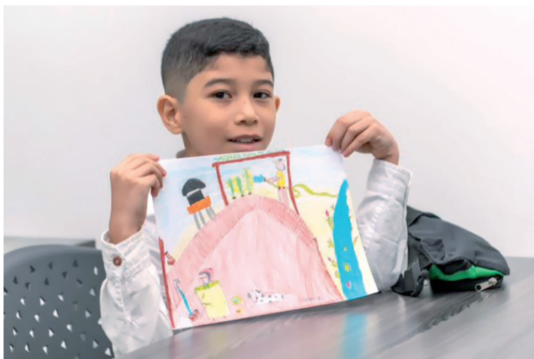
Se busca que los niños exploten sus habilidades.