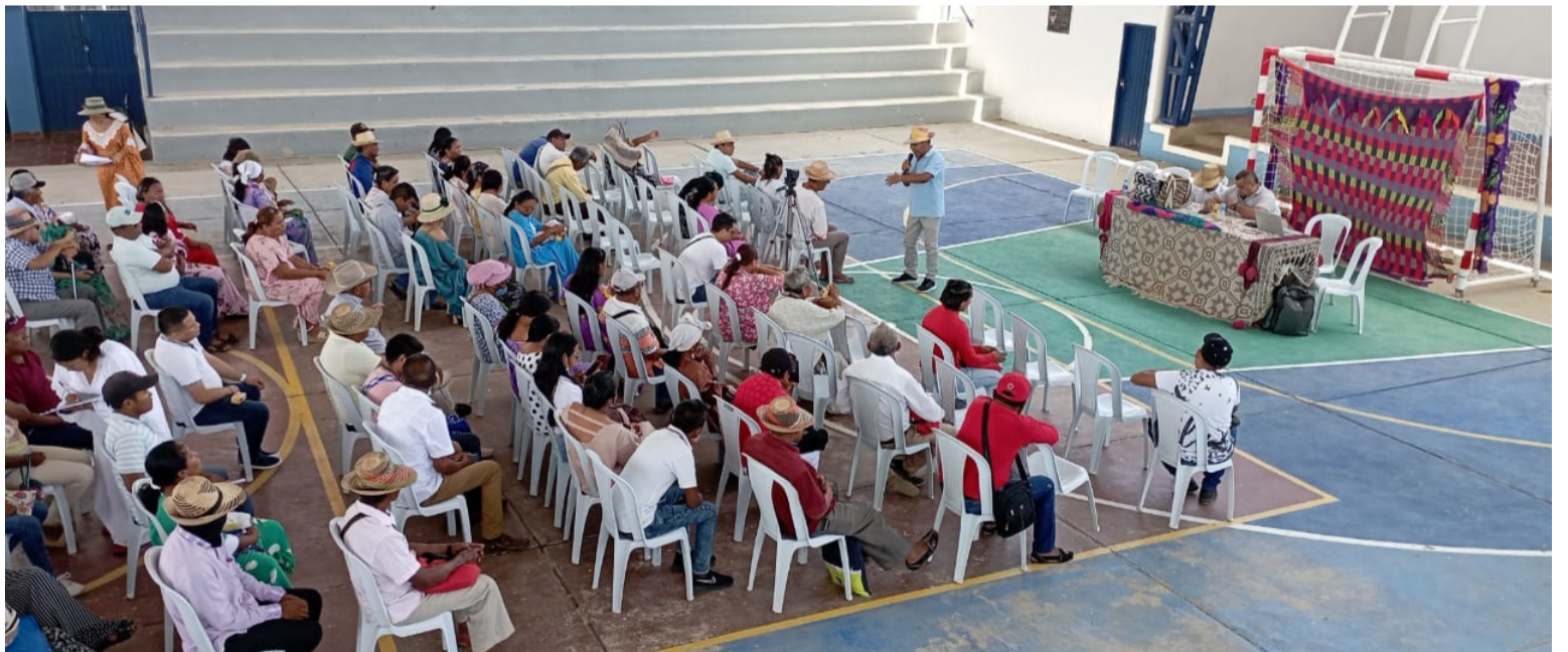
El pueblo wayuú rechaza ser atendido en una red pública de salud no indígena, propuesta por el Estado.

El pueblo wayuú rechaza acogerse al sistema de salud propuesto por el Estado, “el Gobierno del presidente Gustavo Petro nos obliga a que seamos atendidos en una red pública de salud no indígena de La Guajira carcomida por la corrupción e invita a volver al pasado, en donde se nos atendía por caridad”, aseguró Jesual-