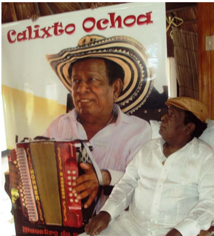
La primera canción 'Mi color moreno', fue grabada por el propio Calixto Ochoa el 13 de junio de 1972.

dad yo la quería. Y si digo que la quiero también miento, porque ya la aborrecí. La trataba con decencia y me salía con grosería. Y yo no he dao los motivos para que