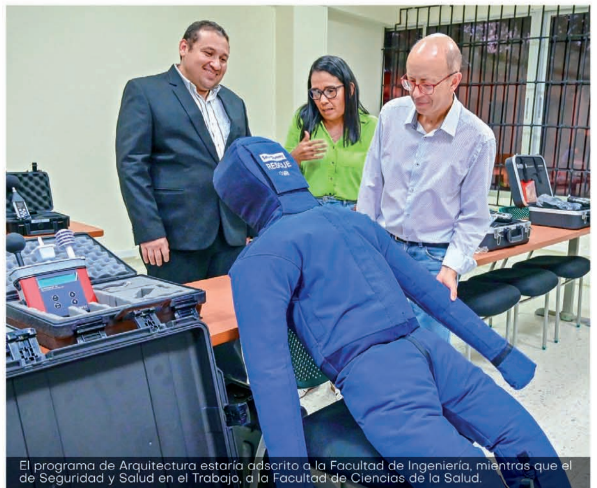
El programa de Arquitectura estaría adscrito a la Facultad de Ingeniería, mientras que el de Seguridad y Salud en el Trabajo, a la Facultad de Ciencias de la Salud.

de La Guajira completa la verificación de condiciones de calidad de cinco nuevos programas que busca incluir en su oferta académica: Agroecología, Arquitectura y Seguridad y Salud en el Trabajo en el nivel profesional; la Tecnología en Energías Renovables y el Doctorado en Innovación, con los cuales espera contribuir al desarrollo sostenible de la región.