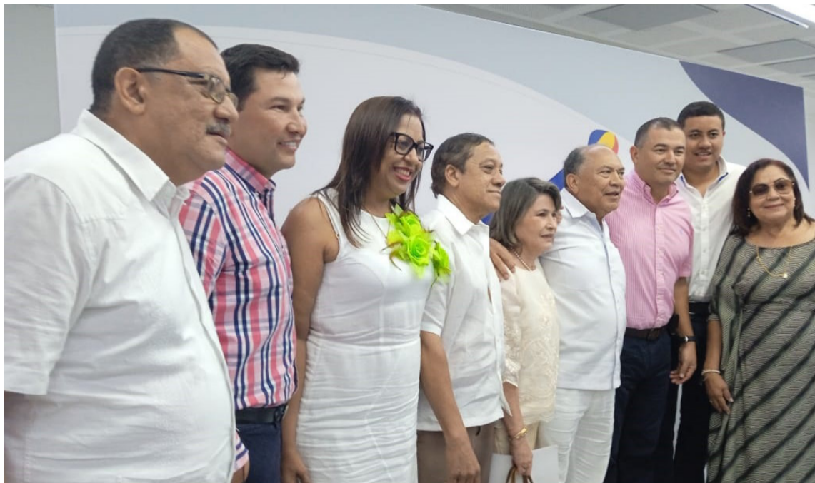
Desde la RAP Caribe planean el desarrollo regional y ejecutan proyectos con la Nación.

La Fase II recoge en un diagnóstico la Dimensión Económica- Productiva (Sector Agropecuario, Comercio Exterior, Dinámica Turística, Mercado laboral, Informalidad, Competitividad. A continuación, La Dimensión Sociocultural, (Población, Pobreza y Desigualdad, Trabajo Infantil, Educación, Salud, Vivienda y Servicios Públicos, Seguridad Alimentaria, Identidad cultural). Enseguida, la Dimensión de Infraestructura (Infraestructura de Conectividad, Ciencia, Tecnología e Innovación). En cuarto lugar,