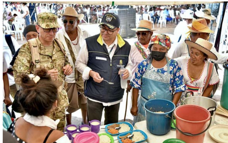
Hacen parte de las canastas populares: frutas, verduras, carnes, cereales, tubérculos, plátanos, leche y aceite, entre otros.

"Para el Gobierno Nacional es eje fundamental miti-