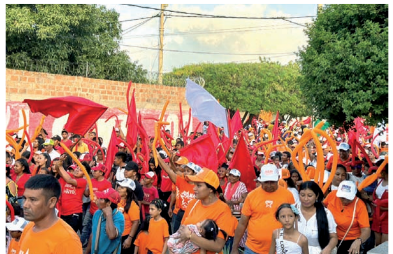
Diferentes líderes caminaron con orgullo en el evento central.