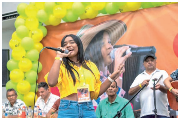
El talento fluye con el Concurso del Cantante Vallenato.