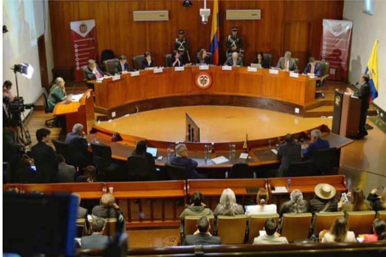
Samuel Lanao socializó los trabajos adelantados por la entidad en materia de protección y acceso al recurso hídrico.

En este sentido se refirió a las acciones de conservación de la oferta hídrica