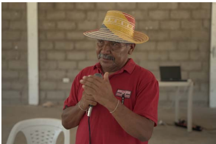
Advierten que el decreto de emergencia está mal establecido, puesto que no cobija a todo el Departamento.