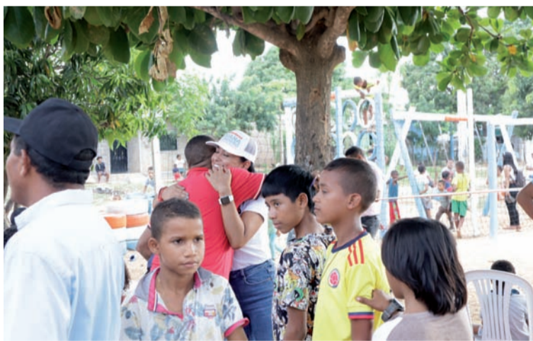
El parque es solo el primer paso de su visión para Riohacha.