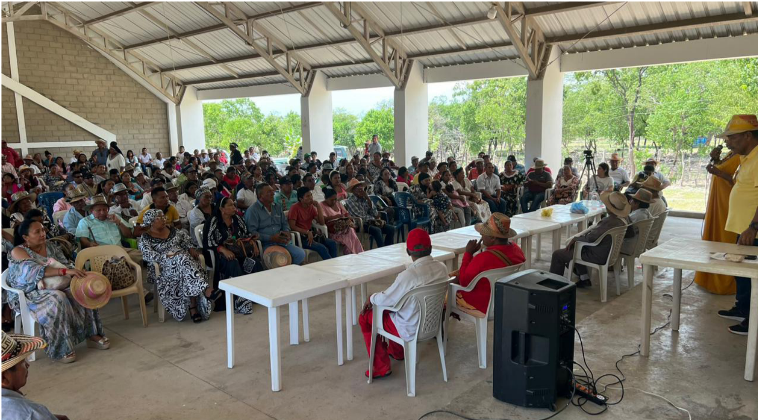
Más de 1.200 autoridades tradicionales, reiteraron sus fuertes reparos a la reforma a la salud que pretende el Gobierno.

Cuestionan la declaratoria de Emergencia Económica y Social