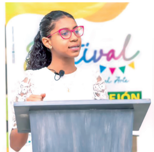
Se explora la capacidad oral y reflexiva de niños y jóvenes.