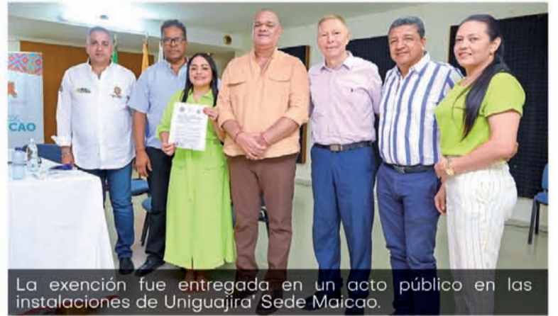
La exención fue entregada en un acto público en las instalaciones de Uniguajira Sede Maicao.

ayudar a que este claustro siga entregando profesionales íntegros al servicio de la sociedad maicaera y poder comunidad”.