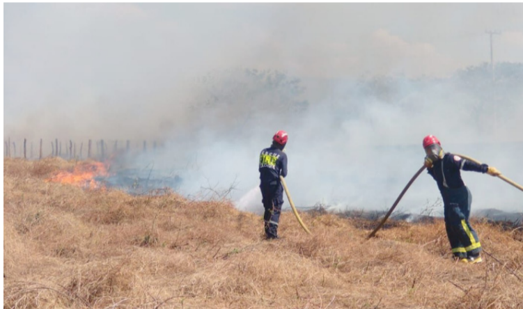
Existe riesgo inminente de incendios forestales debido a las altas temperaturas que siguen azotando La Guajira.

Sin embargo, los monitoreos realizados por el Ideam este fin de semana y las predicciones sobre fenómenos