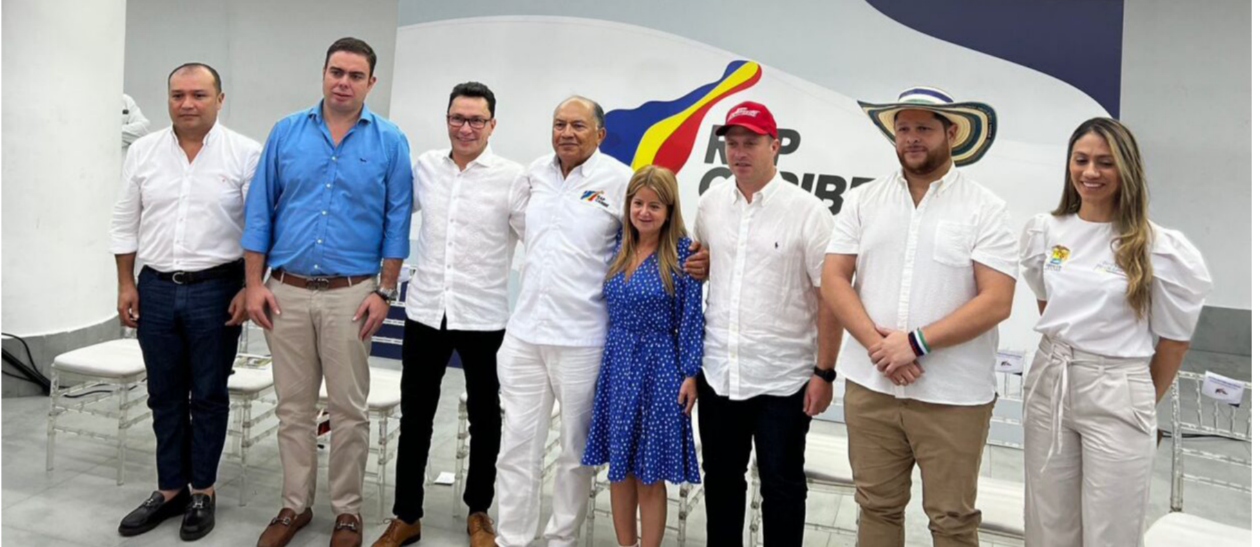
El documento contiene una presentación, introducción, marco conceptual y normatividad que soportan la institucionalidad de la RAP Caribe.