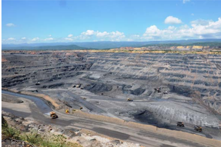
Cerrejón llama la atención sobre "omisiones preocupantes en el informe, que tienen un impacto directo en su credibilidad".

"Por último, quisiéramos expresar nuestra preocupación por las fuentes citadas en el informe y el contenido de este. Consideramos que la información contenida en