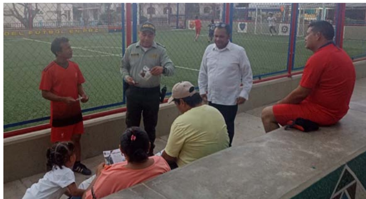
Se busca promover las tradiciones para generar sentido de pertenencia y respeto por el patrimonio natural y cultural.

Se realizó en el parque El Boscán, ubicado entre las calles 6 y 7; y entre carreras 13 y 14, barrio Boscán, cuadrante 6, la cual fue dirigida a turistas, visitantes y ciu-