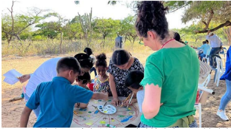
La comunidad wayuú de Manaure habló de la necesidad de transmitirle conocimientos propios a las nuevas generaciones.

En el encuentro de construcción realizado en la comunidad de Mapuishon, que contó con la participa-