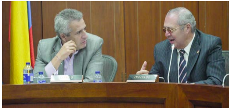
El ministro Luis Fernando Velasco anunció que realizará una serie de encuentros con los distintos políticos.

Ministro del Interior hizo un llamado a los sectores económicos del país, a los vendedores informales, a los sectores sociales, a las