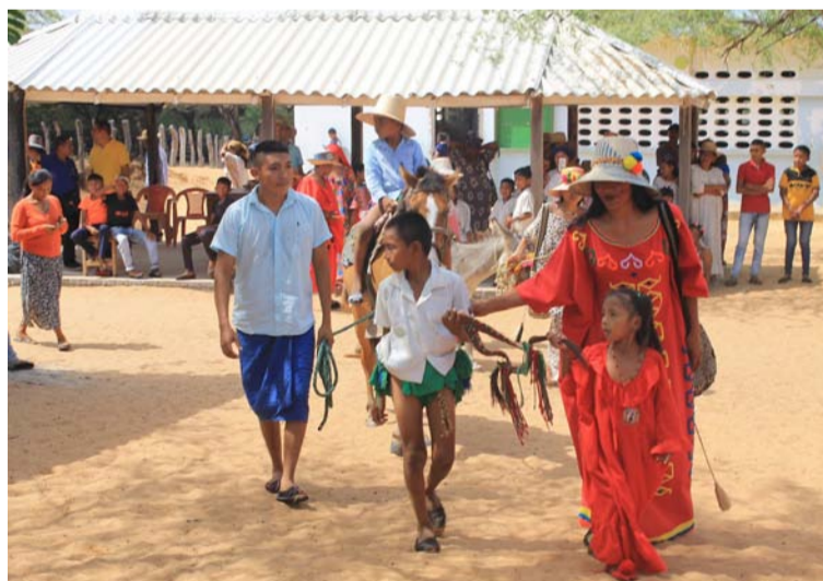
Se dieron actividades donde los protagonistas son los docentes que trabajan en zonas rurales y con comunidades étnicas.

los jóvenes Indígenas en la toma de decisiones, a la vez que reconoce sus dedicados esfuerzos en la acción climática, la búsqueda de justicia para sus pueblos, y la creación de una conexión intergeneracional que mantenga vivas su cultura, sus tradiciones y sus contribuciones, advierte las Naciones Unidas.