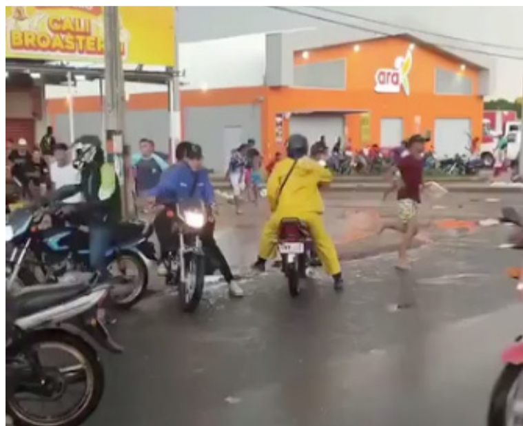
Los habitantes y transeúntes quedaron atónitos ante la barbarie que estos jóvenes protagonizaron en vía pública.