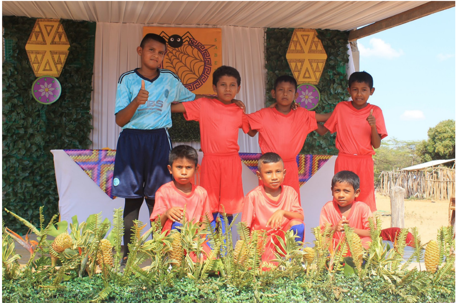
El evento contó con diversos concursos de habilidades, actividades cotidianas y destrezas wayuú en las categorías infantiles.

Este Día Internacional de los Pueblos Indígenas 2023, que lleva el título de "Juventud Indígena, agente de cambio hacia la autodeterminación", reivindica la posición que deben ocupar