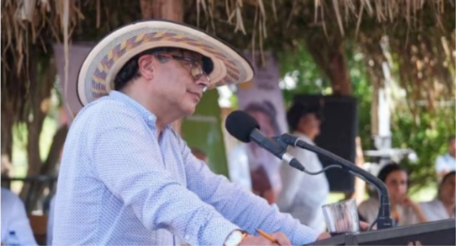
Expertos han cuestionado el decreto 1085, pues consideran que existen otras vías para atender las urgentes necesidades.