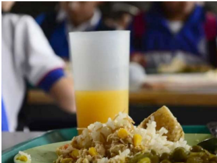
Los exfuncionarios habrían incrementado el presupuesto del contrato para cubrir gastos de publicidad.

Al parecer los exfuncionarios habrían incrementado el presupuesto del contrato en $460 millones para cubrir gastos de publicidad, visibilidad y socialización, costos que no están contemplados ni permitidos en la regulación legal del PAE, con lo que aparentemente