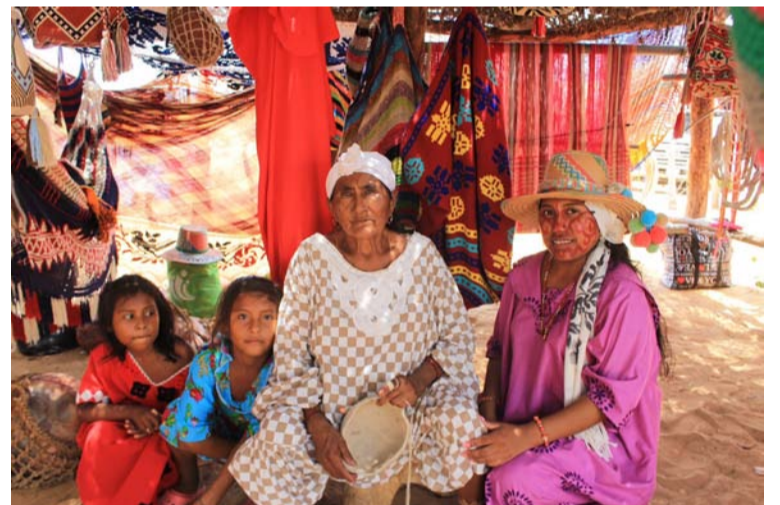
Los pueblos indígenas practican culturas y formas únicas de relacionarse con la gente y el medio ambiente.