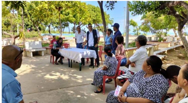
La convocatoria estuvo a cargo de la Personería distrital, a través de comunicación oficial y previa antelación.

Puntualizó que se invitó a toda la institucionalidad para que le dieran cara a la ciudadanía, y escucharan de su voz todos los problemas que aquejan a ese sector de la ciudad.