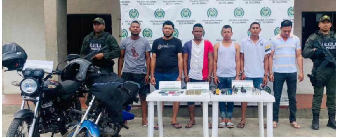
La presunta estructura criminal está integrada por colombianos y venezolanos.

Asimismo, la fuente informó que dentro de las investigaciones adelantadas por la Fiscalía, dan cuenta de que los capturados presuntamente estaban a car-