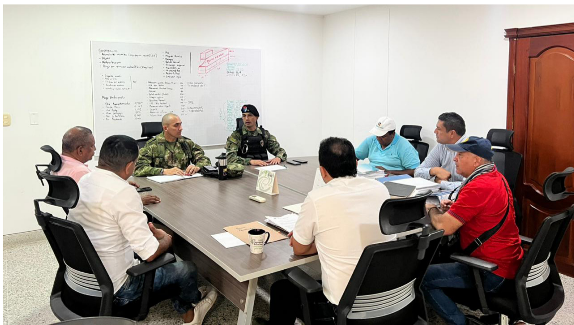
Los amenazados deben abandonar el pueblo en 24 horas sino serán declarados objetivo militar.

Desde este medio nos solidarizamos con nuestros compañeros que en este momento son objeto de amenazas y se espera que las autoridades puedan esclarecer la situación y verificar la veracidad y la existencia, tanto del panfleto como la del grupo que se adjudica las amenazas.