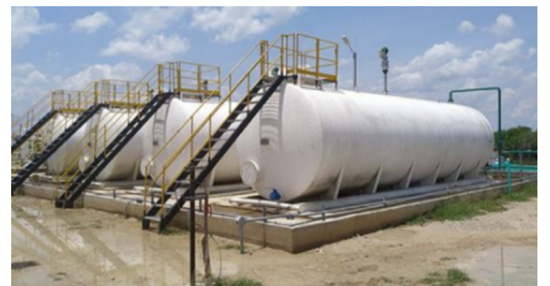
El espacio será uno de varios que se realizarán durante el seguimiento ambiental del proyecto, el 15 de agosto.