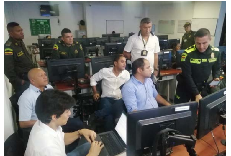
El sistema de operatividad de 119 cámaras de seguridad blindarán el accionar de la fuerza pública en el Distrito.