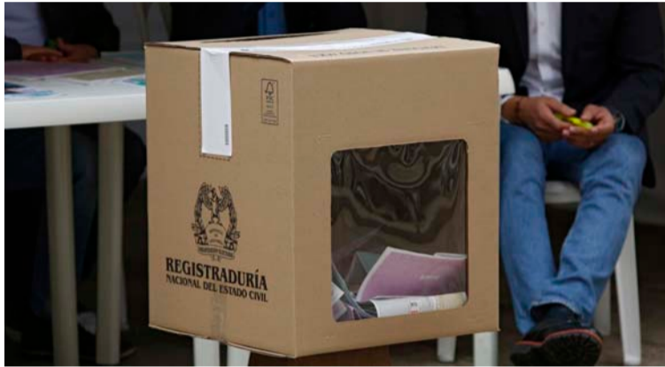
Los mandatarios locales deben disponer de equipos de oficina, útiles, y mesas de votación para la jornada electoral.

En desarrollo de una acción preventiva, la Procuraduría Regional de Instrucción de La Guajira señaló que es necesario que los mandatarios locales dispongan de los inmuebles que se requieran, así como de equipos de oficina, útiles y mesas de votación para la jornada electoral.