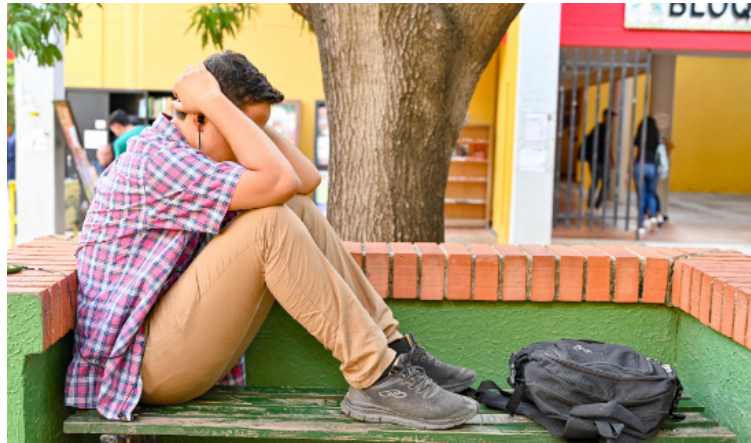
La Universidad de La Guajira avanza en el desarrollo de acciones en beneficio del bienestar emocional.

“Desde la academia se trabaja con muchos programas y proyectos que buscan prevenir situaciones que afecten el desenvolvimiento estudiantil y contribuyan