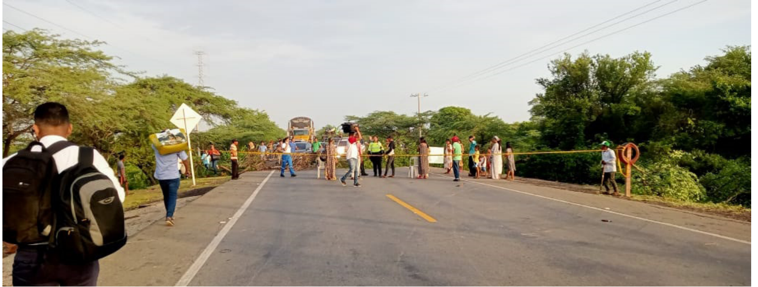
Promediando las 4 de la tarde de ayer, el secretario de Gobierno de Manaure logró el despeje de la carretera.

El secretario de gobierno de Manaure, señaló que luego de un intenso diálogo se restableció el paso vehicular por esta vía en la Troncal del Caribe, con el fin de darle paso a los avances del proyecto que se lleva a cabo por parte de la Administración Municipal y empresa Milenials S.A.S que presta este servicio a la comunidad por lo que buscarán conocer ante la empresa cuál fue el real motivo de