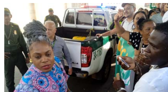
La ministra de Educación, Aurora Vergara, fue la encargada de recibir a los maestros provisionales el pliego de peticiones.

Por su parte, el Instituto Nacional de Vías (Invías) firmará convenios para la construcción de caminos comunitarios para la paz.