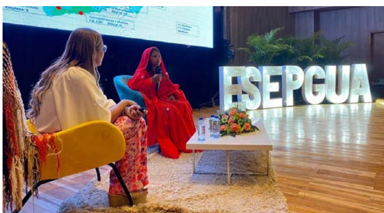
El evento contó con la ministra de Vivienda, Catalina Velasco, la gobernadora Diala Wilches y los 15 alcaldes de La Guajira.