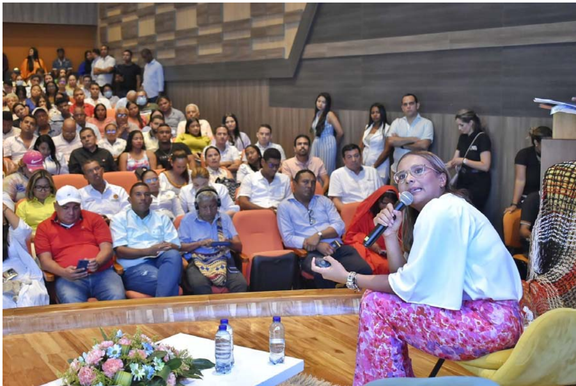
Esepgua está enfocada en mejorar condiciones de vida de la población guajira, dice la gerente.