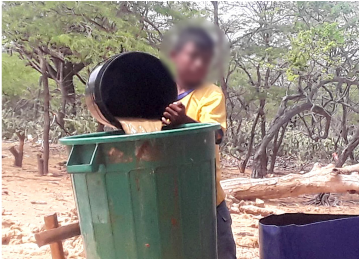
Con agua se enseñaría a los indígenas a realizar huertas caseras y cultivos de pancoger.

En la escuela, alguna vez escuché hablar a mi profesor de sociales decir que si en el desierto del Sahara hubiera agua se podría cultivar, porque no existían tierras malas, sino tierras faltas de agua. Bajo el anterior concepto, me atrevo a comparar y afirmar que si en la Media y Alta Guajira hubiera acceso al agua, otra cosa sería, desaparecerían las campañas de alimentos y de agua que solo duran unos días en agotarse ¿y