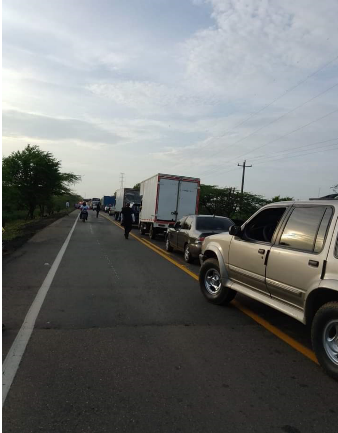
La empresa Enel solo pudo ejecutar el 40% de su programación, el 60% fueron bloqueos.

Claudia Bejarano fue enfática al decir que el medio ambiente ha sido muy importante para Cerrejón. El 93 por ciento del agua de uso industrial viene de las escorrentías de los pit. Agua de uso industrial que se usa para el control del polvo, agua que no es del río Ranchería, como lo manifiestan algunos medios de comunicación, y polvo que muchas veces llega por los aerosoles del desierto del Sahara. Igualmente, se pro-