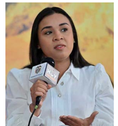
Diala Wilches Cortina, gobernadora de La Guajira.

“En jornada previa con el Ministerio de Educación, por ejemplo, estamos consolidamos varios temas”, se-