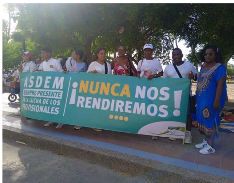
Docentes y miembros de la comunidad Suman Wayuú se presentaron en las instalaciones de la Gobernación.

En definitiva, la salud mental es un tema que requiere atención especial y acción conjunta entre la sociedad, profesionales de la salud, instituciones, gobierno y por supuesto de las familias, quienes desempeñan un papel activo en el cuidado y prevención de estas afecciones.