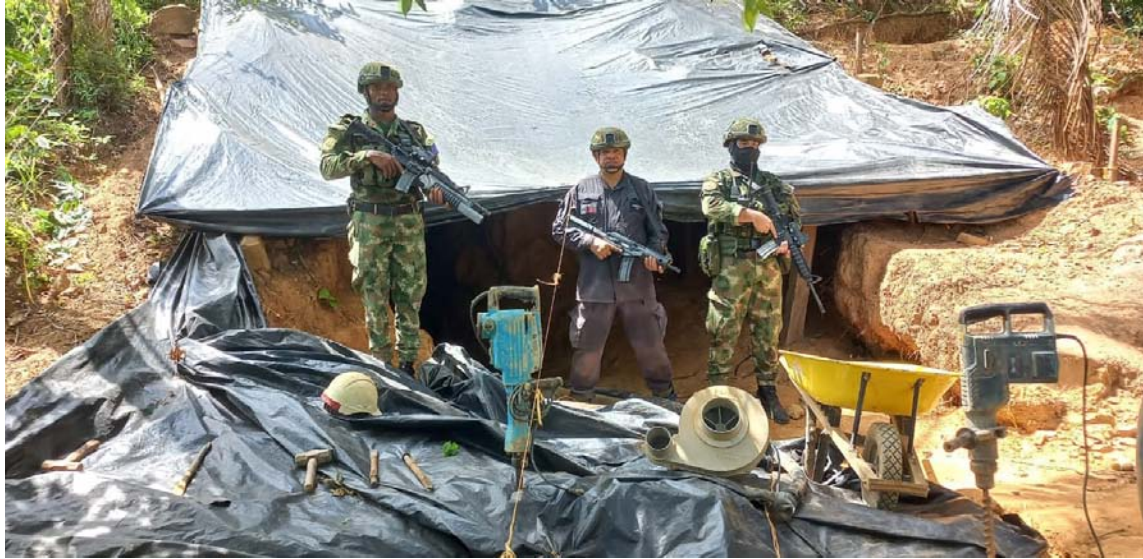
Unidades del Ejército intervinieron cinco unidades productoras mineras, tipo socavón.

De igual forma, se hallaron 2 taladros, un extractor