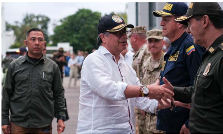
El presidente Gustavo Petro saluda a las autoridades de Policía, Armada y Ejército a su llegada este lunes a Riohacha.