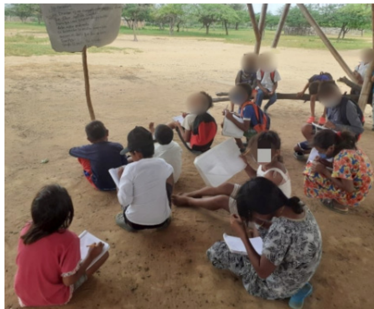
Se habla del PAE para las instituciones etnoeducativas, pero en realidad no a todas les llega este complemento.

“A todo esto se le agrega, que no todas las Instituciones acogen a los niños de otras rancherías de la mejor manera, pues en algunas existe la preferencia a favor de los que son pertenecientes de la comunidad donde se encuentran las