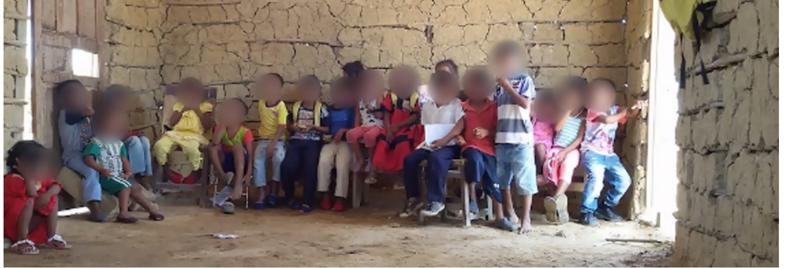
Es el momento del cambio, para que el Departamento tenga una nueva perspectiva frente a los retos educativos.

Es una cadena de eventos desafortunados que perpetúa la pobreza, la discriminación y la desesperanza en una región que lo único que tiene seguro sobre sus cabezas es el inclemente sol que azota sin piedad sus pasos por el de-