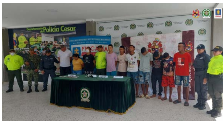
Los 10 procesados fueron capturados por servidores del CTI, en coordinación con agentes de la Sipol y la Sijín.