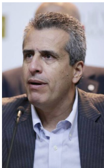
Luis Fernando Velasco, ministro del Interior.

en territorio. Estamos convencidos de que un gobierno que se haga desde las regiones y con la gente, trae consigo nuevas oportunidades para la población en temas de participación ciudadana, adaptación de las políticas a las necesidades locales y, sobre todo, en el fomento del desarrollo equitativo", señaló el ministro del Interior,