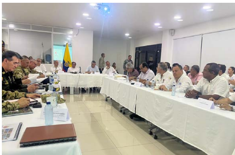
El Gobierno del presidente Gustavo Petro, en pleno, se tomó desde ayer lunes el departamento de La Guajira.