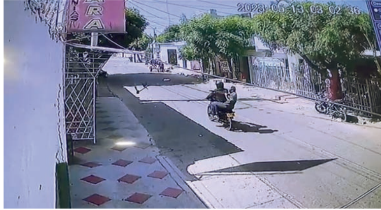
El ataque se registró en la calle 18, con carrera 16 del barrio San Martín del municipio de Maicao.

hubo lesionados, pero están alarmados ante estos hechos de amedrentamiento en contra de los líderes sociales y políticos en la ciudad fronteriza”, manifiesta-