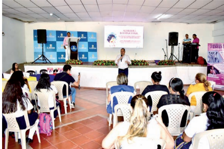
Ambas estrategias buscan desafiar los roles de género tradicionales y promover una mayor igualdad de oportunidades.

El objetivo general del proyecto se centra en fortalecer el empoderamiento femenino y las nuevas masculinidades en la comunidad, como estrategia generadora de habilidades de vida.