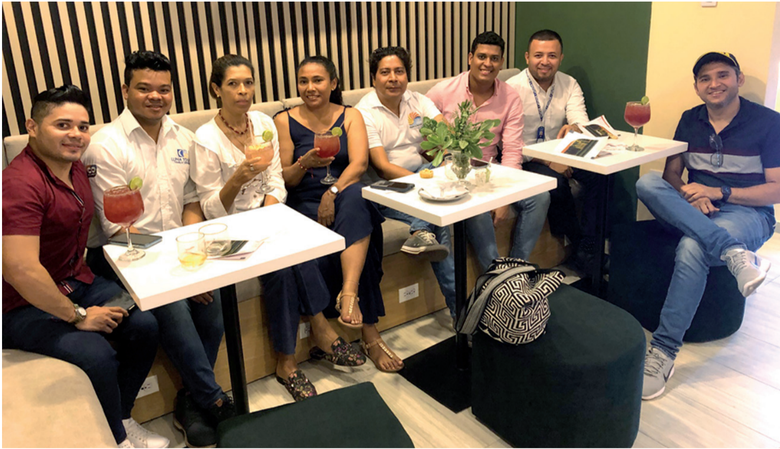
Los emprendedores le están apostando al sector del turismo como una alternativa para generar empleo.

Le apuestan a la preservación del medio ambiente