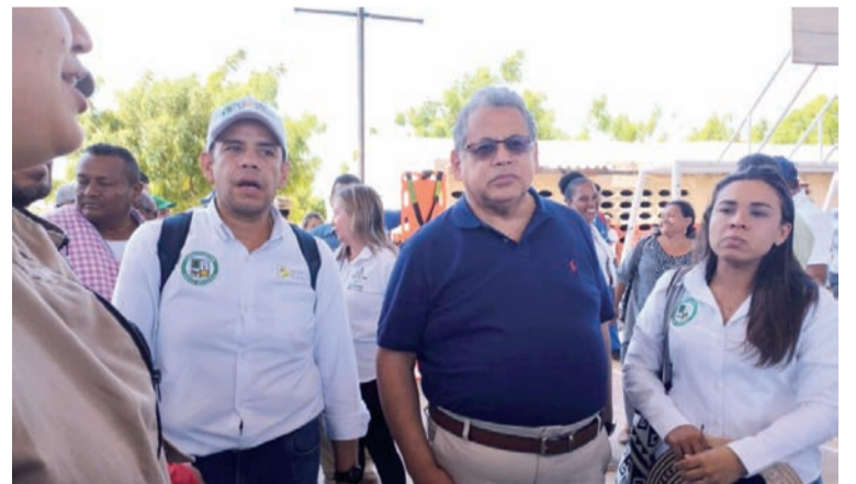
Icbf anunció su compromiso de trabajar en diversas áreas para superar las condiciones inconstitucionales en el Departamento.

Solicitan que se presente al Mintransporte una Ley de Saneamiento