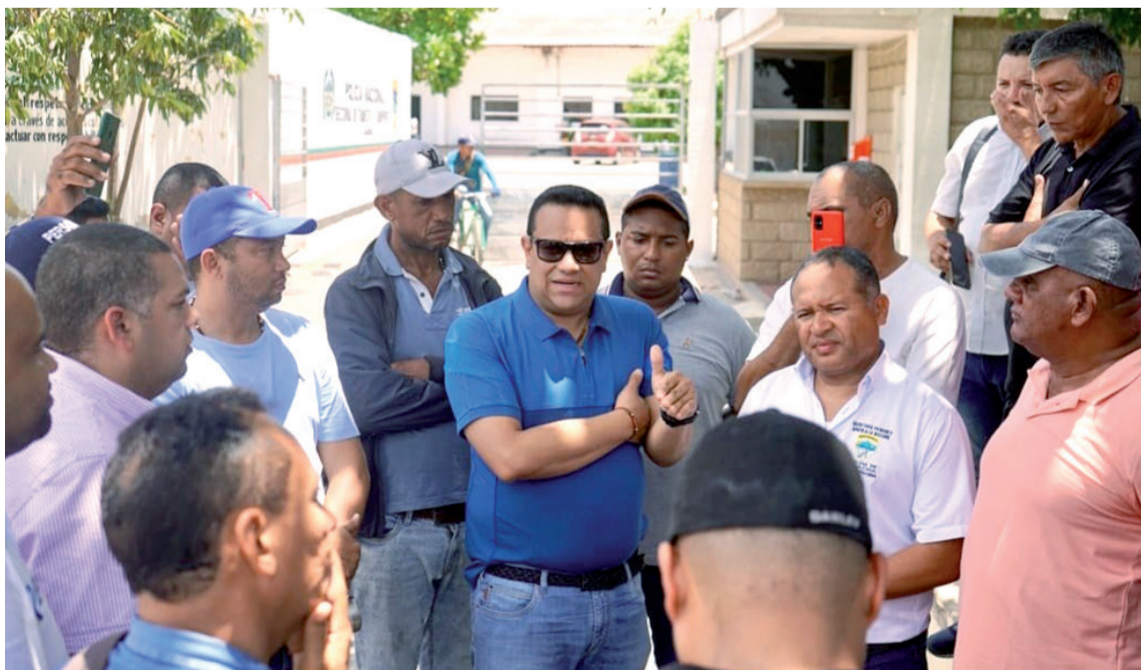
Con el acuerdo se logró que los 10 vehículos inmovilizados sean devueltos a sus dueños.