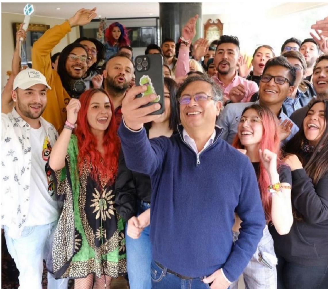
Es momento de que Petro apropie los recursos prometidos que la causa amerita.

haga por la paz más que la firma de 10 acuerdos de paz juntos”.