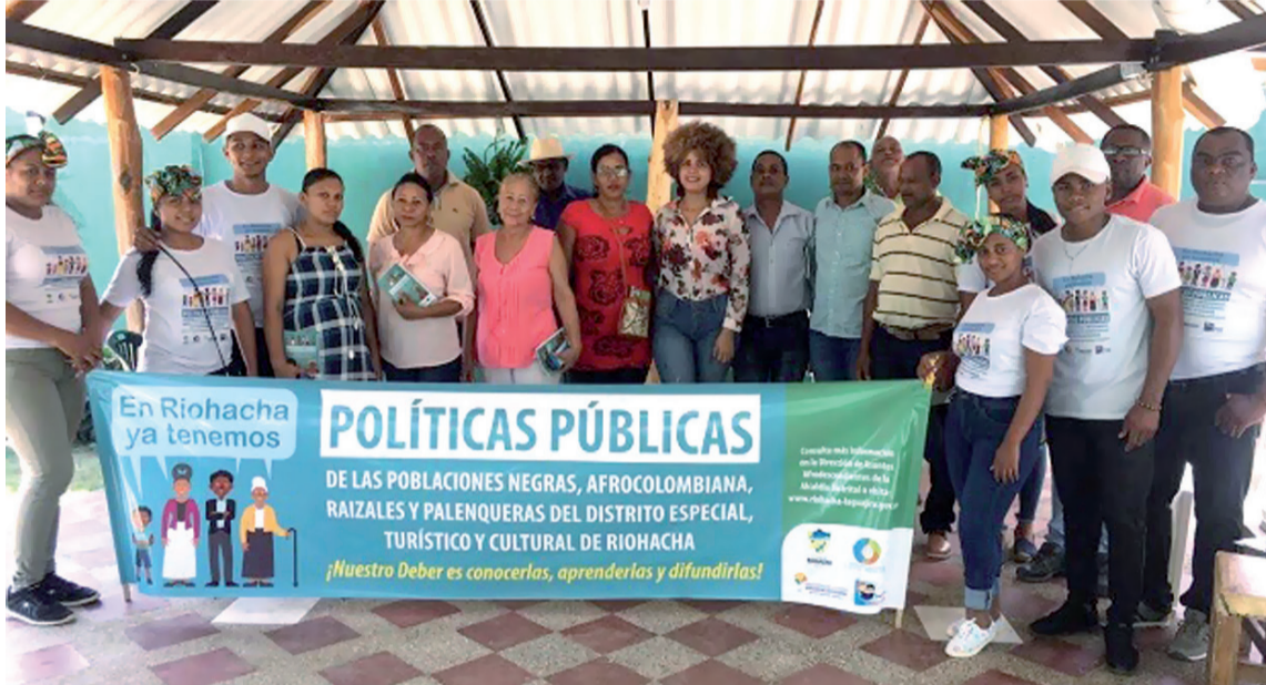
La conmemoración tendrá una nutrida agenda y será liderada por Dirección de Poblaciones.

llamado a exaltar las narrativas de resistencias de las comunidades negras, afrocolombianas, raizales y palenqueras. Esta conmemoración es una invitación a resignificar y repensarnos el país en clave de interculturalidad, desde el reconocimiento de la historia y las realidades diversas del pueblo afro de Colombia, en cada uno de sus territorios, y una invitación a generar sinergias que contribuyan a eliminar de ma-