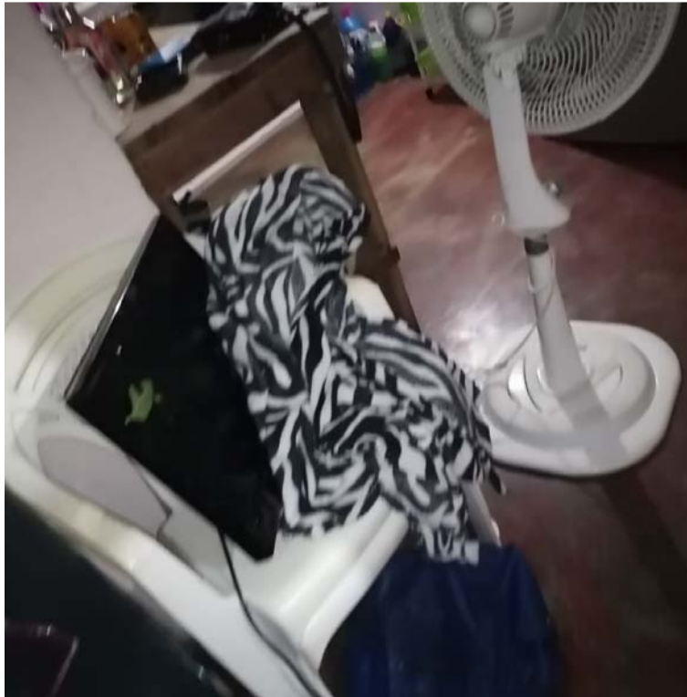
El pasado sábado, en horas de la noche, ladrones rodaron las tejas de una casa, ingresaron y robaron absolutamente todo.

Señala uno de los denunciantes, que Buenavista se destaca por ser siempre un pueblo sano y que debe existir unión entre la comunidad para no permitir este tipo de actos delincuenciales, ya sea cometido por propios o foráneos.