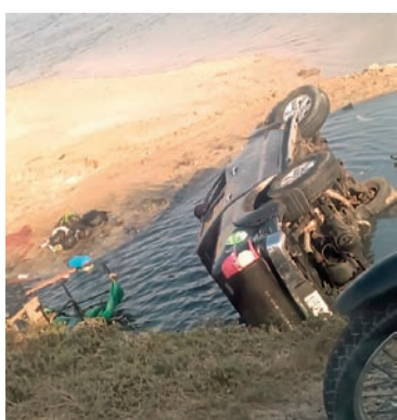
El accidente ocurrió en el sector de ‘Puente Rojo’.

Hasta el lugar llegaron las autoridades competentes quienes procedieron a verificar lo sucedido para determinar las causas que originaron el volcamiento del vehículo.