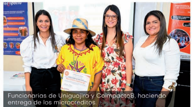
Funcionarias de Uniguajira y CoimpactoB, haciendo entrega de los microcreditos.

colaboración con diferentes entidades logran impulsar cambios significativos y positivos en las comunidades vulnerables. Se espera que este tipo de proyectos se implemente en todo el mundo, para enfrentar los desafíos globales de manera conjunta y efectiva.