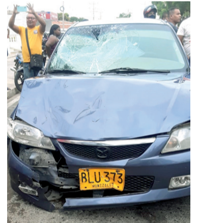
De acuerdo al reporte médico, el conductor de la motocicleta, al parecer iba en estado de alicoramiento.