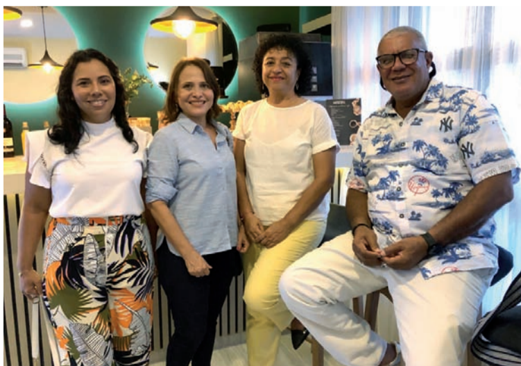
Los empresarios ofrecen a los clientes un espacio de calidad, calidez y armonía en sus visitas y paseos por La Guajira.