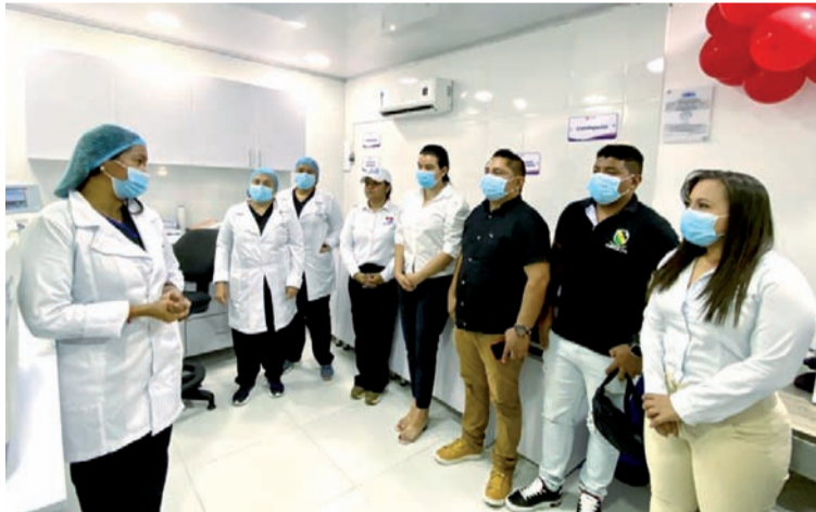
La automatización para el análisis de pruebas es uno de los grandes avances que se ha logrado en el laboratorio.

La automatización para el análisis de pruebas es uno de los grandes avances que se ha logrado en el laboratorio. "Se cuenta con una banda que permite agilidad en el procesa-