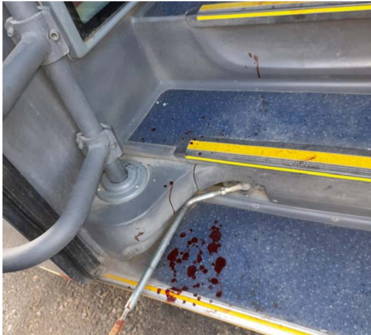
Uno de los presuntos atracadores quedó muerto en el bus mientras el otro huyó del lugar, al parecer malherido.

Uno de los presuntos atracadores quedó muerto en el autobús mientras el otro huyó del lugar, al parecer malherido, producto de los disparos que le dio su