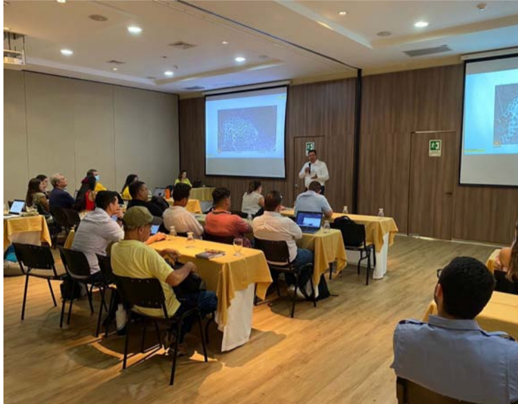
Los participantes compartieron experiencia del ciclo de monitoreo, prioridades en la región y gestión de datos e información.

“Hoy estamos reunidos en este esfuerzo para unir autoridades ambientales, centros de investigación y empresas con un único motivo: fortalecer el conocimiento de la biodiversidad del Caribe Colombiano y principalmente de La Guajira. Los esfuerzos de monitoreo y de conservación que se han venido llevando a cabo por años, lo que están generando hoy es una masa crítica de conocimiento que