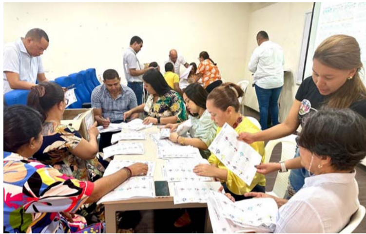
Los facilitadores de la Registraduría le explicaron a los presentes sobre los diferentes roles del proceso electoral.

Cabe indicar, que el E-14 es uno de los documentos