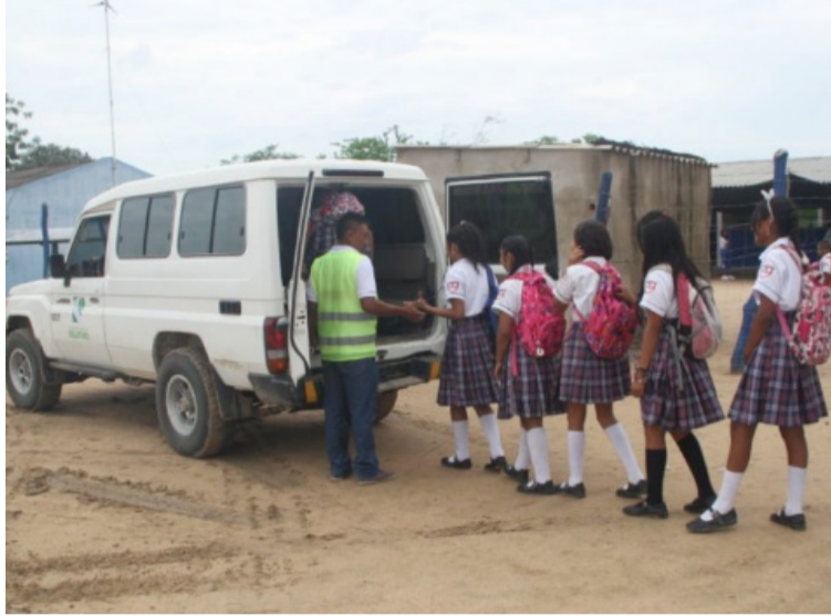
El ente de control solicitó información sobre el número de estudiantes que a la fecha reciben efectivamente el servicio.

La Procuraduría Regional de Instrucción de La Guajira indaga las razones por las cuales el servicio solo se brinda de manera parcial, a pesar de que el calendario escolar se inició hace tres meses, situación que afecta a los niños que viven en áreas rurales que