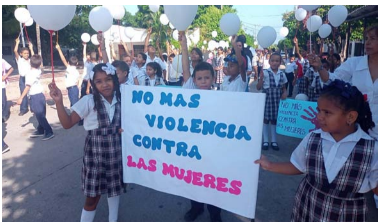
La protesta se dio en rechazo a la acción cometida por un joven que violó a una adolescente de 16 años.

Finalmente, el director dio a conocer que Corpoguajira ha llevado a cabo acciones de adaptación al cambio climático ante el desabastecimiento hídrico, rehabilitando 11 sistemas de extracción de agua subterránea operados por aerobombas en comunidades indígenas de Maicao, e implementando sistemas de abastecimiento de agua a través de 3 pozos profundos y energía solar en comunidades indígenas de Manaure. Igualmente se realizó el mantenimiento de 25 sistemas de extracción de agua subterránea (molinos de viento) en comunidades indígenas.