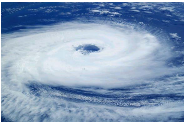
Hay una especial atención en el departamento de La Guajira que está viviendo su temporada seca.

“Les recomendamos estar atentos a las redes de comunicación del Gobierno e iniciar la protección alrededor de sus viviendas. Para esta temporada hay una especial atención en el departamento de La Guajira que simultáneamente está viviendo su temporada seca con temperaturas altas y a la vez puede verse afectado por los ciclones, por eso hay que empezar la prevención y es el llamado a estar atentos a las comunicaciones del Ideam y del sistema de gestión del riesgo de los municipios”, concluyó la alta funcionaria.