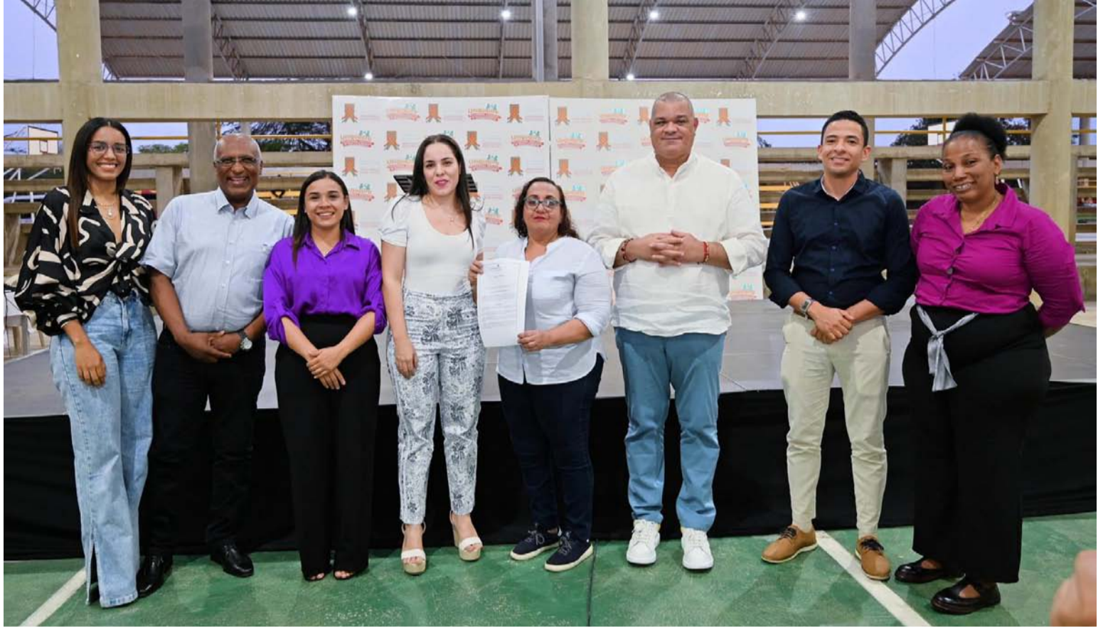
La aprobación del programa consolida uno de los principales propósitos del Plan de Desarrollo Institucional 2022-2025.