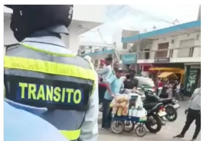
La agresión física se produjo en estado de absoluta indefensión, que le produjo tres días de incapacidad.