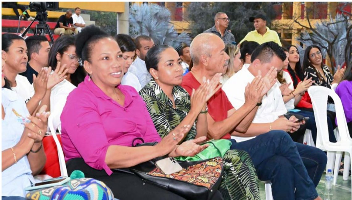
Al evento asistieron los representantes del Consejo Superior, miembros de la comunidad académica, periodistas y diferentes agremiaciones sindicales.