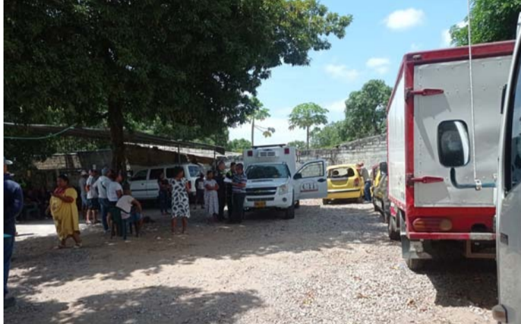
El crimen se registró a las 10 de la mañana de este viernes en la calle 20, entre carreras 8 y 9 de la ciudad de Riohacha.