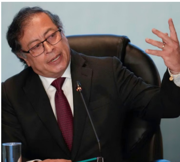
Se debe desistir del afán de sabotear, denigrar, y degradar al gobierno del presidente Gustavo Petro.

tingos con rectificaciones y perdones a las corrientes políticas, económicos, poder judicial, medios de comunicación, iglesias, poder legislativo, órganos de control, gobernadores y alcaldes; en amplias participaciones indiscriminadas para aflojar campos y garantías de resolver situaciones que nos afectan, partiendo de borrón y cuenta nueva para no tener que jugar con la candela.