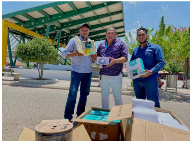
Las alarmas serán supervisadas por cada uno de los presidentes de Juntas de Acción Comunal del municipio.

El secretario del Interior y Convivencia Ciudadana del municipio manifestó su disposición de continuar trabajando de manera articulada con otras dependencias y entidades, buscando atender a las necesidades de la población que espera la mejor cooperación de las autoridades para la efectividad y contundencia al momento de la reacción cuan-