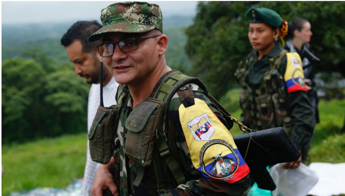
Las organizaciones al margen de la ley no deben actuar en dos orillas diferentes.

El presidente Gustavo Petro tiene la responsabilidad de evitar una guerra civil en su periodo de gobierno. Es deber del mandatario convocar sin dis-