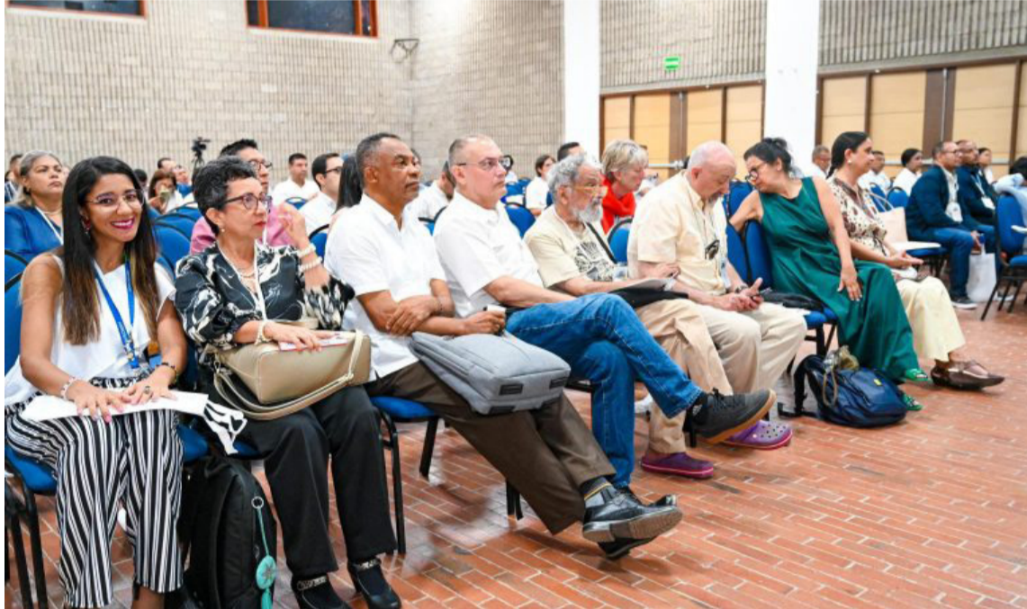
Corpoguajira expuso las acciones y estrategias para la mitigación del territorio guajiro.

Dentro de las estrategias más importantes destacó la ejecución de cuatro sistemas de monitoreo de erosión costera y medidas de adaptación basadas en ecosistemas (MAbE) en un clima cambiante, como alternativas para reducir la presión en ecosistemas de manglar y pastos marinos en los municipios de Uribia, Manaure, Dibulla y Riohacha y en los tres Distritos Regionales de Manejo Integrado (DRMI) Marino Cos-