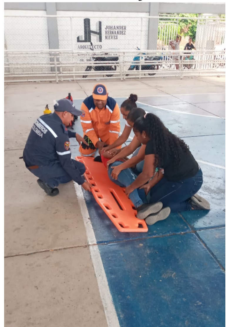
Los socorristas realizaron una capacitación sobre distintos temas, en especial para auxiliar a la comunidad.

Es la oportunidad para resaltar y exaltar este tipo de actividades al servicio de la comunidad.