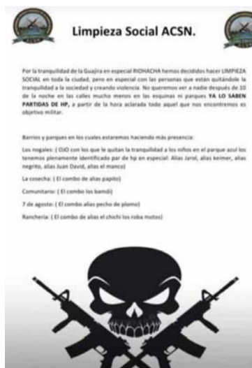
El pasquín señala algunos barrios y parques de la ciudad.

Este nuevo pasquín señala algunos barrios y parques de la ciudad donde harán sus injerencias y tomarán control como son: Los Nogales, La Cosecha, Comunitario, 7 de Agosto y Ranchería, además, de mencionar la Comuna 10 de la ciudad, esto con el fin de terminar con las personas