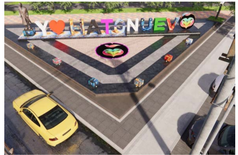
El paradero turístico 'Yo amo Hatonuevo', incluirá monumento del maestro Leandro Díaz. Mañana se pondrá primera piedra.