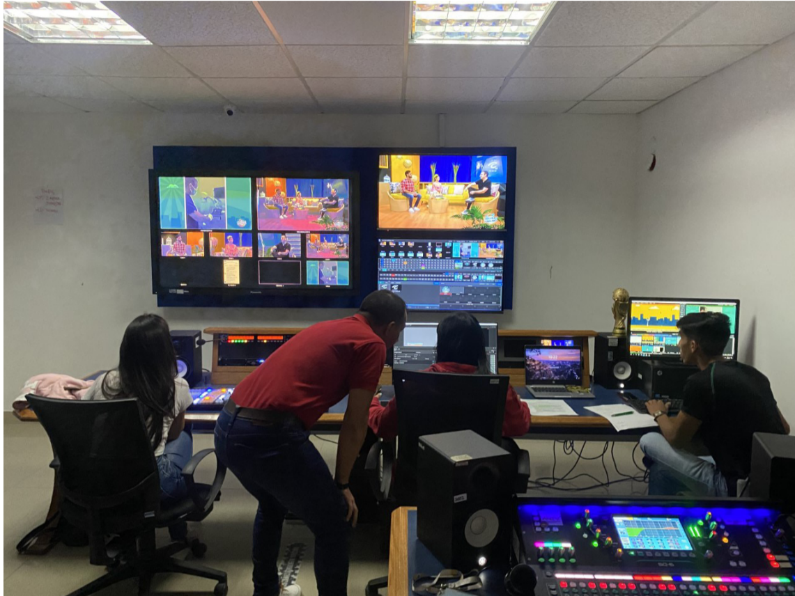
Estudios del canal regional Telecaribe con sede en la ciudad de Barranquilla.

Al hacerse público la necesidad de que la región tuviera su propio canal, la ministra convocó a todos los gobernadores de los 7 departamentos de la Costa, y a los presidentes de las cámaras de comercio de la región a una reunión urgente y así creamos la Promotora del Canal regional, Telecaribe, la cual tendría su asiento en la ciudad de Cartagena. En esta gestión,