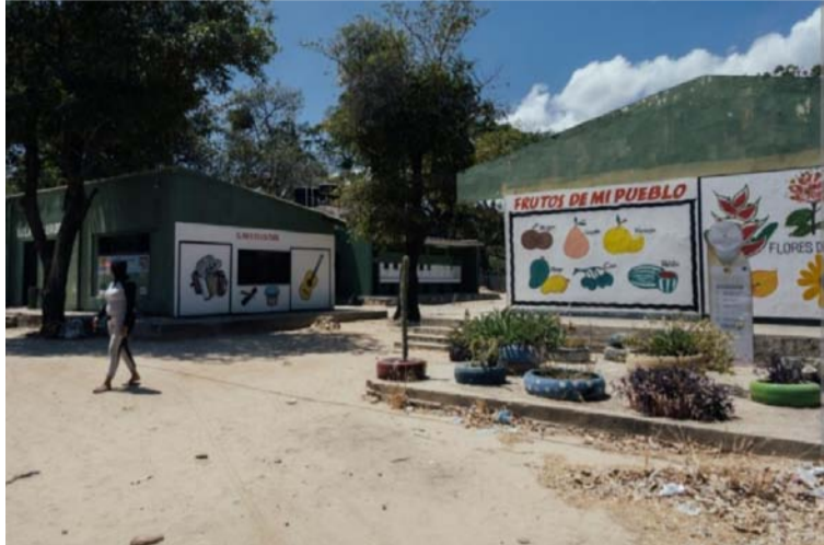
Trabajadores de la Educación hacen llamado al gobierno para que atiendan las necesidades de estas instituciones.

Estas tareas últimamente venían desarrollándolas los estudiantes y maestros de la institución, pero el 9 de mayo decidieron no seguir con esta labor y suspender la jornada académica para