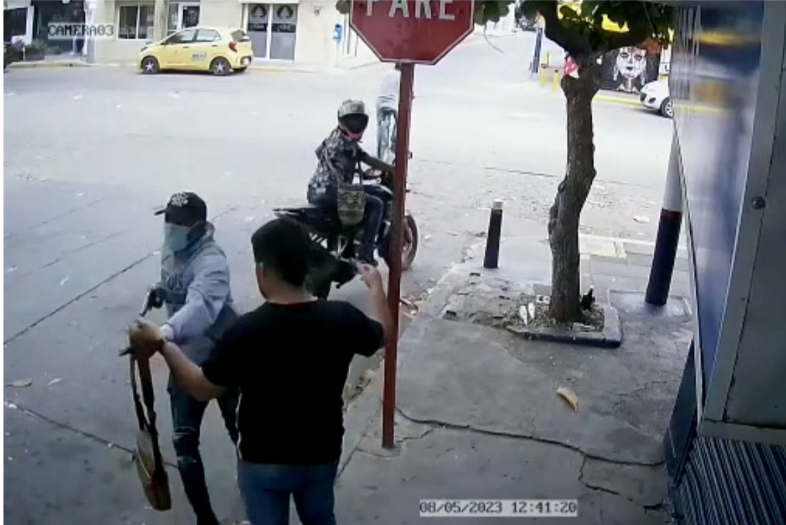
El secretario de Gobierno exigió a la Policía celeridad en las investigaciones.

El hecho se registró a la una de la tarde del pasado lunes en la calle 7, mejor conocida como la Ancha, con carrera 11, frente a un