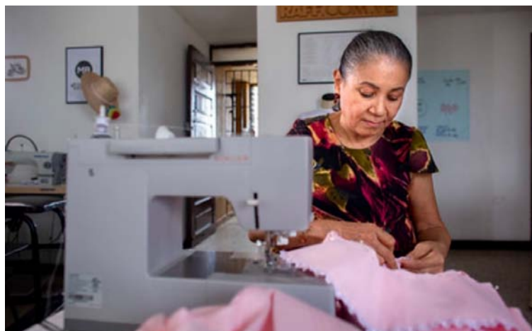
En 2022, Colombia registró 2.471.437 de venezolanos, siendo el mayor país receptor en el mundo de esta población.

rante 2022, en tanto el 58% de las personas migrantes en tránsito reportan haber sufrido algún tipo de discriminación 4.