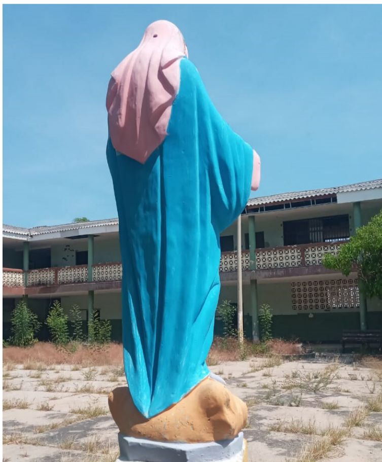
El Colegio Remedios Solano abrió sus puertas en 1965 y hoy está convertido en un monumento al abandono.