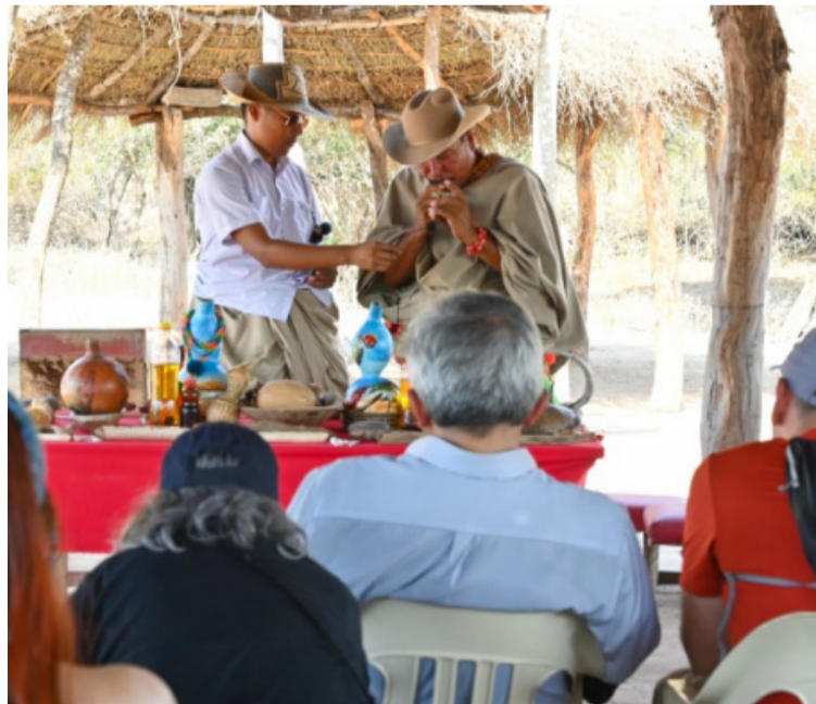
Culminó el Primer Encuentro Internacional de Pueblos, Lenguas y Culturas Arawak, liderado por la Uniguajira.

“Los cantos ayudan a curar el mundo, a que la gente viva bien, que no haya enfermedades y que el tiempo se mantenga en su ciclo