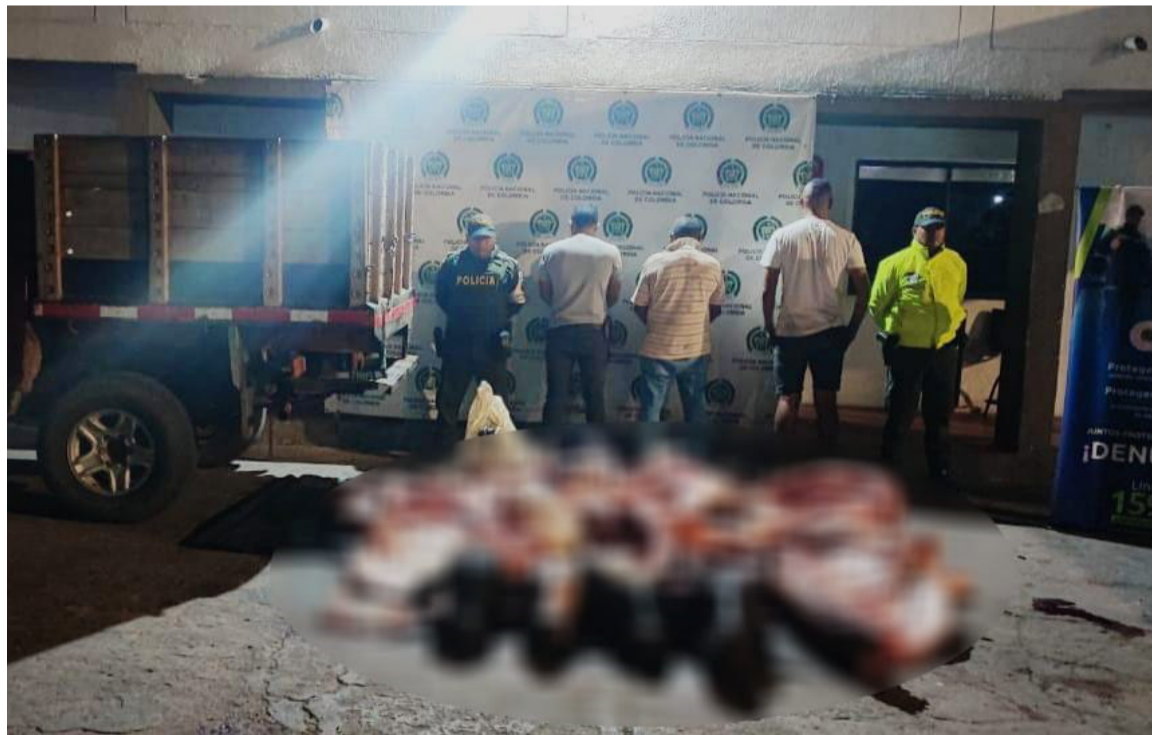
El automotor y la mercancía estarían valuados aproximadamente en 42 millones de pesos.

El automotor y la mercancía incautada estarían valuados aproximadamente en 42 millones de pesos.