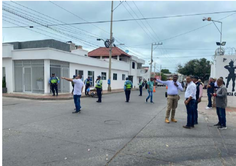
Se realizan operativos en varios puntos estratégicos del Centro de la ciudad con el fin de atacar actos delictivos.

Con plan requisa, verificación de documentos a personas y vehículos se de-