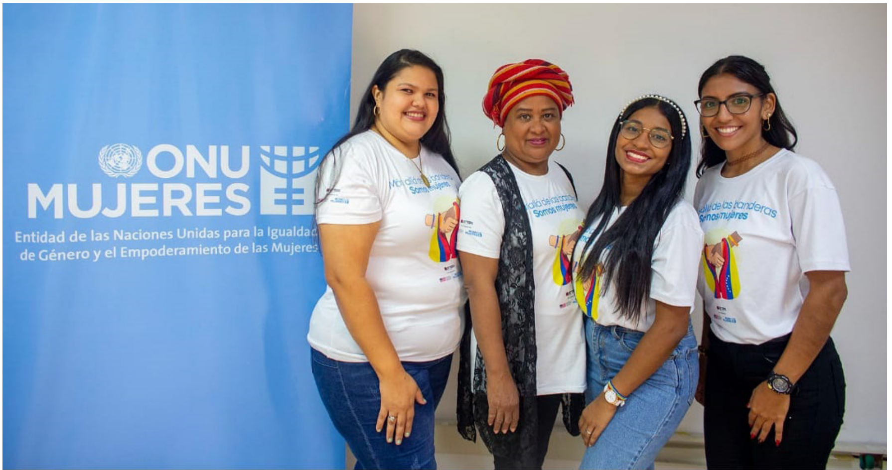
El proyecto que se creó en el año 2020, es una iniciativa de ONU Mujeres y el apoyo del Departamento de Estado de los EE.UU.