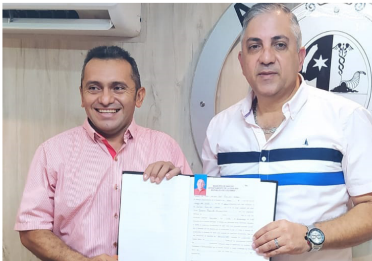
Una de las metas más importantes es posicionar a Maicao y La Guajira en la agenda nacional en materia fronteriza.

Expresó que una de las metas más importantes es posicionar a Maicao y La