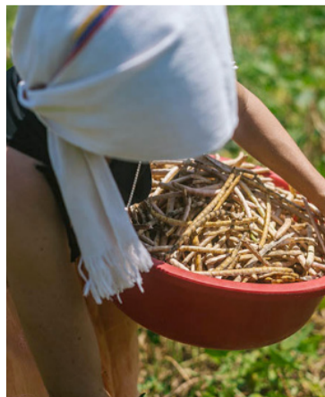
Negocios del programa serán beneficiados.

tiene el objetivo de ayudar a las mujeres que lideran negocios con capacidad de agregar valor social, ambiental y/o económico en sus regiones, a fortalecer sus habilidades y cerrar brechas productivas y/o comerciales, brindando acompañamiento técnico especializado, apoyo en la adopción de tecnología y adecuación de infraestructura, dotación y puesta en marcha de equipos, entre otros.