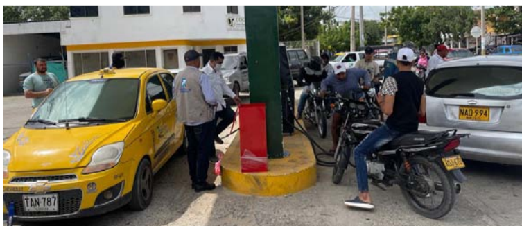
El Ministerio de Hacienda defiende estas medidas que pretenden disminuir el significativo impacto fiscal en el Gobierno.

A pesar de este aumento, el precio de venta al público de la gasolina corriente en las diferentes ciudades del país se ubicará en un promedio de $11.767 por galón, según información del Ministerio de Minas y