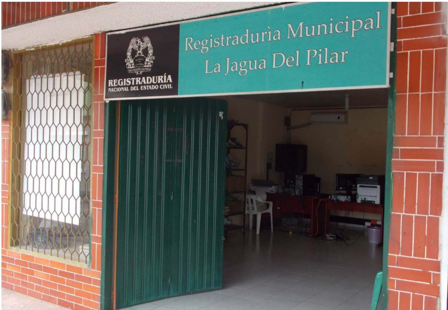
El número de votantes que entrega la Registraduría del municipio es mayor a la cifra de habitantes que entrega el Dane.