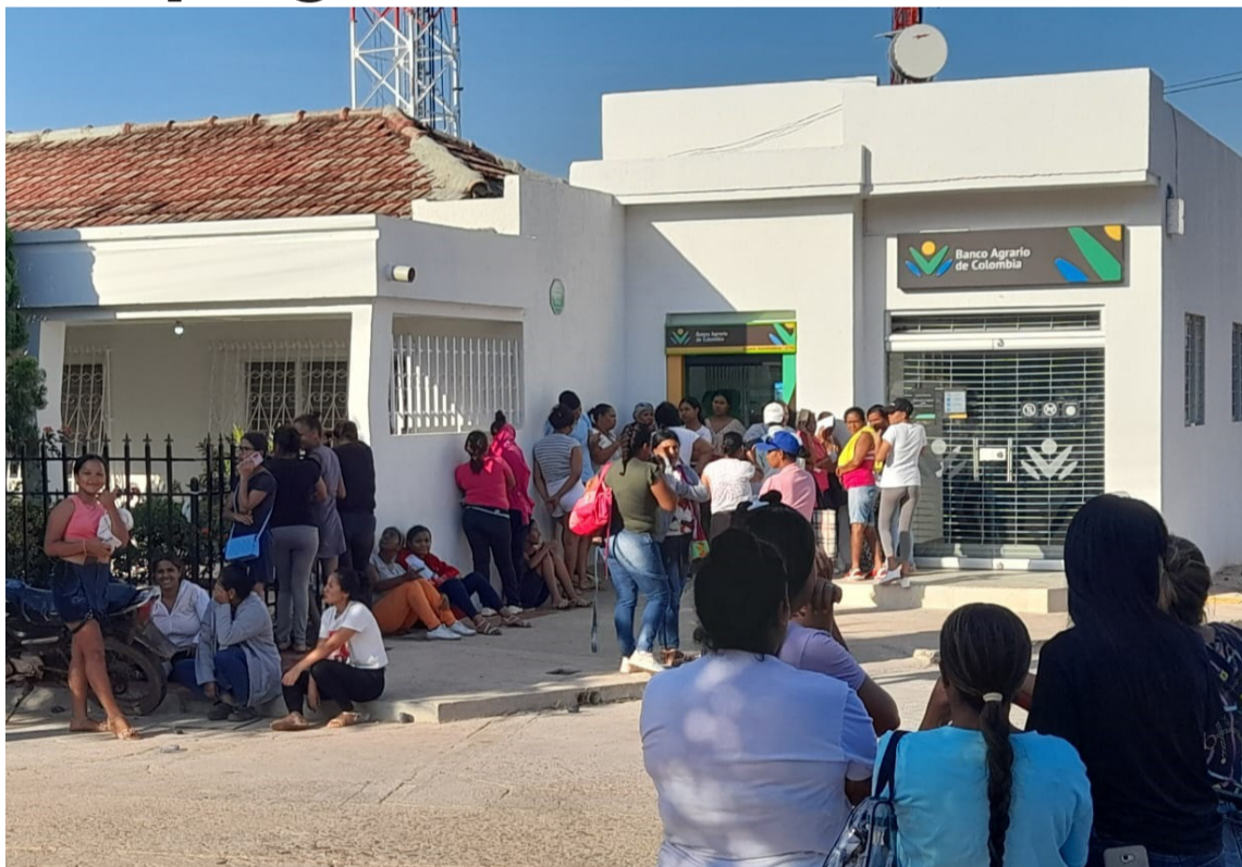
Los beneficiarios se quejan de que están haciendo negocios con turnos en las filas.

Las madres beneficiarias de este servicio denuncian que día a día están expuestas al peligro, debido a que llegan desde las 12:00 a.m.