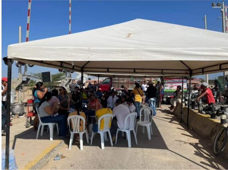
Los manifestantes solicitaron una reunión con el Minminas, Minhacienda, la Superservicios, y la Creg.

La noche del pasado martes se sumó a la protesta un sector de los comerciantes de Manaure, quienes presentaron unas exigencias como la reactivación de las comisiones que conforman voceros de ambas localidades, pidieron también una reunión con el Ministerio de Minas, Ministerio de Hacienda, Superintendencia de Servicios Públicos, Comisión Reguladora de Energía, autoridades del orden local, regional, directivos de