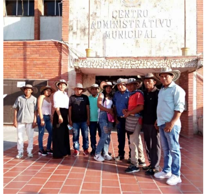
Junta Directiva del Cabildo Indígena Zenú asentado en Maicao.

En concursos alternos al Festival de la Leyenda Vallenata