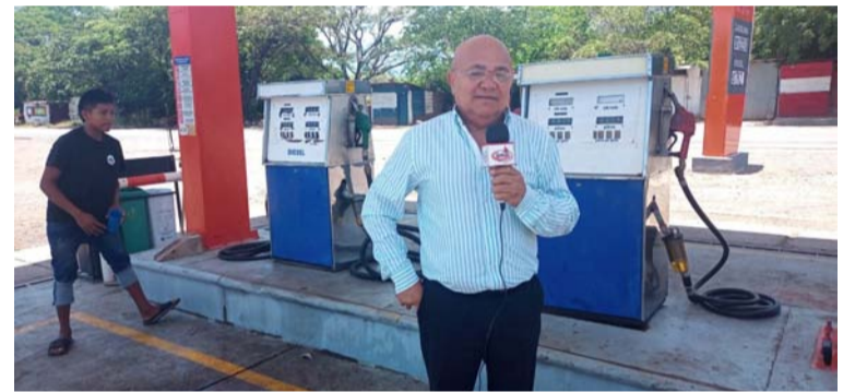
Dijo el empresario que la gasolina subsidiada dura en la estación de Urumita y Villanueva hasta 26 días de cada mes.

Reafirmó López Morón que “se formuló un pliego de peticiones donde tendrán que intervenir los alcaldes, la gobernadora y empresarios de estaciones