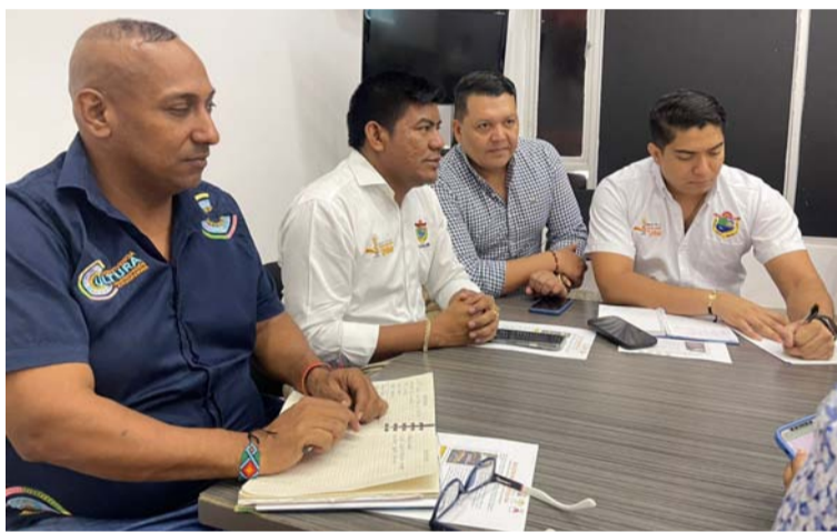
El despacho judicial consideró que efectivamente el debido proceso había sido vulnerado por la presidenta de la corporación.

La orden judicial implica que la presidenta remita el