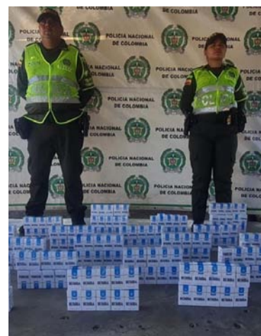
La Policía incautó estos cigarrillos de contrabando.