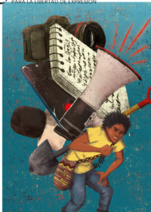
En estos primeros meses del 2023 se han documentado 41 amenazas contra periodistas y también la autocensura.

tas y medios de comunicación. También el anuncio de fondos económicos para medios comunitarios y la política que busca la promoción de medios independientes, alternativos y digitales. De todas maneras estos gestos deben ir acompañados de acciones más contundentes y el gobierno está a tiempo de avanzar en esa dirección.