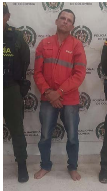
El sujeto fue capturado en flagrancia, dijo la Policía.

nacionalidad venezolana, como el presunto responsable de haber hurtado enseres de la vivienda en men-