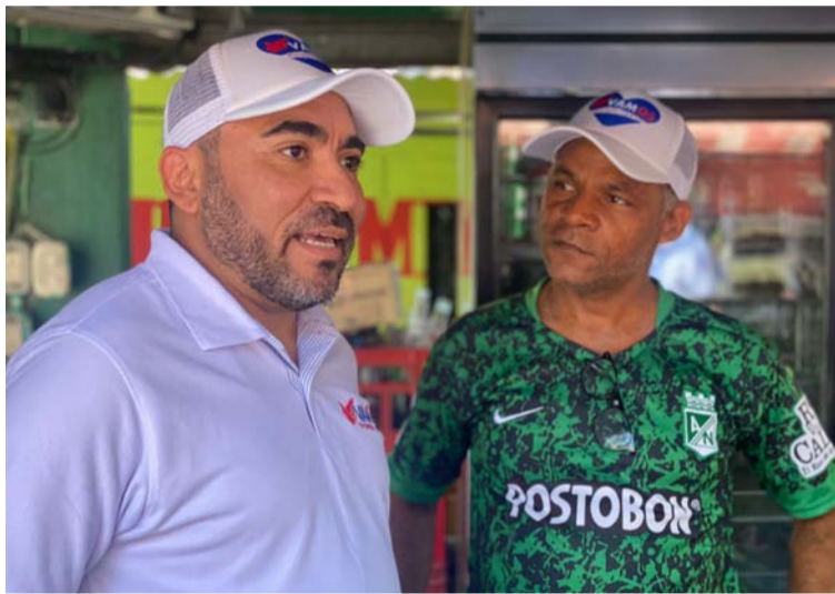
Este contador público dijo que quiere acabar con la corrupción existente en la Gobernación de La Guajira.