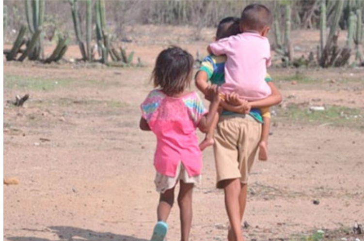
Los líderes guajiros señalan en Bogotá que el Departamento ha sido históricamente olvidado por el Estado.

En el mismo sentido, señalan que el Departamento ha sido históricamente olvidado y que las políticas públicas y decisiones judiciales para proteger el territorio han sido desconocidas e incumplidas. Una de las mayores preocupaciones es la falta de acceso a agua