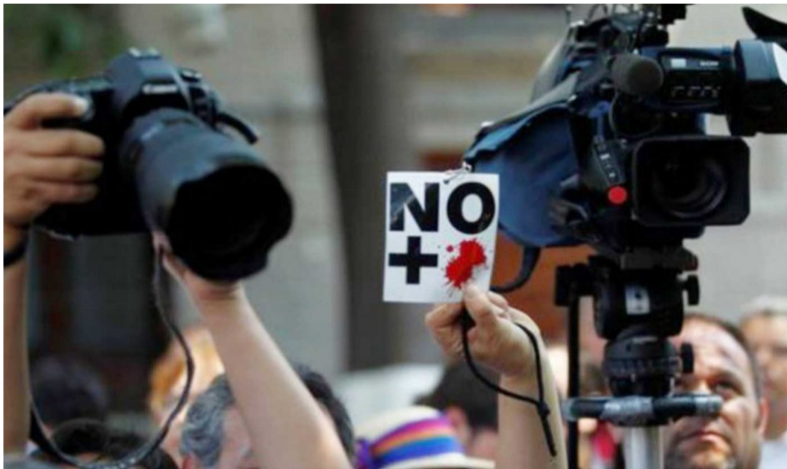
Las elecciones de octubre de este año se anticipan como un escenario tenso.