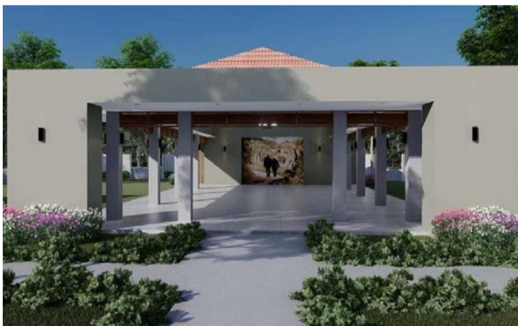
La remodelación del centro de vida 'Casa del Abuelo' en San Juan del Cesar comprende varios componentes.