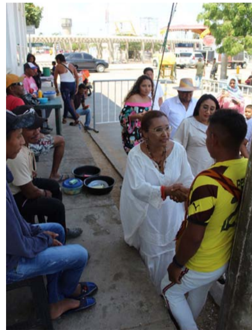
Con los vendedores informales cerca de la plaza principal de Uribia.

deseándole prosperidad a todos sus habitantes, y haciendo un reconocimiento especial a los hombres y mujeres de su etnia wayúú, que conforman el 95% de la población de este municipio, en el cual se encuentra ubicado su territorio ancestral, Mauripao, corregimiento de Bahía Honda.