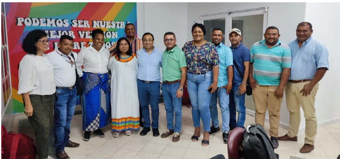
Los educadores guajiros están satisfechos con orden del Viceministerio de Educación.