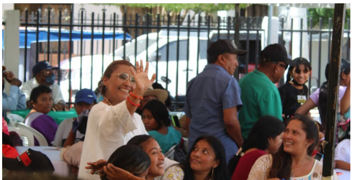
Saludando a los asistentes al almuerzo en el Hotel Juyasirain.