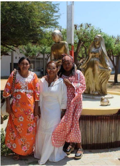
En el Centro Cultural.