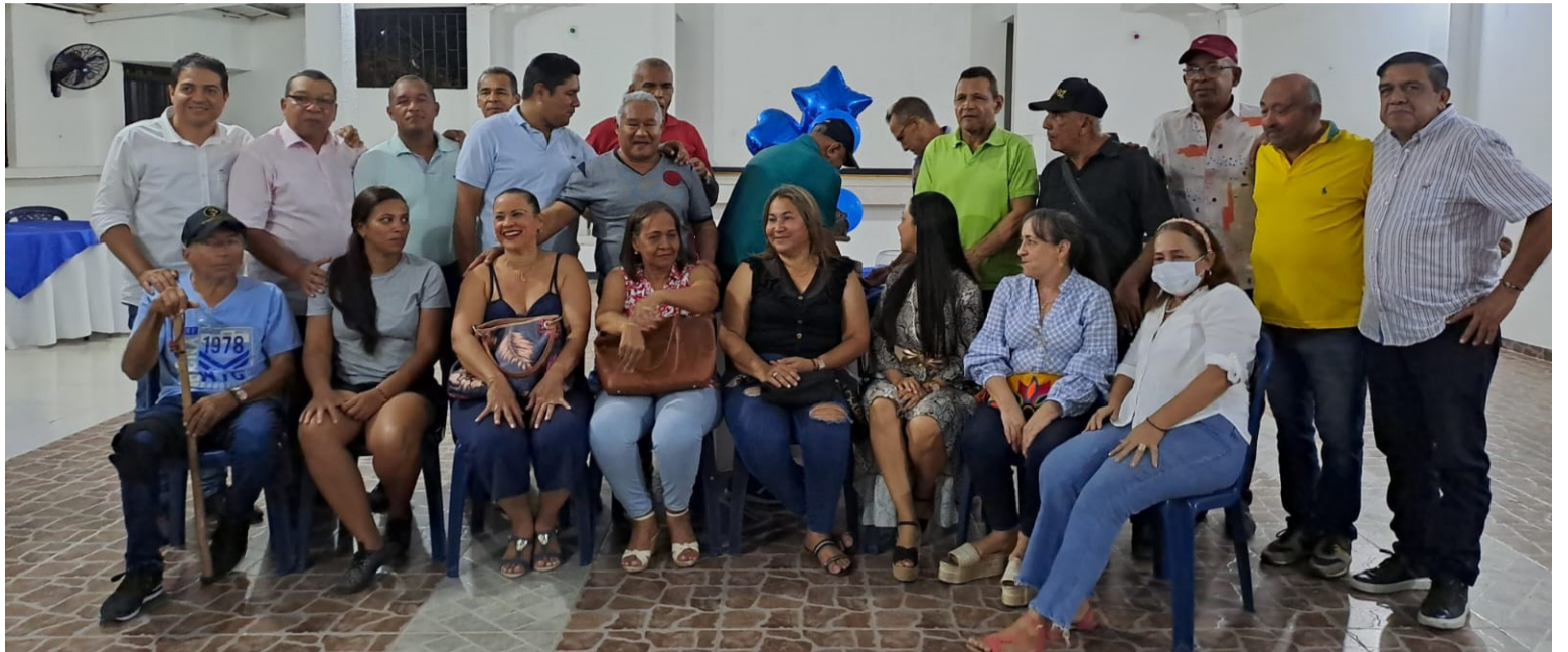
Socios que hacen parte de la Fundación Cuna de Acordeones que tiene su sede en el municipio de Villanueva.

Desde ahí, entonces, emergen grupos entre los villanueveros para defender y engrandecer el Festival, entiéndase bien, para defender y engrandecerlo desde su organización administrativa y folclórica, las relaciones públicas, el posicionamiento nacional como evento representativo de la genialidad de las dinastías