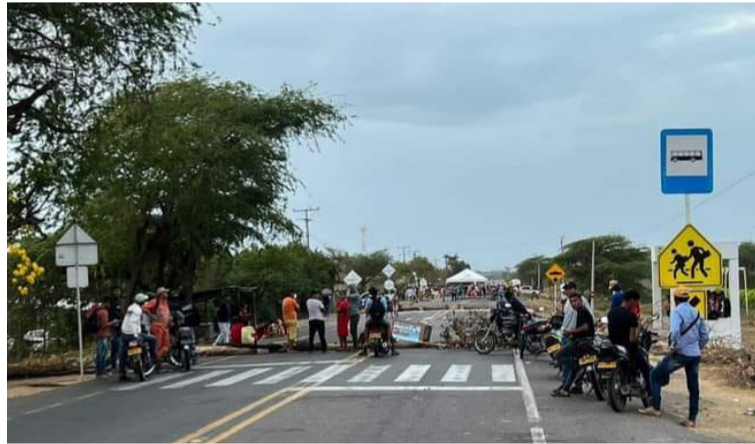
Este es uno de los bloqueos realizados el día de ayer por una de las comunidades indígenas.

Mientras la comunidad accedió a salir del terreno, los manifestantes de estas vías mantenían cerrado el