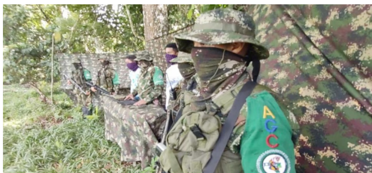
El ‘Clan del Golfo’ adelanta acercamientos y pactó un cese al fuego bilateral con el Gobierno nacional.

En el marco de la fase de exploración con el Gobierno nacional, en medio del proceso de ‘Paz Total’ adelantado por el presidente Gustavo Petro, el ‘Clan del Golfo’ adelanta acercamientos y pactó un cese al fuego bilateral.