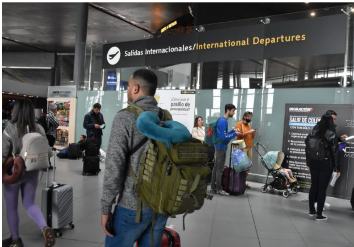
Supertransporte estaría acogiendo la razón que ha esgrimido la aerolínea Viva Air.

La Superintendencia de Transporte decidió someter a control a la aerolínea Viva Air, en medio de la crisis por la cancelación de servicios y vuelos, y pidió a la Superintendencia de Sociedades, admitir a la compañía en el proceso de “reorganización empresarial”.