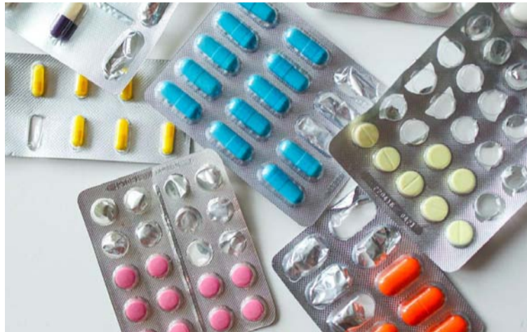
Las pastillas de Amlodipino, Valsartan o Enalapril son las que presentan escasez en el territorio nacional.

Aquellos fármacos que son usados para el dolor como acetaminofén, diclo-