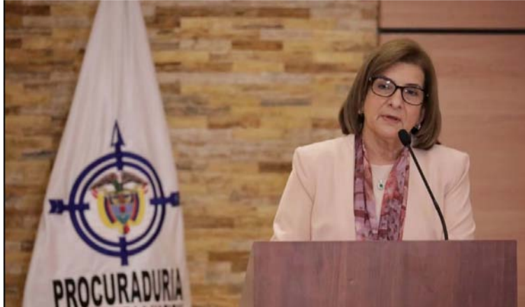
La procuradora Margarita Cabello Blanco presidió la sesión de la Comisión Nacional de Control Electoral.

En la reunión, hizo un llamado a la Organización Electoral del país, para evitar la improvisación. “De poder corregir los errores que se cometieron en las elecciones de 2022, de manera preventiva debemos conocer qué correctivos se van a adoptar para evitar