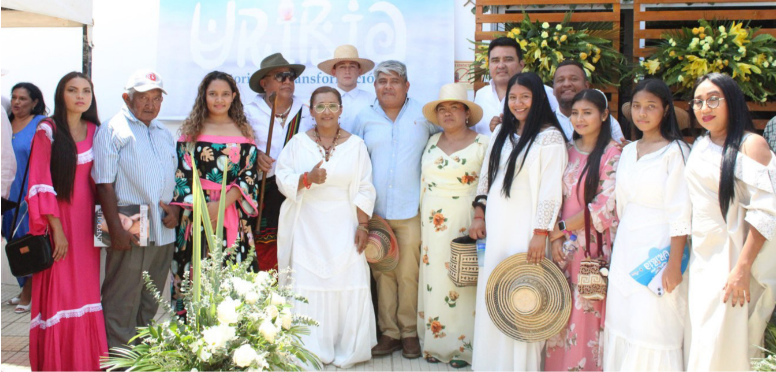
En las instalaciones del Centro Cultural de Uribia.