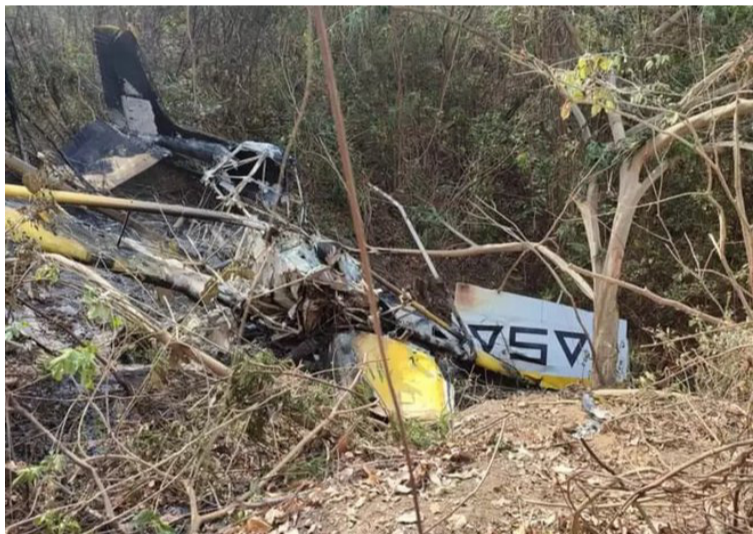
Según una versión, la avioneta estaba realizando actividades de fumigación en cultivos de insumos agrícolas.

De acuerdo con la versión preliminar, la avioneta, de propiedad de la compañía Aero Sanidad Agrícola S.A.S., estaba realizando actividades de fumigación en los cultivos de insumos agrícolas, principalmente de banano, cuando sufrió un fallo en el motor y se pre-