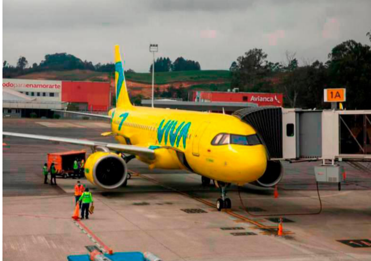
Miles de pasajeros se han visto afectados por la decisión de la aerolínea Viva Air de suspender sus operaciones.

Viva Air, cuya base de operaciones está ubicada en Río Negro, Antioquia, informó que suspende las operaciones tras siete meses sin tener una respuesta de la Aeronáutica Civil sobre el proceso de integración con Avianca.