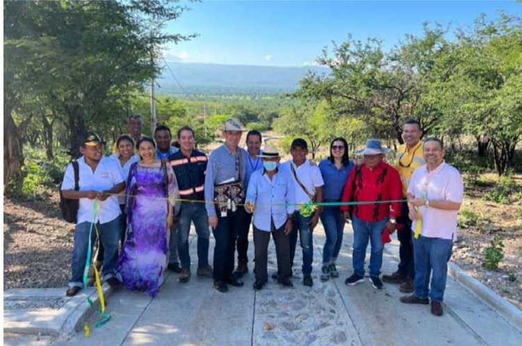
Desde 2017 Cerrejón ha invertido más de 200.000 millones en el desarrollo de iniciativas que promueven el progreso.

La donación de transformadores eléctricos uno mejor el servicio de energía del resguardo de Provincial y otro para el municipio de Hatonuevo con destino a