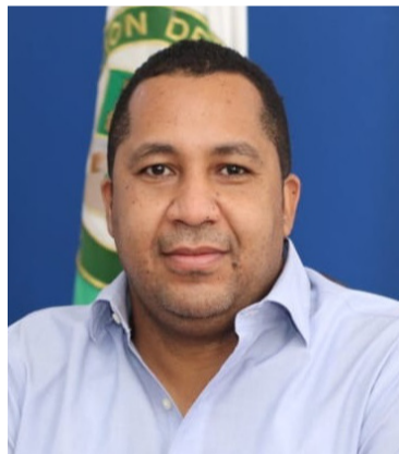
José Ramiro Bermúdez Cotes, alcalde de Riohacha.