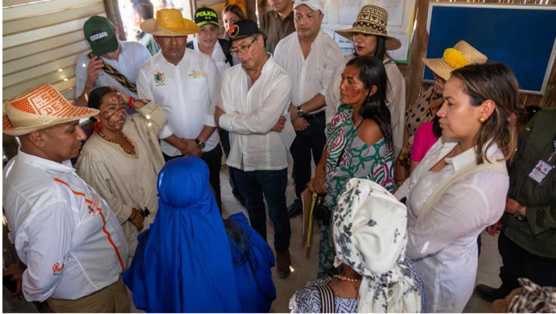
El presidente habla de La Guajira con un conocimiento claro de las diferentes situaciones.