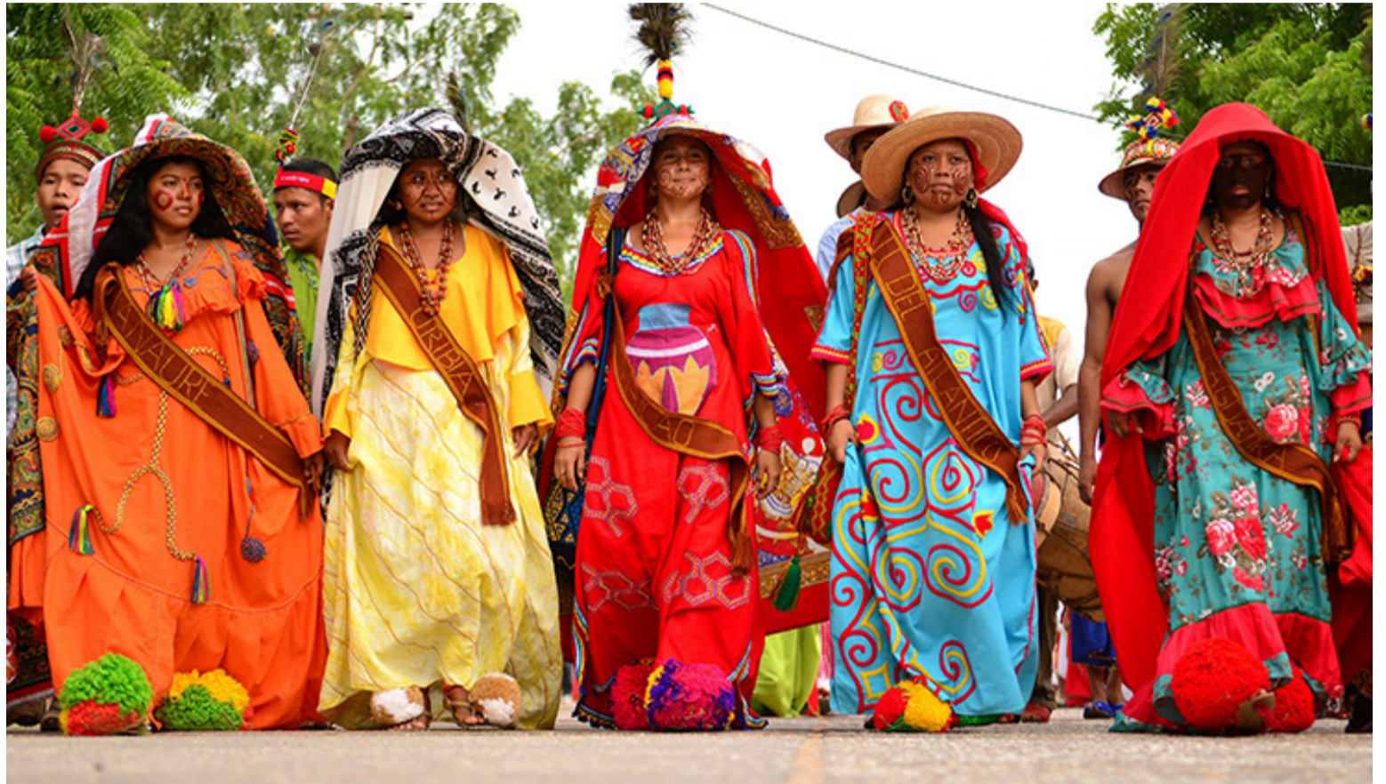
La política pública debe definir como los beneficiarios de cada solución de agua y convertirse en un criterio étnico.

Sobre la seguridad y atención alimentaria, tiene varios responsables, la seguridad alimentaria en forma primaria corresponde inicialmente a los municipios.