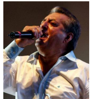
Jorge Oñate cumplió dos años de fallecido.

un gran legado con sus éxitos, Discos de Platino, Congos de Oro, reconocimientos