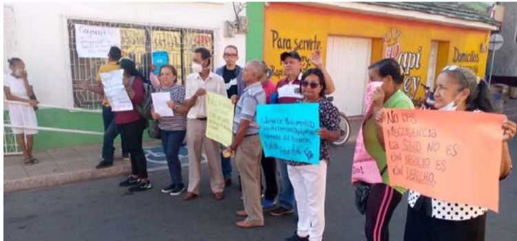
Usuarios afiliados a la entidad de salud Cajacopi, alzaron su voz de protesta por la mala prestación del servicio.

se aglomeraron al frente de la EPS, indicando que “la salud es fundamental”. “Exijo la entrega de medicamentos, soy una persona hipertensa y operada del corazón, queremos solución”, “Cajacopi no entrega medicamentos, no hay quién atiende, nunca autorizan y no respetan la atención preferencial”, indican en cada