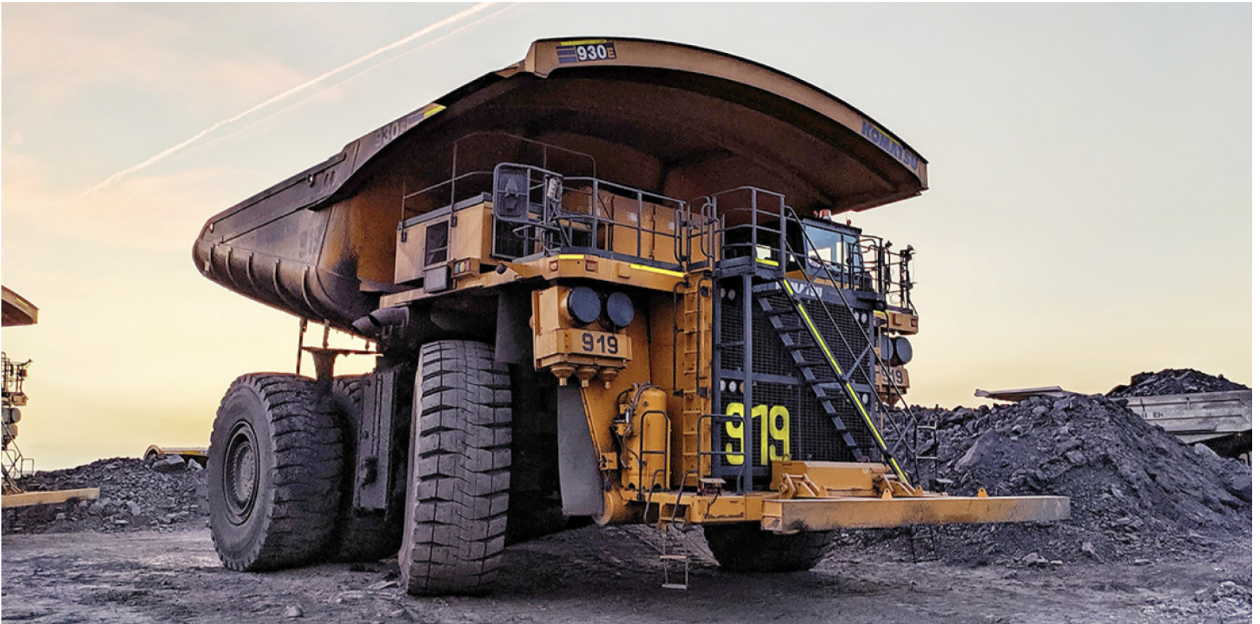
La explotación de Carbones el Cerrejón Limited, termina en el año 2034, estamos a 11 años de que finalice la minería en La Guajira.