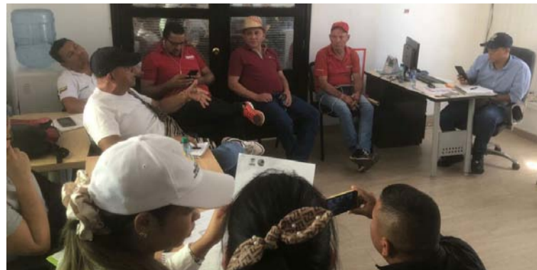
Las autoridades buscan acciones para ver de qué manera permitir que los mototaxistas trabajen de manera regular.

Así las cosas, las autoridades buscan acciones para ver de qué manera permitir que los mototaxistas trabajen de manera regular siem-