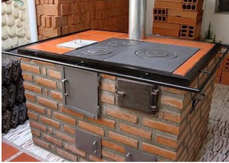
El proyecto que adelanta Corpoguajira beneficiará a los habitantes de La Esperanza, Cascarillal, Tierra Nueva y Las Colonias.