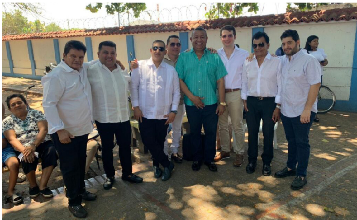
Familiares, colegas y amigos de Jorge Oñate se hicieron presentes para homenajearlo.

Canciones como 'Nido de amor', 'El más fuerte', 'Mujer marchita', 'Enamórate', 'El cantor de Fonseca', 'Ruisseñor de mi Valle', 'Nunca comprendí tu amor', entre otras, fueron interpretadas por 'El Jilguero de América'.