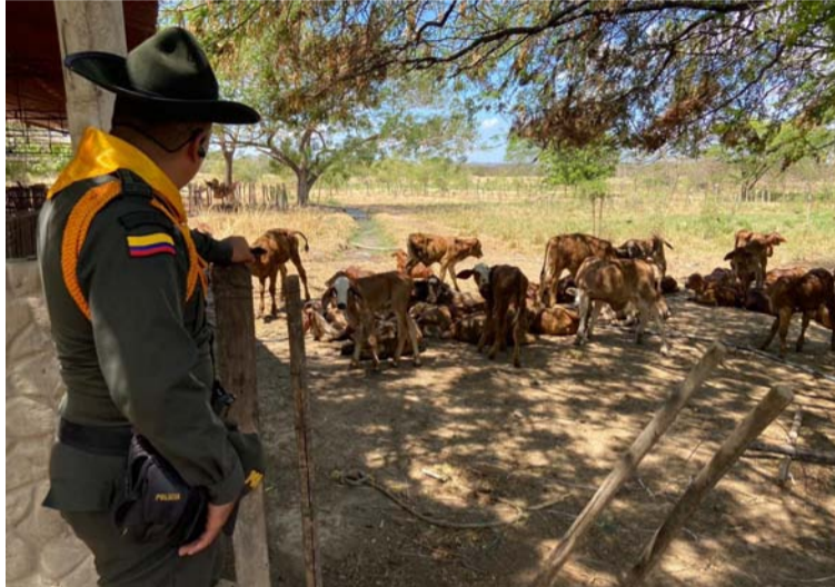
Las actividades iniciaron con una campaña para evitar el hurto de semovientes y asistieron ganaderos de Cotoprix.

También se realizaron visitas a las fincas y parcelas mediante actividades de acompañamiento, en las cuales se les invitó a denunciar a personas que es-