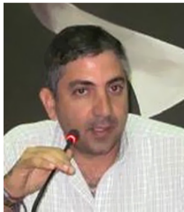
Mohamad Dasuki, alcalde del municipio de Maicao.