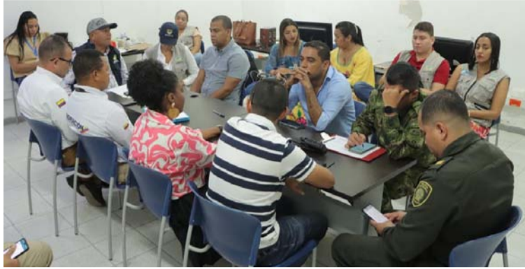
Consejo extraordinario de seguridad realizado en Riohacha por las autoridades distritales y de Policía.