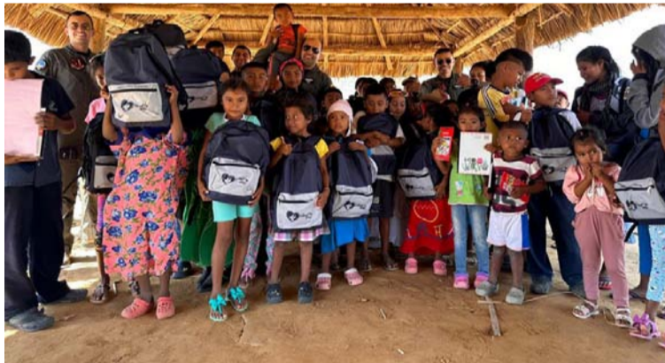
Un grupo de hombres y mujeres arribaron en un helicóptero Bell-212 para hacer entrega de los kits.

Desde el Comando Aéreo del Combate No. 3, un grupo de hombres y mujeres arribaron en un helicóptero Bell-212 para hacer entrega de aproximadamente 50 kits escolares que beneficiarían a los niños de esta zona del país, para iniciar la época escolar con una