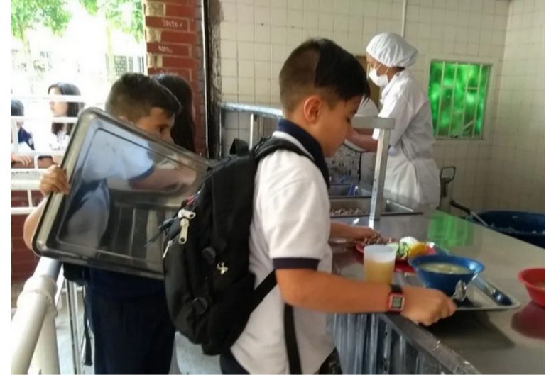
Los estudiantes de primaria y secundaria en el Cesar se ven afectados por la no adjudicación pronta del PAE.

El Ministerio Público ha sido enfático y recuerda el cumplimiento estricto de la directiva 019 de 2022 sobre la “Planeación oportuna de procesos de contratación del programa de alimentación escolar 2023” y de la Resolución 092 de 2021, expedida por la señora procuradora General de la Nación, “por medio de la cual se crea el Comité Especial para el Programa de Alimentación Escolar- Cepae”.