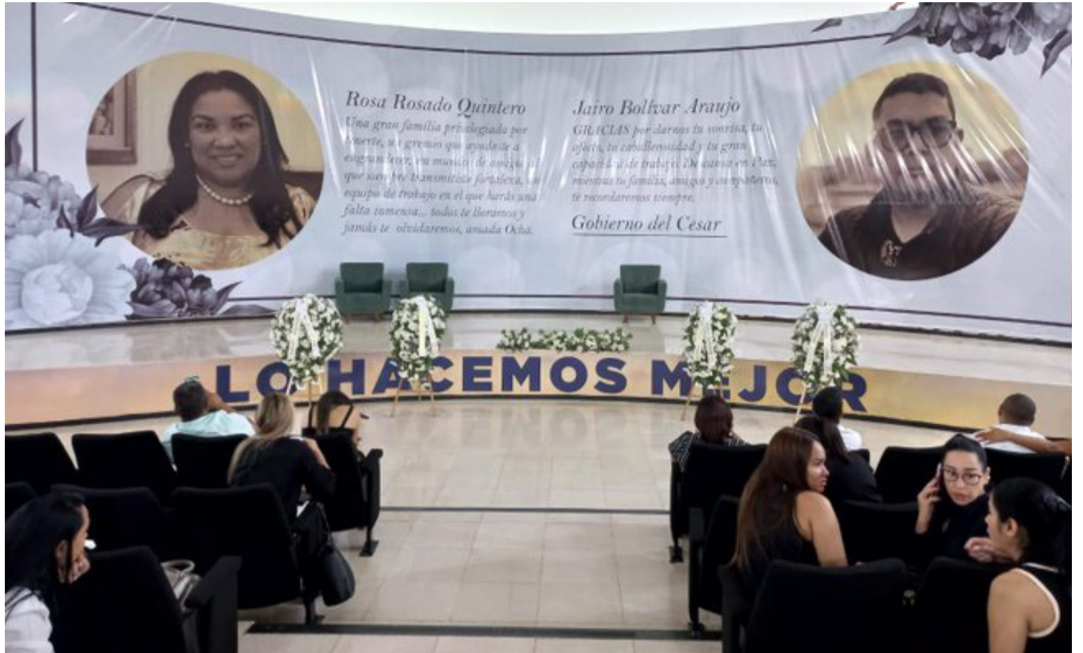
Los cuerpos estuvieron en cámara ardiente en la Biblioteca Departamental 'Rafael Carrillo Lúquez' en Valledupar.

Se anunciaron homenajes póstumos por parte del Círculo de Periodistas de Valledupar y otras instituciones. Los actos del sepelio se llevarán a cabo este viernes a las 10:00 de la mañana.