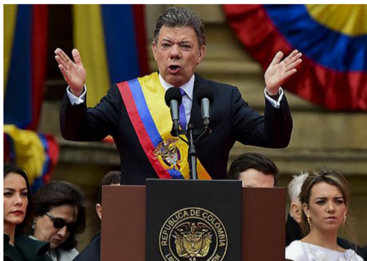
El expresidente Juan Manuel Santos presidió el Partido de la U, de derecha, y gobernó con la oposición.

El barullo de los partidos sin política o de la política sin partidos sorprende y tiene tanto de largo como de ancho.