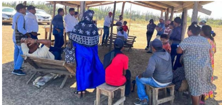
La comunidad indígena Romana impide con su bloqueo las labores en el Parque Eólico Windpeshi.

hecho radican en la petición de Julapa para evaluar el proceso de consulta previa que se llevó a cabo