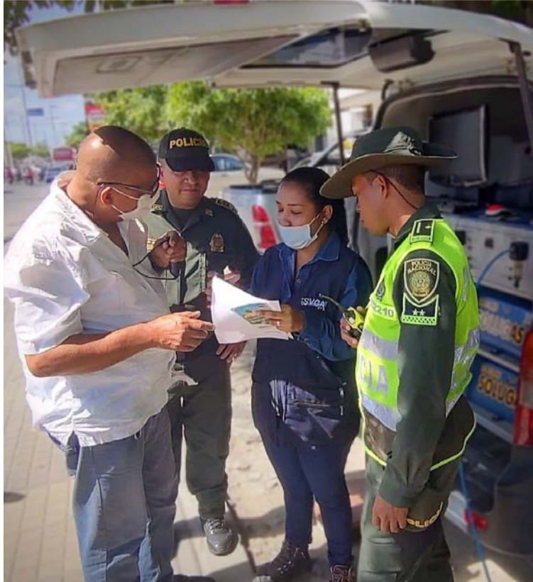
Alrededor de 300 automotores serán revisados por medio de estas jornadas que son totalmente gratis.

“El beneficio de este ejercicio es propender por un ambiente sano en materia de aire en el Departamento y realizar el respectivo control de actividades de transporte, verificando y