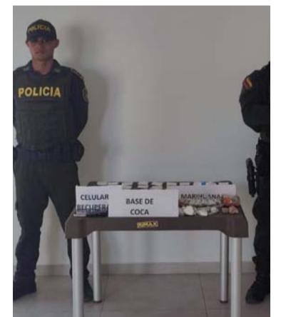
Estupefaciente incautado por las autoridades.

Cabe mencionar que los agentes del orden pertenecientes al Grupo de Ope-