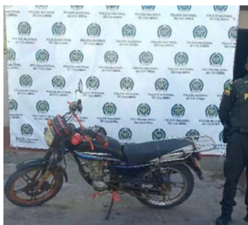
Los vehículos fueron aprehendidos porque no presentaban la documentación requerida por las autoridades.

pesos y fue puesta a disposición de la Dirección de Impuestos y Aduanas Na-