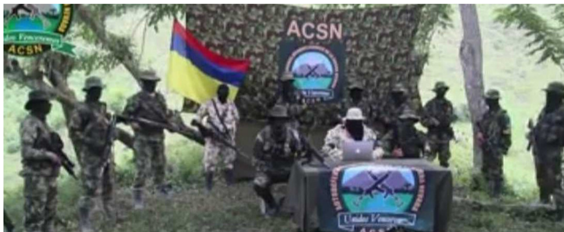
El grupo ‘Los Pachenca’ pide reunirse con el Gobierno desde el próximo 27 de enero.

Piden iniciar la mesa de acercamiento entre esta estructura y la delegación designada por el presidente Petro en la vereda Los Moros, jurisdicción del corregimiento de Minca, Santa Marta.