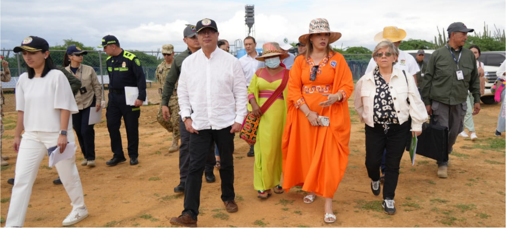
Con la llegada del nuevo gobierno del presidente Petro se respiran nuevos vientos y tiempos de esperanza para el pueblo wayuú.