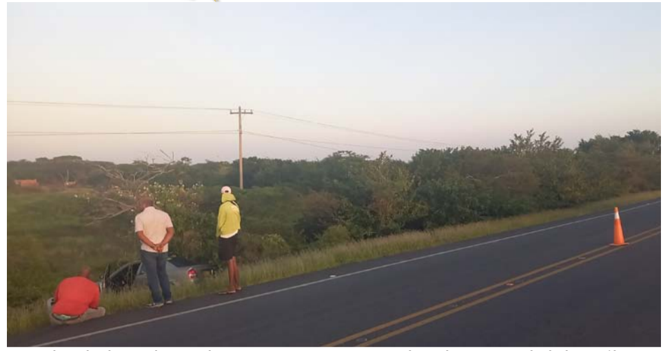
El siniestro aconteció a la altura del kilómetro 70+500 metros en la vía que de El Ebanal conduce a Camarones, sobre la Troncal del Caribe.

Fue llevado a un centro médico de la ciudad