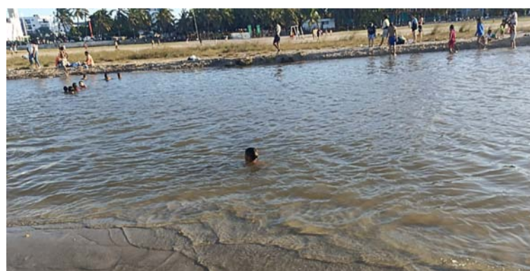
Se han incrementado los controles en las playas y en la desembocadura del río Ranchería en Riohacha.