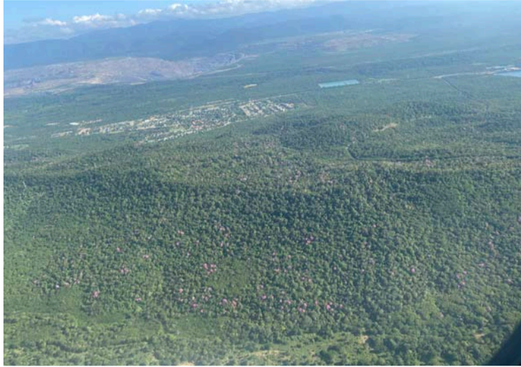
El establecimiento de las diferentes plántulas, demuestran el buen estado y recuperación del ecosistema.

“En Cerrejón venimos implementando diferentes acciones de monitoreo y seguimiento a la fauna y flora, presente en las áreas de la mina y Puerto Bolívar que nos permiten identificar estos resultados, así como realizar análisis de las es-