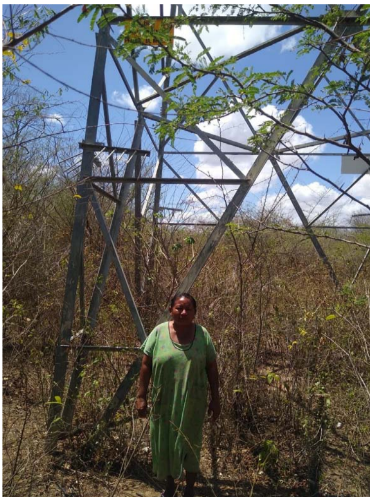
El Shaleo es una comunidad conformada por treinta familias que equivalen a 130 personas.

media guajira, las divisiones que existen al interior de las comunidades por los procesos de consulta previa, así como pretenden que suceda en los predios donde habita la comunidad El Shaleo que por ser propiedad privada no tienen derecho a una consulta previa según la empresa Interconexión Eléctrica S.A.