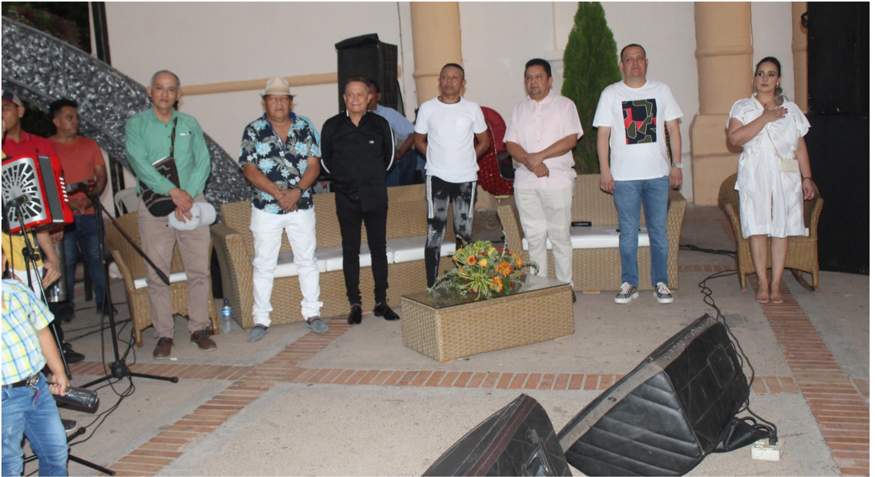
Grupo de personajes vinculados a la música vallenata que fueron objeto de reconocimientos en acto realizado en El Molino.