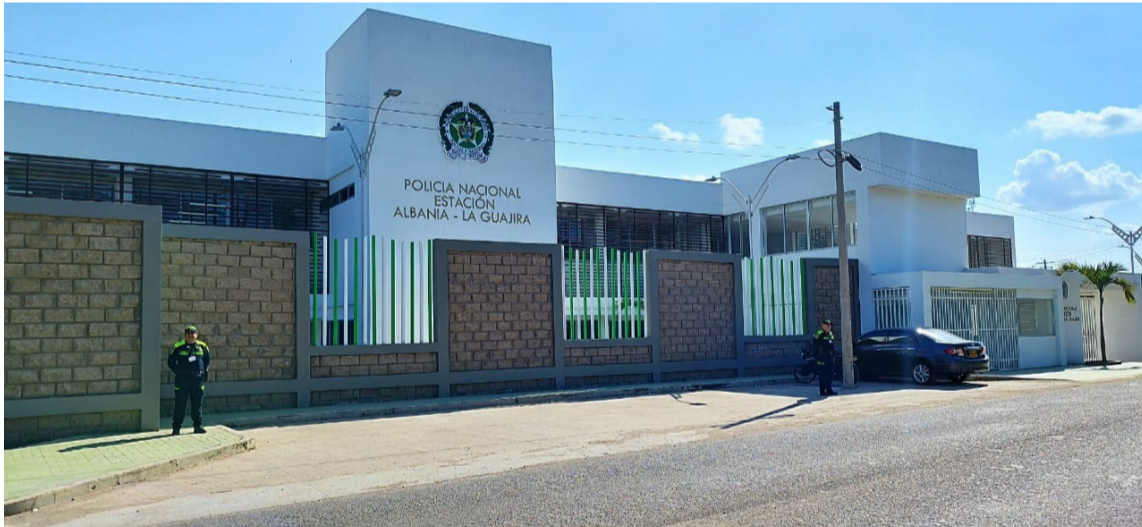
La nueva Estación de Policía cuenta con capacidad para albergar a 115 uniformados.