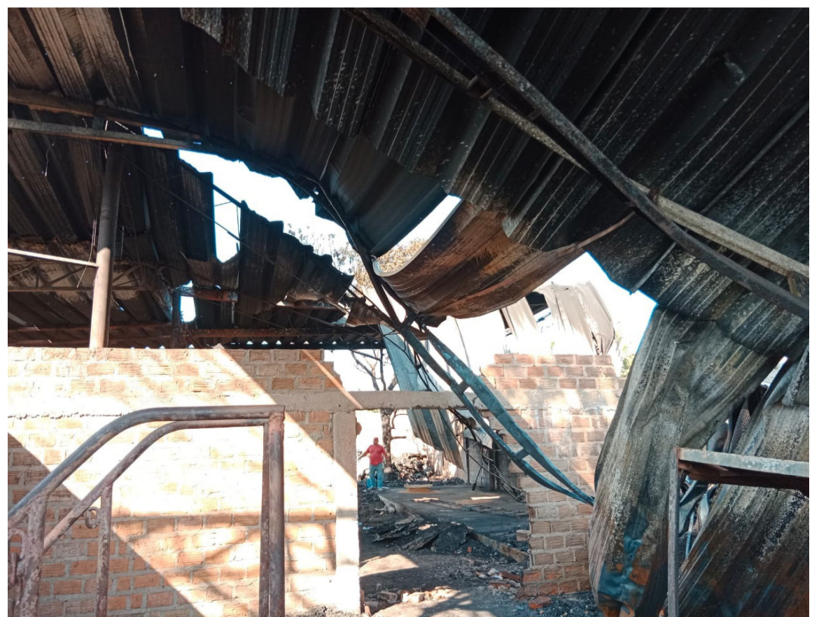
La maquinaria consistente en prensadoras y cortadoras fue consumida por el incendio.