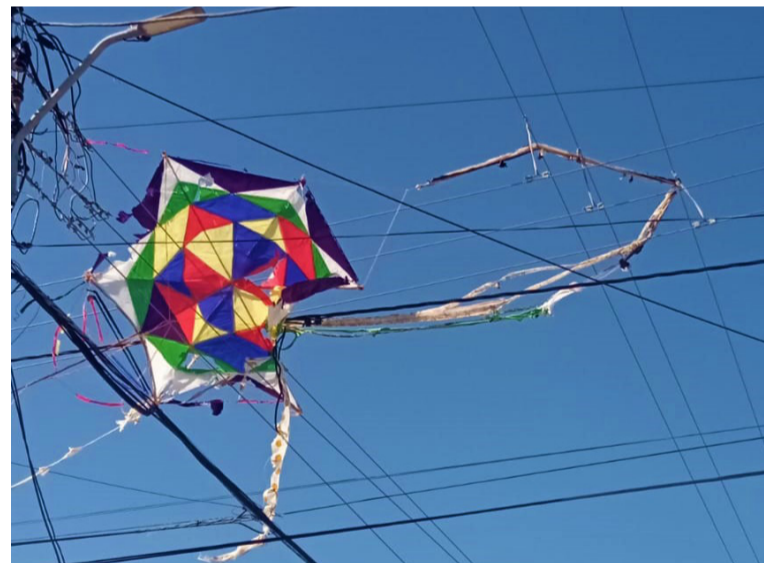
Se busca evitar que las cometas se enreden en las redes eléctricas para evitar emergencias.