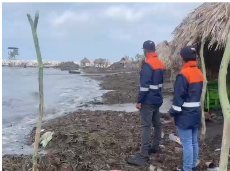
Hasta el momento los vientos no han superado el rango de los 50 km/h, pero si llega a 70 Km/h habrá restricciones.

meno atmosférico sobre el mar Caribe es propio de esta temporada del año, y se debe al incremento en el tránsito de los vientos alisios sobre el océano, lo cual genera la interacción de dos zonas de alta presión sobre las aguas y una de baja presión que permanece ubicada cerca al litoral colombiano, denominada del Darién.