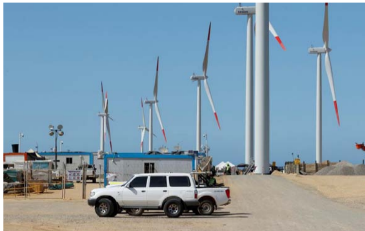
La transición energética no se limitará al cierre de las centrales de carbón y al desarrollo de energías limpias.

y diarreas agudas, son de alta incidencia, tanto así que a la semana epidemiológica 50, ya son 158 las vidas que han cobrado en el transcurso del año.