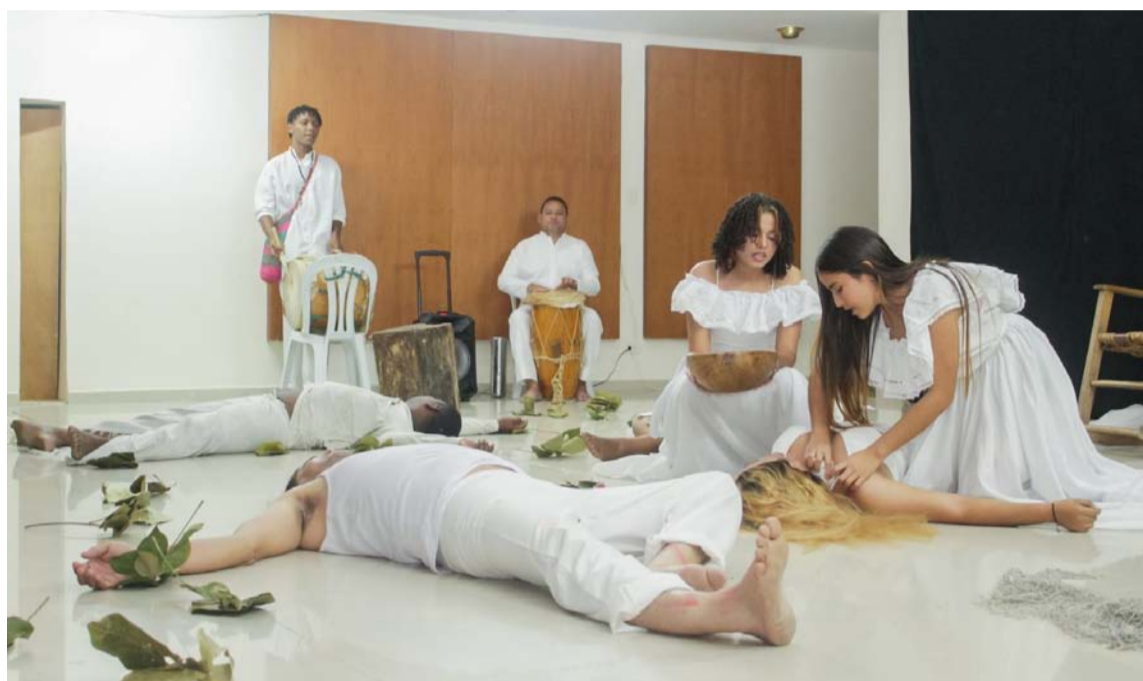
Con esta obra buscan darle voz a muchas víctimas que se encuentran desaparecidas.