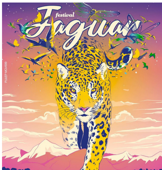
El Festival Jaguar Palomino estará con toda su programación en playa Bernabé, Km. 70 de la Troncal del Caribe.

La experiencia Jaguar abrirá sus puertas este próximo 5 de enero de 2023 al público en general a partir de las 10:00 a.m. La participación de niños, familias y menores de edad estará permitida hasta las 7:00 p.m. La fiesta continuará hasta el día siguiente solo para mayores de edad.