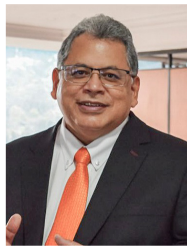
Ulahy Beltrán, superintendente Nacional de Salud.

2-. El programa de salud no cumplió con los indicadores de capital mínimo y patrimonio adecuado para las vigencias 2017, 2018, 2019, 2020, 2021 y agosto 2022, respecto al régimen de inversiones para las vigencias 2016 a 2021 y con corte al mes de agosto de 2022, no constituyó inversiones computables que le permitan cumplir con los requerimientos financieros