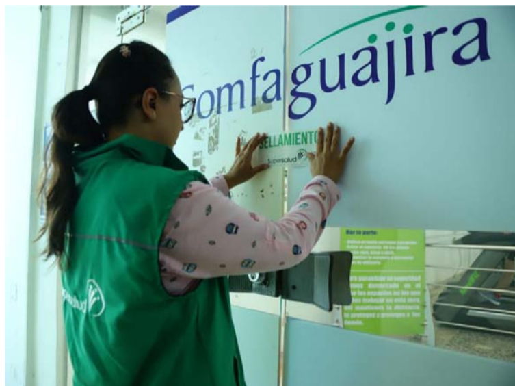
El programa de salud de Comfaguajira evidenciaba deterioro en sus indicadores financieros y administrativos.

"Nuestras decisiones, que son de carácter técnico, tienen como finalidad minimizar la afectación del aseguramiento en salud y brindar garantías para la prestación efectiva de los servicios requeridos por los ciudadanos, que en este caso concentran un número importante de usuarios objeto de especial protección constitucional", indicó el superintendente Nacio-