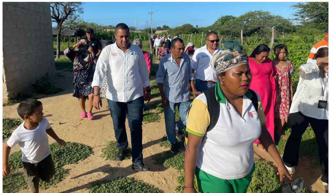
Pedirán acompañamiento de Gobernación, MinInterior, Procuraduría y Defensoría.