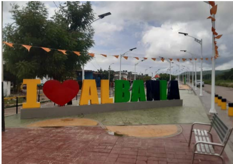
La ceremonia de inauguración del Parque Lineal contó con la participación del alcalde de Albania, Néstor Sáenz.

de ambos sectores beneficiados, quienes recibieron la obra con entusiasmo, solicitándole a la empresa contratista y al mandatario de turno la garantía en el mantenimiento y adecuación en la medida en que la obra presente inconvenientes a futuro.