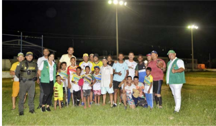
Autoridades de Maicao y líderes comunales de Villa Estadio, en el retorno del alumbrado al estadio de sóftbol.

horario nocturno, permitirá a los vecinos del escenario sentir mayor seguridad debido a que la iluminación alejará a los delincuentes y personas inescrupulosas que hacían mal uso de este escenario.