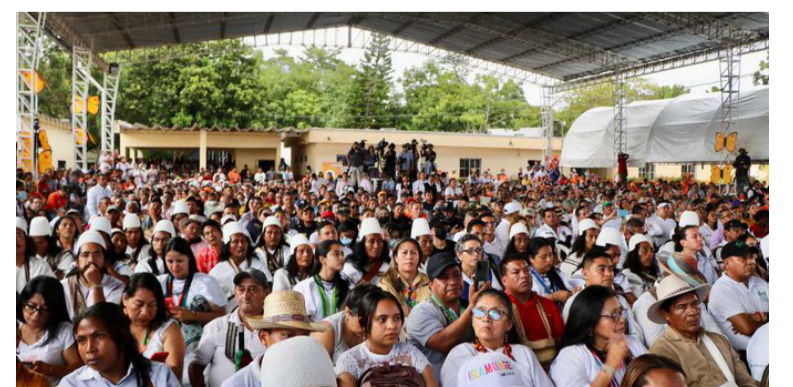
Gran concurrencia se vio en Aracataca en el lanzamiento de este nuevo modelo de salud que hizo el Gobierno.

"Esto es lo que queremos presentar como el inicio de una primera etapa, con la que queremos que renazca la salud pública".