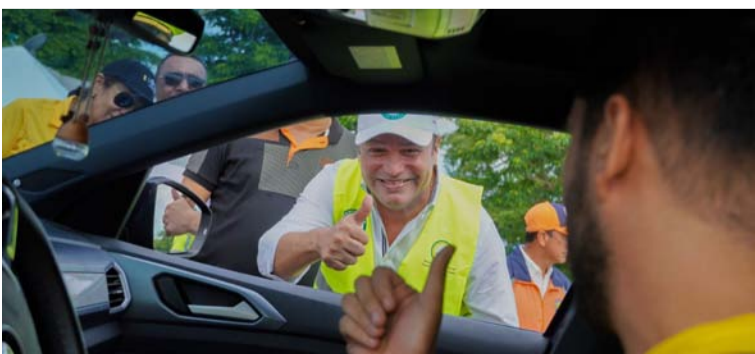
El enfoque del plan de trabajo está direccionado a prevenir al máximo los accidentes y a preservar la seguridad.