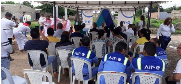
Los beneficiarios serán las 643 familias en más de 4 barrios de la Comuna 3, mejorando significativamente el servicio.