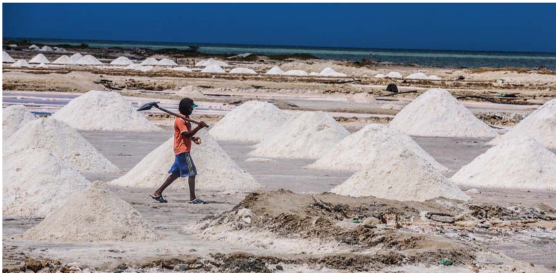
Robles desmiente el manejo de 400 mil toneladas en volúmenes de comercialización.

Señaló que es totalmente falso que de octubre de 2020 se hayan comercializado 40 mil toneladas de sal sin ningún tipo de vigilancia, teniendo en cuenta que para el cuarto trimestre de ese año, que comprende los meses de octubre, noviembre y diciembre, “lo que está reportado y avalado por la Agencia Nacional de Minería son 20