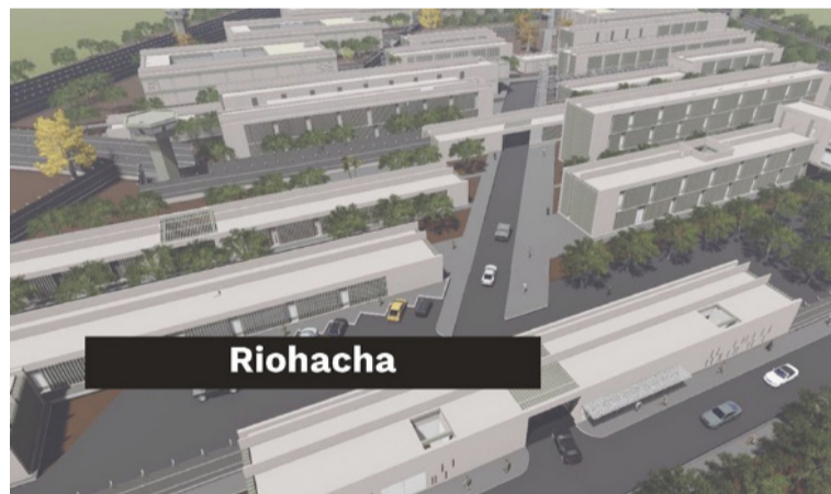
Según orden judicial, la Policía deberá permanecer vigilante hasta que culmine construcción de la nueva cárcel.

Se requiere al Ministerio de Justicia y del Derecho, a la Unidad de Servicios Penitenciarios y Carcelarios, Uspec y del Inpec, enviar sin más dilaciones el proyecto para la creación de los 2 pabellones de detenidos a ubicarse en los circuitos judiciales de Maicao, San Juan o Villanueva.