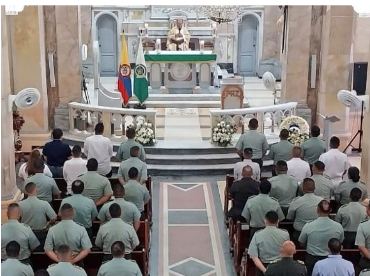
Las actividades de conmemoración de la Policía dieron inicio con una eucaristía en la Catedral de Riohacha.