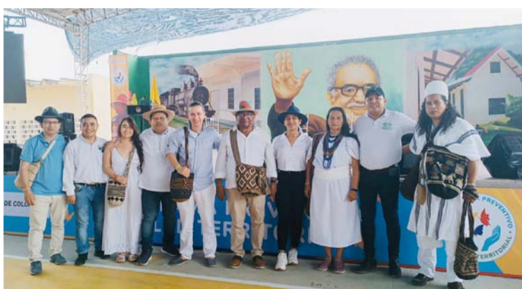
Las comunidades indígenas recibirán especial atención del Gobierno en el Programa Preventivo de Salud.

enfermedad y abandonó la prevención. Por esto, "este sistema de salud tiene que volver a una vocación de prevención, a discutir los determinantes sociales de la salud o la crisis climática, por ejemplo", indicó la ministra.