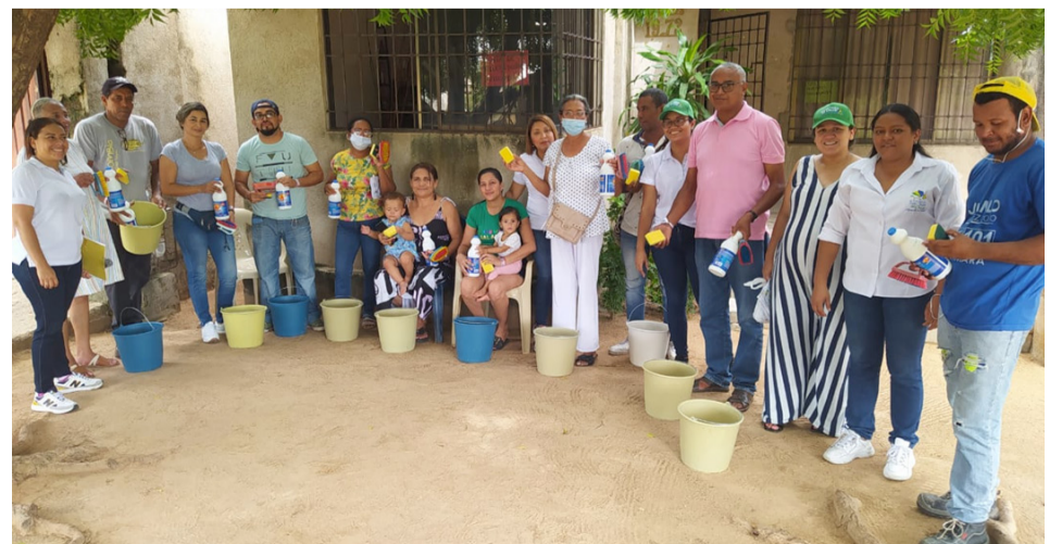
En la jornada de prevención contra el dengue en San Juan se hizo demostración de cómo lavar las albercas, se entregaron kits de aseo y folletos.