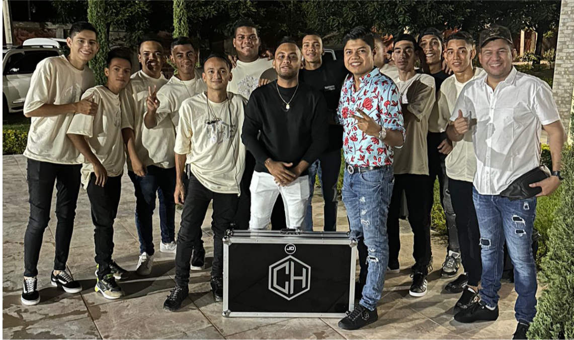
Los asaltantes les hurtaron celulares y dinero en efectivo a los músicos de 'Che' Díaz.

"Gracias a Dios mis músicos están bien, a pesar de que dos de ellos fueron golpeados. Lo importante es la vida, lo material se recupera", dijo el cantante de la dinastía Díaz.