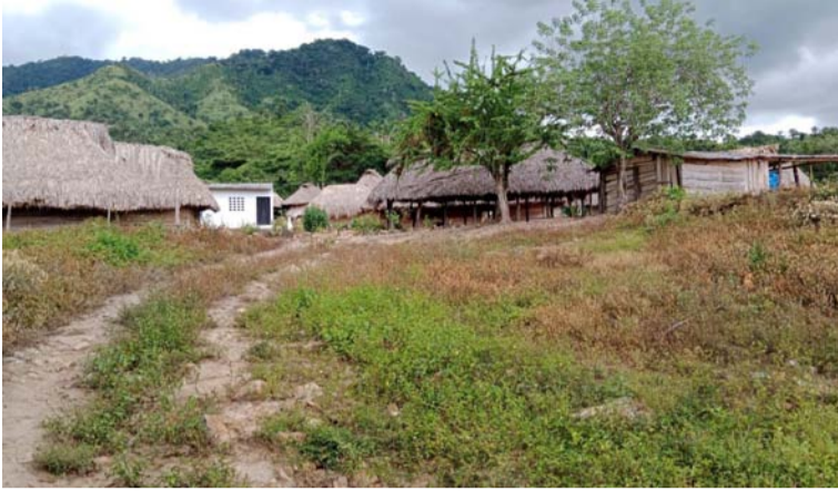
En la vereda Naranjal, corregimiento de Juan y Medio, habitan más de 40 familias, unas 120 personas.