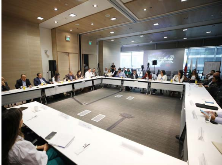
82 compañías aceptaron algunas de las medidas del Pacto de la Justicia Tarifaria, incluyendo 6 transportadoras.

"A nivel nacional va impactar positivamente la tarifa en el sentido en el que percibiremos a final de este año una reducción que está entre el 4% y el 8%", indicó