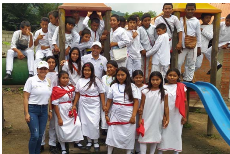
La niñez y la juventud constituyen el futuro de San Juan.

tensa y dispersa ruralidad, donde tienen asentamiento grupos poblacionales con mucha pertenencia étnica, entre los cuales se destacan los indígenas wiwa y los afrodescendientes, que conforman el 46% de la población total del municipio.