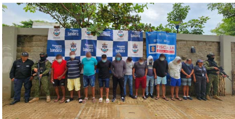
Entre los capturados por las autoridades está un oficial retirado de la Policía Nacional conocido como 'La R'.