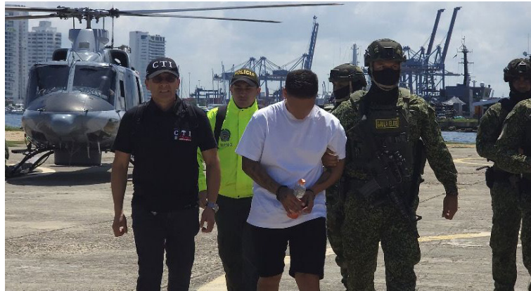
Aspectos correspondientes a las labores de captura adelantadas por miembros de la Fiscalía y la Armada Nacional.

La investigación a esta estructura criminal permitió establecer que se le han incautado más de siete toneladas de cocaína en 12 operaciones de las Fuerzas Militares, así como el decomiso de alrededor de dos mil millones de pesos en