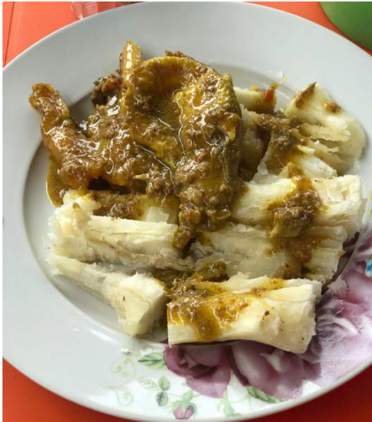
La pedagogía sobre los platos y las preparaciones tendrá su espacio en los talleres con portadoras de la tradición.

Renombrados conferencistas, investigadores, periodistas, académicos y cocineros se han dado cita en Riohacha, hasta el 14 de