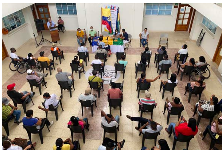
Las víctimas en San Juan esperan ser reconocidas.