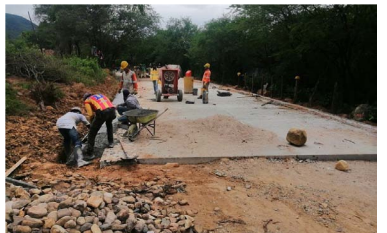
En San Juan se viene impulsando la adecuación de vías.

De modo que, reactivar el Pdet es reactivar los Acuerdos de Paz, y es convertir a Colombia en potencia mundial de la vida y en una Colombia humana.