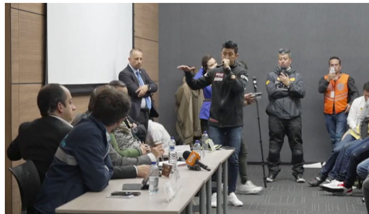
Varias protestas se realizaron en Bogotá, los motociclistas en reunión manifestaron su inconformidad.

Al respecto, el presidente Gustavo Petro aclaró a