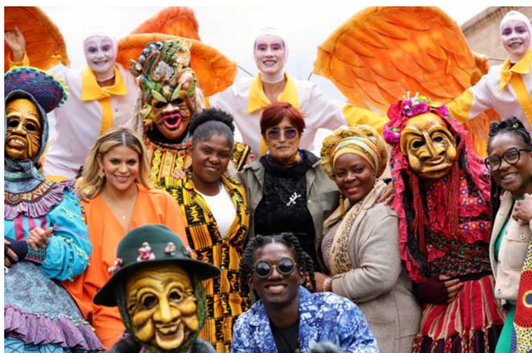
Según lo establece el proyecto, el Día de la Raza pasará a llamarse Día de la Diversidad Cultural.

El Ministerio de Cultura radicó un proyecto de ley que pretende reformar la Ley 397 de 1997 para cambiar la denominación de esta cartera y el del Día de la Raza que se conmemora cada 12 de octubre.