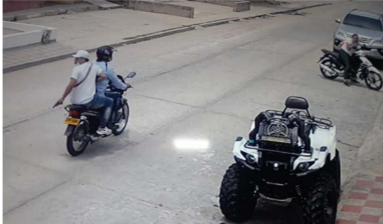
En cámaras de seguridad del sector quedaron grabados los delincuentes que se transportaban en motocicleta.

gar en la calle 19 con carretera 13, sector urbano de la capital de La Guajira, luego que varias personas habían retirado poco más de 15 millones de pesos.