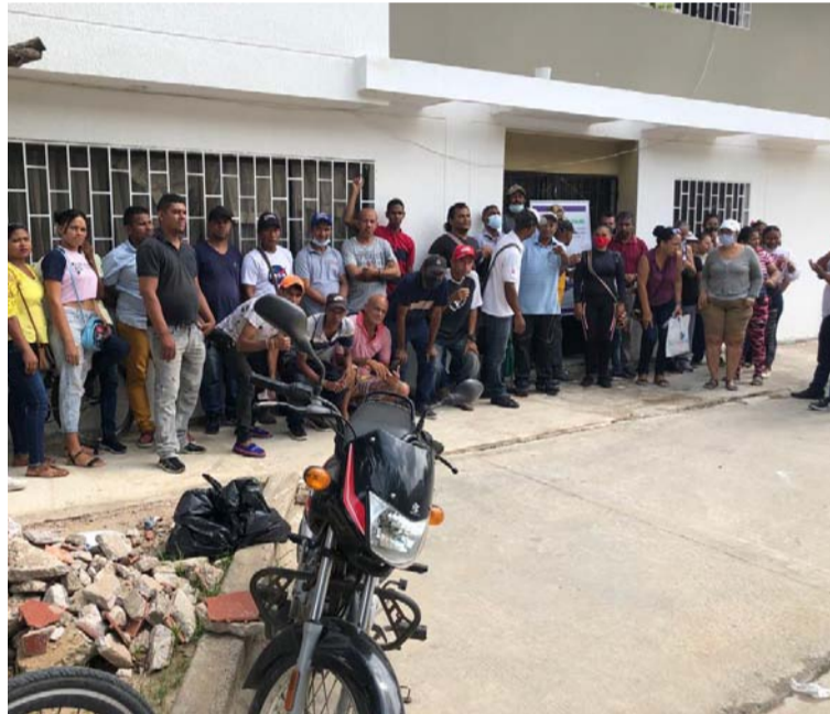
Grupo de deportistas discapacitados quienes hicieron sentir su protesta frente a la Gobernación de La Guajira.

“Nos excluye en que nuestras peticiones no nos