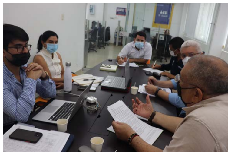
Este ejercicio se desarrolla alterno a la participación de la Cámara en el Comité de Fronteras de Confecámaras.

21% y apoyo al emprendimiento con un 20%.