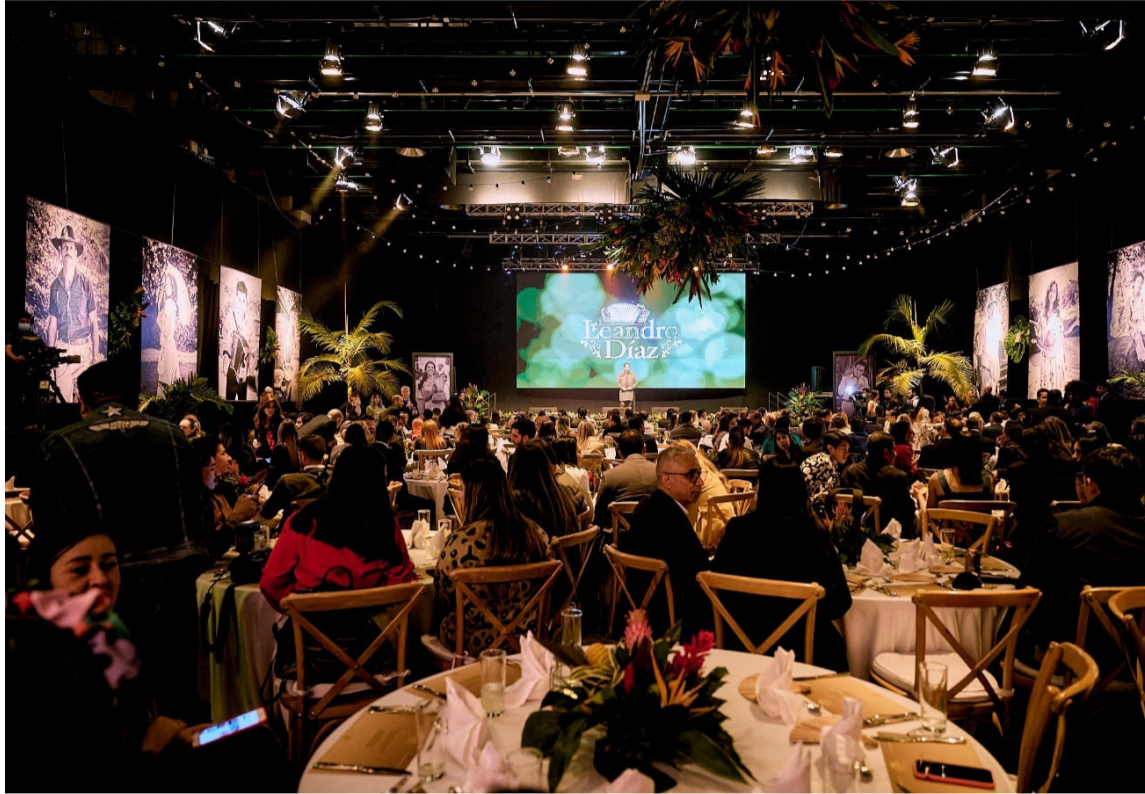
Representantes de medios de comunicación, en el lanzamiento de 'Leandro Díaz'.