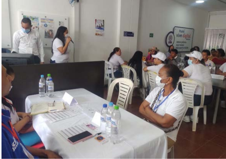
La feria se inició en el boulevard Julia García, ubicado en la calle 10 entre carreras 9 y 10 del municipio de Maicao.

En el recinto Vive Digital se dio inicio a la rueda de