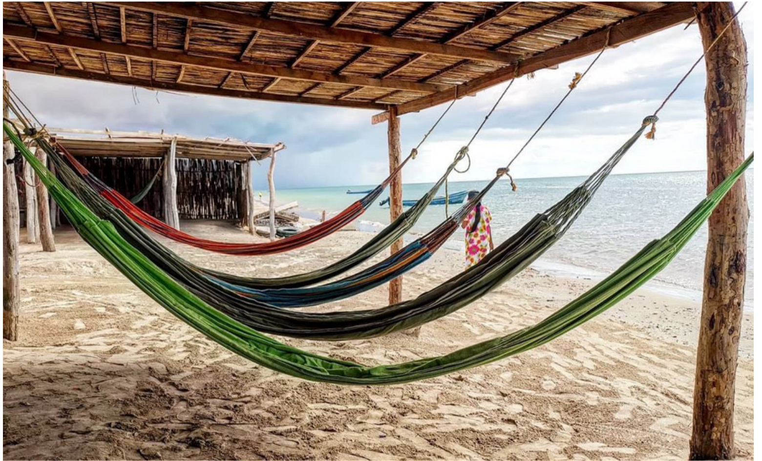
La eliminación de los beneficios tributarios preocupa al sector del turismo del país y ello afectaría a La Guajira.

Asimismo, el literal e) del Parágrafo 5 del artículo 240 del Estatuto Tributario, modificado por el artículo 80 de la Ley 1943