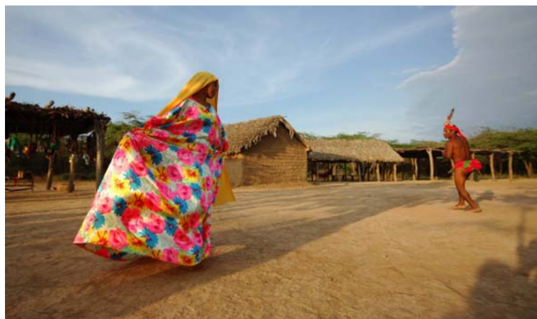
La Guajira es hoy uno de los departamentos más visitados, dinamizando la economía por la venta del servicio.