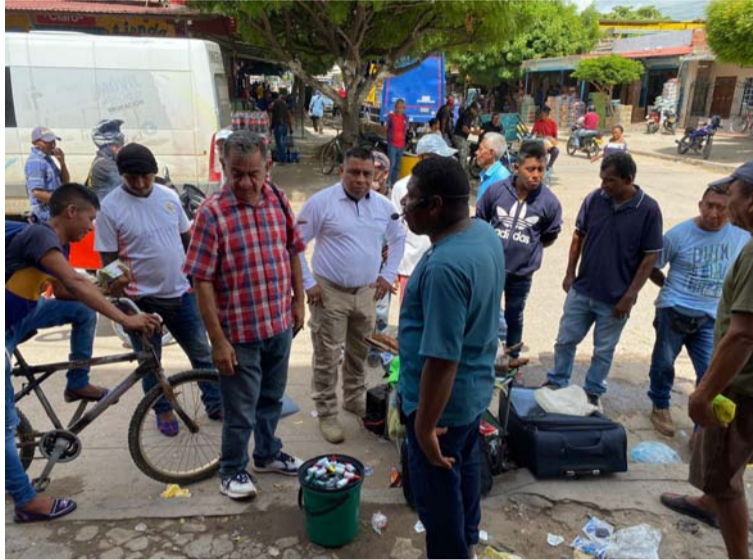
Las autoridades informaron que se adelantaron labores de verificación de antecedentes a distintas personas.

Durante finales de agosto e inicio de septiembre la