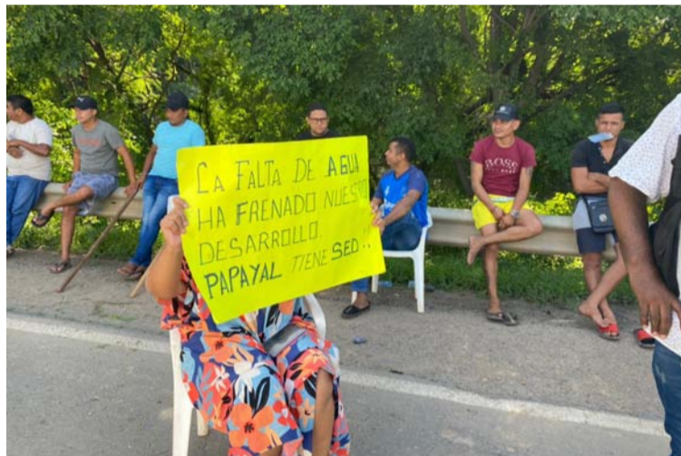
Comunidades protestaron en la vía nacional, en el sector de Pozo Hondo. Exigen solución a carencia del agua.

el proyecto, para lo cual ya se ha reunido con la empresa prestadora del servicio Veolia, y este viernes a las