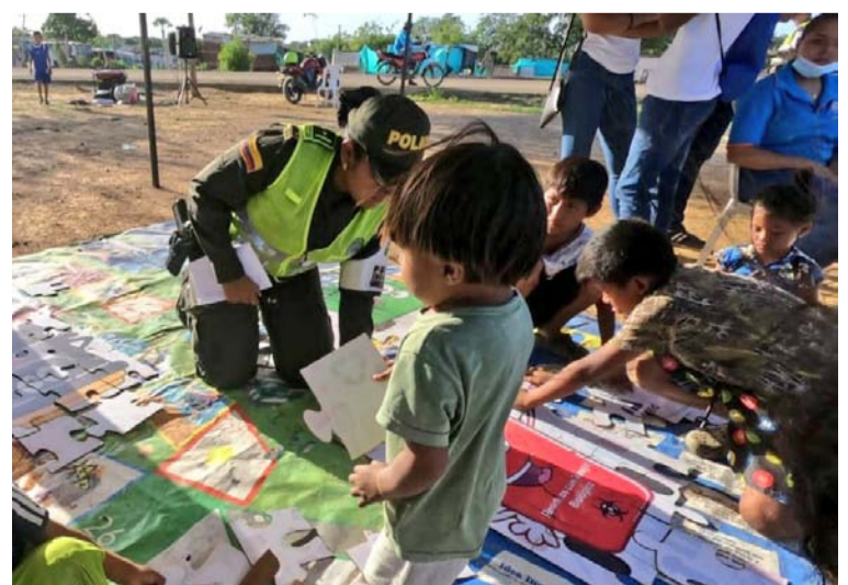
Con las cometas se vivió todo un espectáculo de color y sonrisas en compañía del presente y futuro del país.