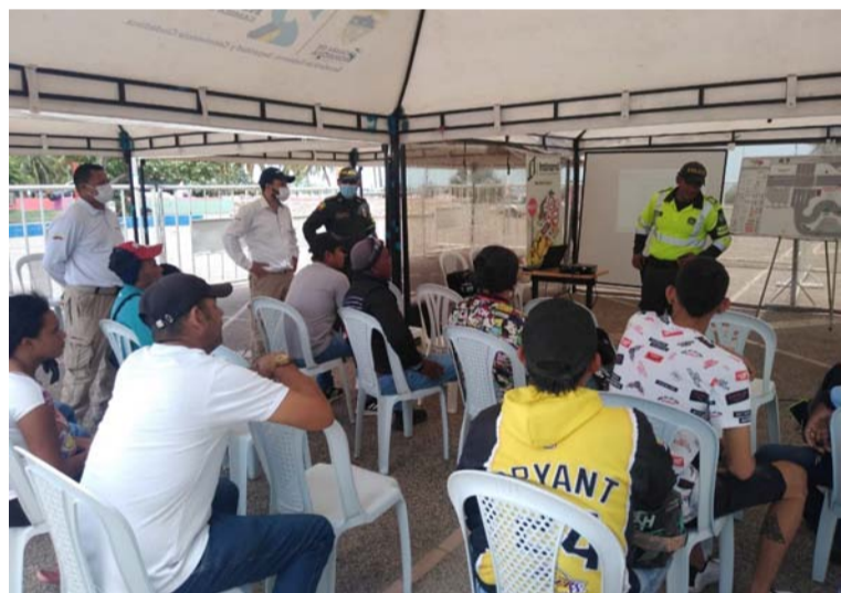
Las autoridades empezaron a intensificar los operativos para generar resultados contra las conductas punibles.

estrategias para combatir los delitos y fenómenos delictivos en los que estarían inmersos migrantes en esta zona fronteriza.