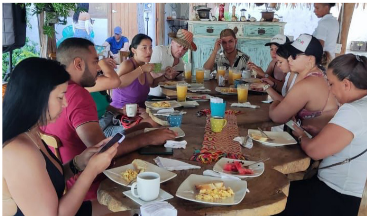
Grupo de visitantes que participaron del ‘Fam Trip’ realizado en el municipio de Dibulla y sus alrededores.

Además, hicieron parte de una caminata ecológica donde ellos pudieron percibir la riqueza natural de