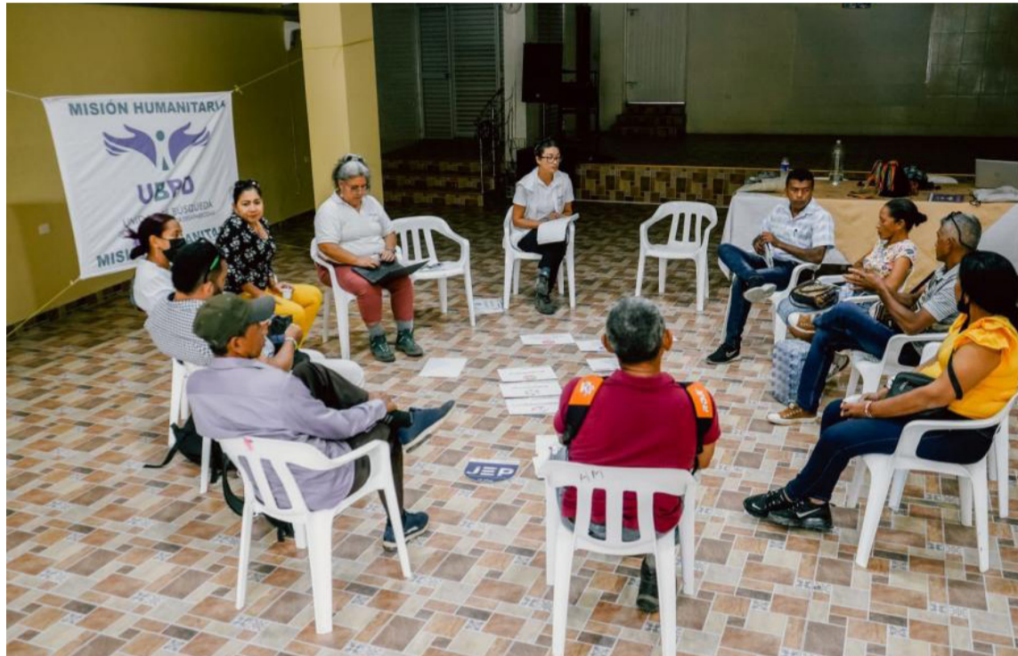
La Unidad realiza labores de búsqueda de restos de las víctimas por 'falsos positivos'.

Mientras que en el Magdalena las coberturas es