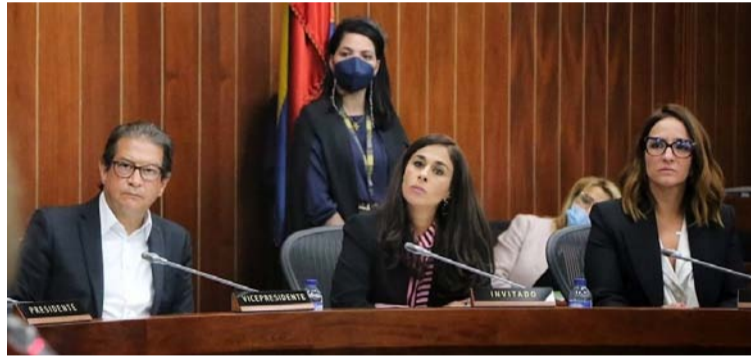
Senadores escuchan atentamente la problemática que se vive en las comunidades wayuú por la falta de agua potable.

“En este caso es un territorio que es inembargable, indescriptible e inalienable porque es un territorio indígena wayuú de la Alta y Media Guajira”, agregó.