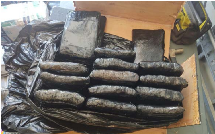
Estas son las bolsas que contenían marihuana en su interior. El sujeto que las transportaba terminó capturado.

Cabe mencionar que el alucinógeno incautado está