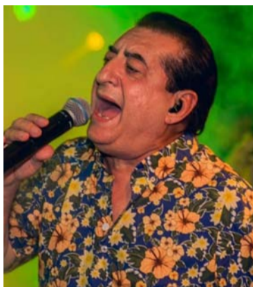
El Festival rendirá tributo al maestro Jorge Oñate.

La cita es especial porque será la versión 55 del Festival de la Leyenda Vallenata, en homenaje a Jorge Oñate, ‘La Leyenda’, donde se escogerán al Rey de Reyes en las categorías de Acordeón Profesional, Canción Vallenata Inédita y Piquería Mayor. A nuevos ganadores de los concursos de Acordeonera Mayor, Acordeón Aficionado, Acordeón Juvenil, Acordeón Infantil, Acordeonera Menor, Piquería Infantil y Piloneras.