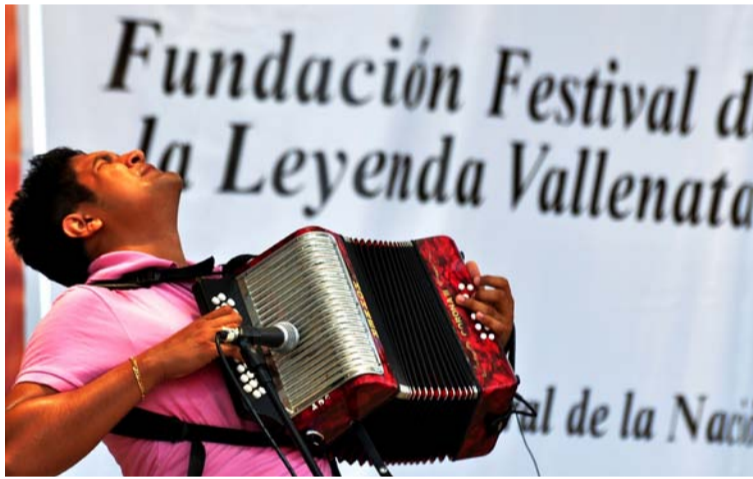
Paseos, merengues, sonos y puyas, se escucharán en Valledupar durante 5 días por cuenta del folclor vallenato.

La misma Consuelo Araujonoguera lo dejó plasmado en uno de sus célebres escritos. “Para sacar adelante el Festival de la Leyenda Vallenata han sido indispensables noches de insomnio y días sin descanso, pero hoy podemos decir que pese a que la tarea no está concluida, hemos logrado rescatar parte importantísima de nuestro pasado histórico y echar las bases de lo que ahora es sin discusión, la mejor imagen de Valledupar, tierra de encanto, y de lo que los vallenatos somos y representamos ante Colombia y el mundo”.