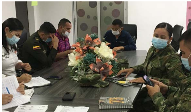
Comité de orden público en relación a las próximas elecciones presidenciales realizado en Fonseca.

Informaron que en relación a la situación migratoria se deben trazar estrategias para evitar conductas punibles que puedan afectar a la comunidad fonsequera.