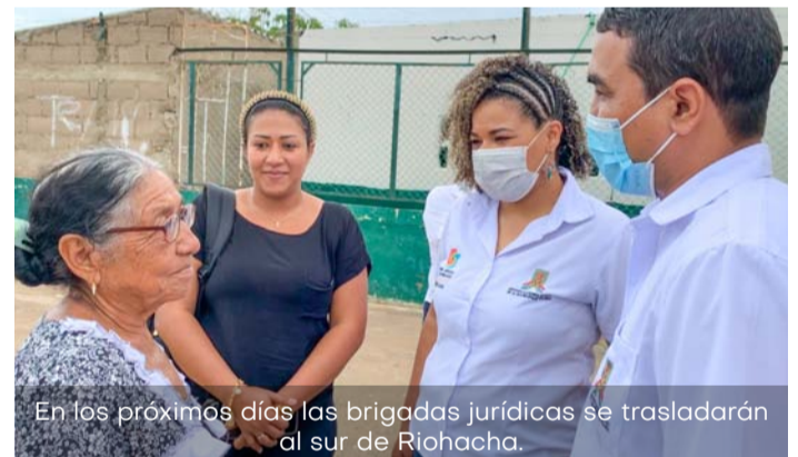
En los próximos días las brigadas jurídicas se trasladarán al sur de Riohacha.

Esta es una de las acciones que lidera la Universidad de La Guajira con el fin de impactar al contexto regional, y en este caso, a mejorar sobre todo la calidad de vida de las comunidades guajiras a través de la disposición de componente estudiantil capacitado con una educación de calidad.