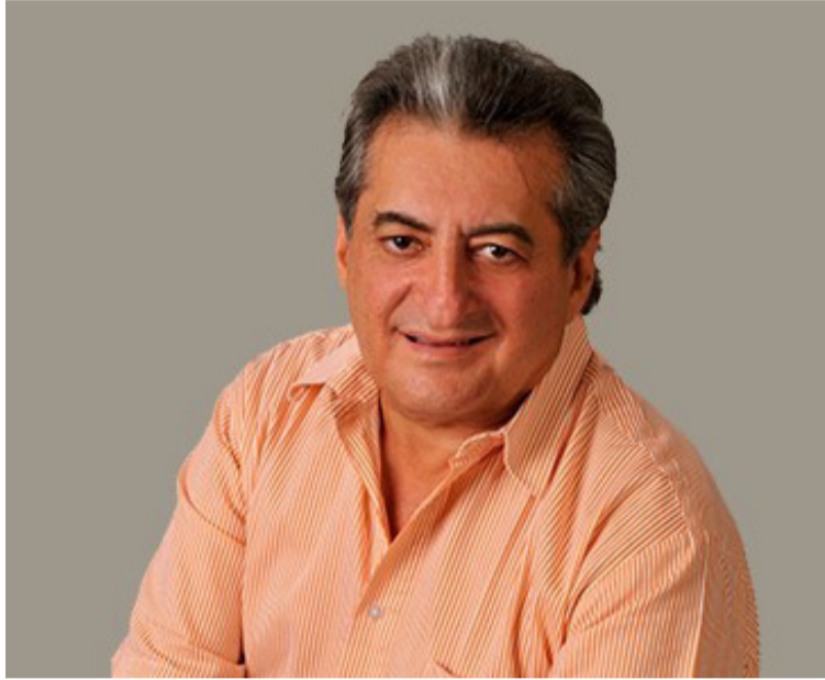
El conversatorio versará sobre el aporte que hizo el cantante Jorge Oñate a la historia del folclor vallenato.