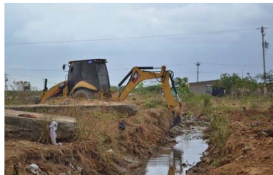
Se intervienen el arroyo Erika Beatriz y el canal que colinda con el Colegio Madre Laura.

nal que colinda con el colegio Madre Laura y el barrio Nazareth.