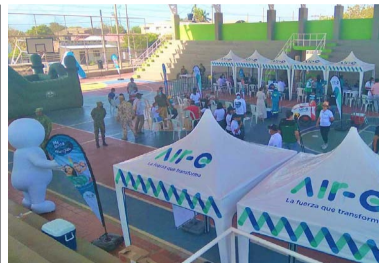
En el marco de la jornada comercial la compañía desarrollará trabajos de mejora en la infraestructura eléctrica.