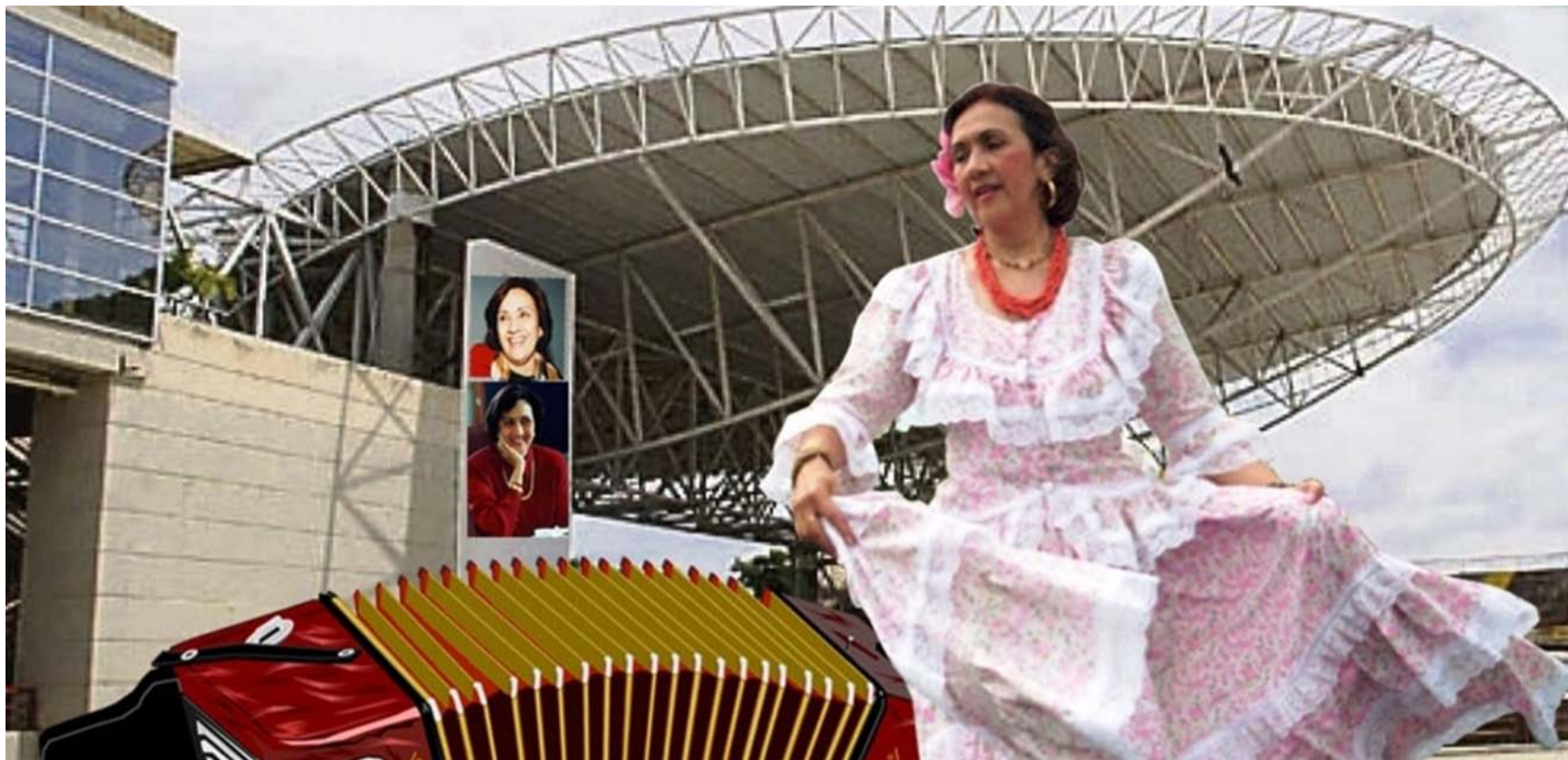
Consuelo Araujonoguera supo darle la mayor importancia a la música vallenata que hoy representa a Colombia ante el mundo.