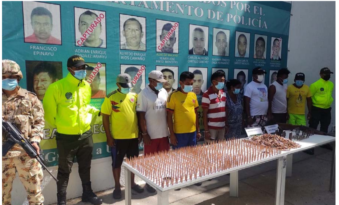
Grupo de wayuú que fue detenido con municiones, granada y elementos hurtados.

El Juzgado Primero Penal Municipal con funciones de control de garantías ambulante de Riohacha impuso medida de aseguramiento a los ocho capturados la semana pasada por estar vinculados a varios hechos delictivos en vías de La Guajira.