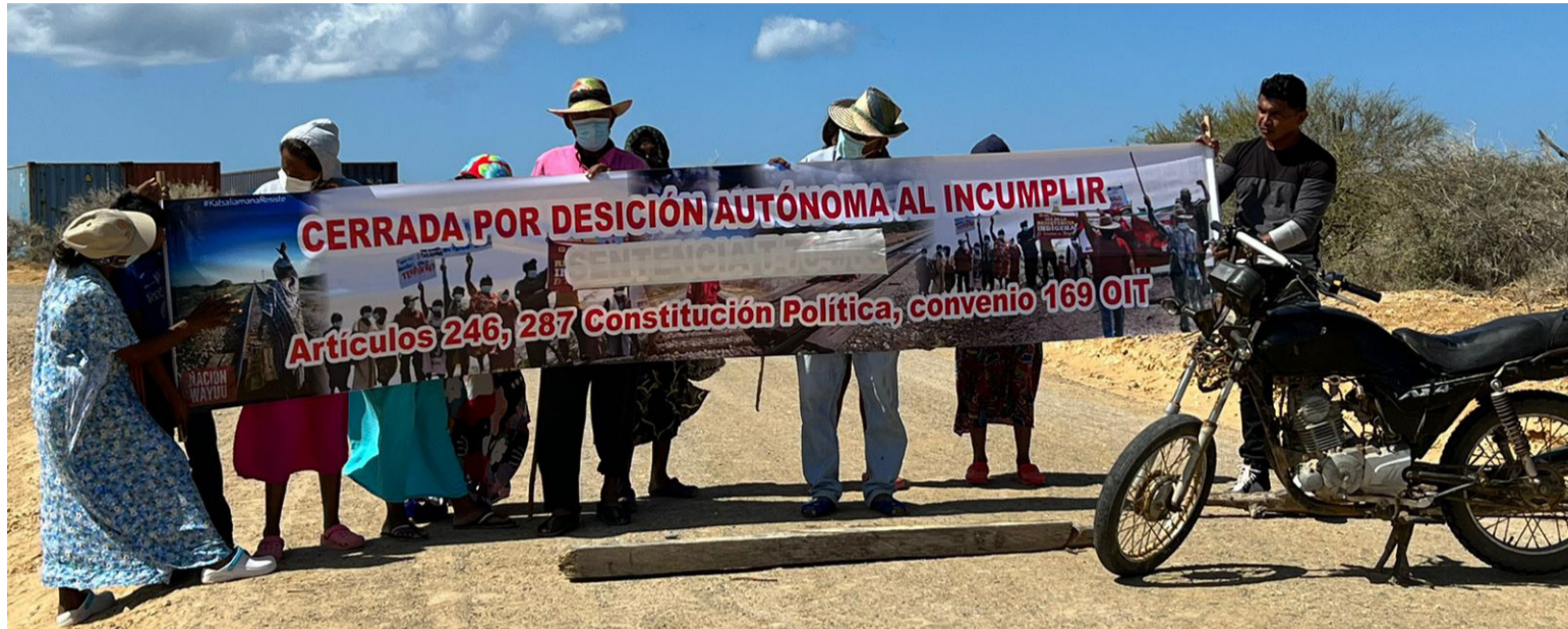
Las comunidades de Malee, Woupase y Maluy piden al presidente la no inauguración del parque en el Cabo de la Vela.

Expresaron también que “el panorama del territorio donde se va a inaugurar el parque eólico, es desolador y de total abandono, el cumplimiento de la consulta previa libre e informada como derecho fundamental de los pueblos indígenas, solo es un sofisma distractor o bien sea de engaño y manipulación; engaño y manipulación que ha traído graves consecuencias para nosotros los wayuú, quienes por nuestro alto grado de vulnerabilidad somos presas fáciles de las empresas extractivistas que ingresan a nuestros territorios con