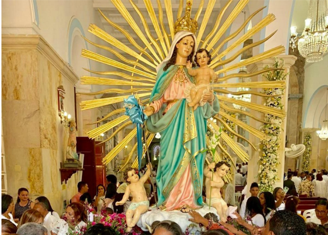
Se colocaron más misas para que la Catedral pueda estar más des congestionada.

Precisó que el 2 de febrero la eucaristía será cada