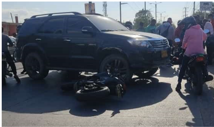
Aspecto del choque entre la camioneta y la moto en la calle 15 de Riohacha que dejó herido al motociclista.

Se conoció que el conductor de la motocicleta duró poco más de media hora esperando ser auxiliado por