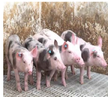
Restringen ingreso de productos de origen porcino.

Ante la confirmación de seis casos positivos a la fecha y que se espera aumen-