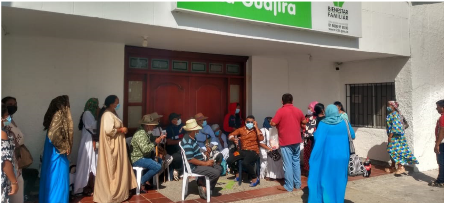
Las autoridades tradicionales exigen que haya una solución y que el Icbf pague el dinero que se les adeuda.

Hasta el cierre de esta edición en el Icbf seccional de La Guajira no había pronunciado al respeto sobre las peticiones de las autoridades de las comunidades wayuú.