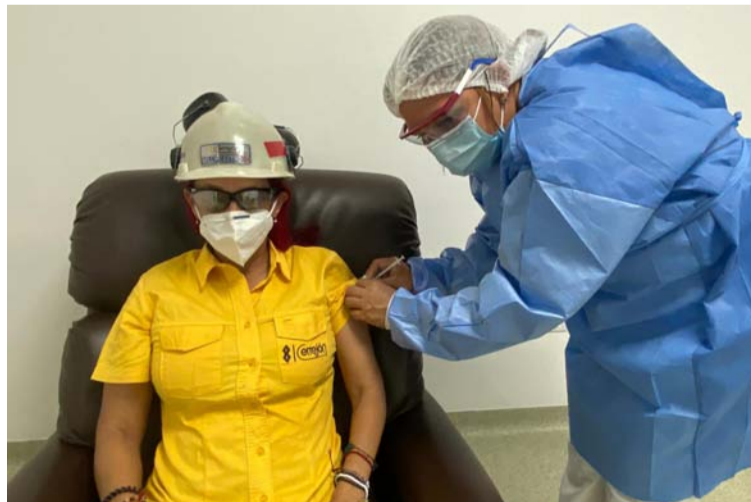
El Cerrejón continúa con estrictos controles y medidas de bioseguridad para reducir el riesgo de contagio.

Dentro de la operación se destacan el programa de tamizaje masivo; la ventilación adecuada de las áreas; el distanciamiento social; el uso permanente de mascarilla; entre otras