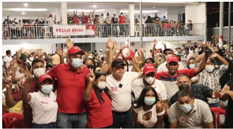
Movimiento Cambiemos la Historia escuchó las iniciativas.