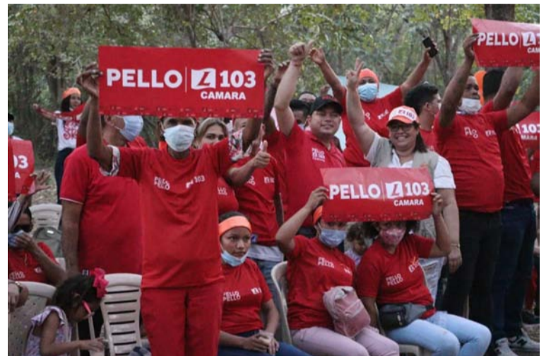
Miembros del movimiento Unidos Somos Más y el candidato.