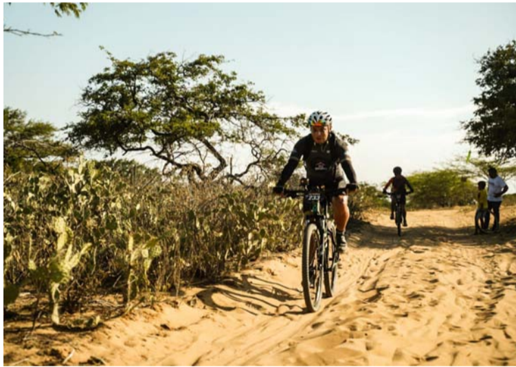
Se espera la participación en el recorrido por La Guajira de visitantes de Chile, Argentina, España y Costa Rica.

La actividad se desarrolla en el marco de Guajira Bike Challenge, liderada por la Dirección de Turismo departamental, que busca posicionar a La Guajira como un destino predilecto para los turistas con el desarrollo de diferentes eventos y encuentros; una de las categorías de mayor interés de los visitantes nacionales e internacionales es el