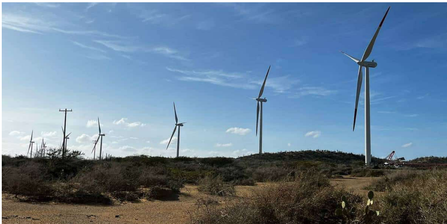
Según Isagen, la Autoridad Nacional de Consulta Previa certificó a las comunidades Mushalerrain, Taruásaru y Lanshalía.

En la tradición de los wayuú estas personas pueden disponer de los recursos del mismo para la subsistencia, pero no pueden decidir sobre el destino del territorio, y eso es precisamente lo que reclaman las tres comunidades donde se montó el parque eólico Guajira I.