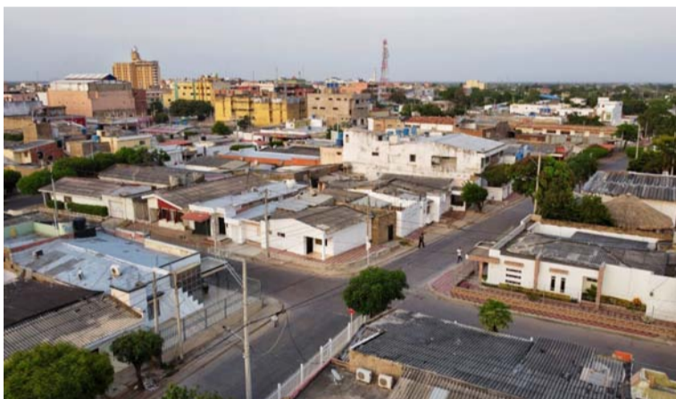
Un nuevo hecho de sangre sacude a Maicao con el atentado sicarial que dejó un hombre muerto y dos heridos.