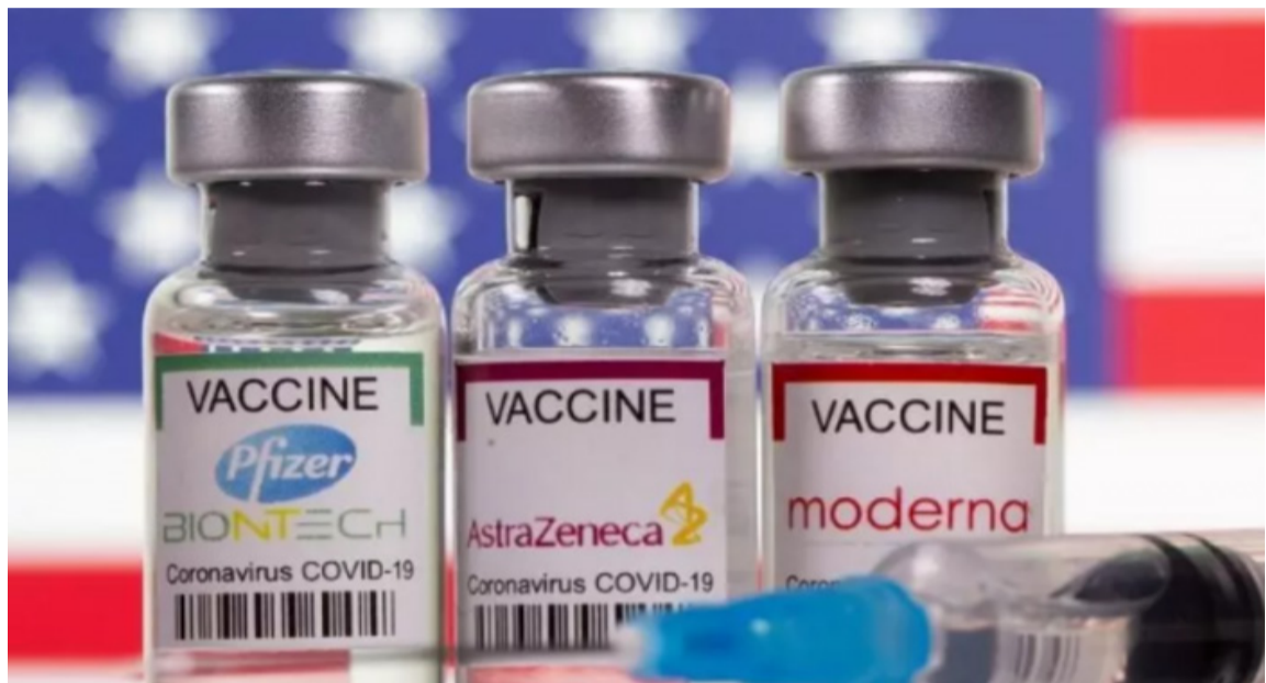
El refuerzo ayuda a las personas a mantener su nivel de inmunidad por más tiempo.

“No es que no se pueda usar la misma vacuna, pero no es la mejor opción. Si después de hacer la explicación de los beneficios de la plataforma una persona decide no hacerlo, podría recibir la misma vacuna”, indica el director.